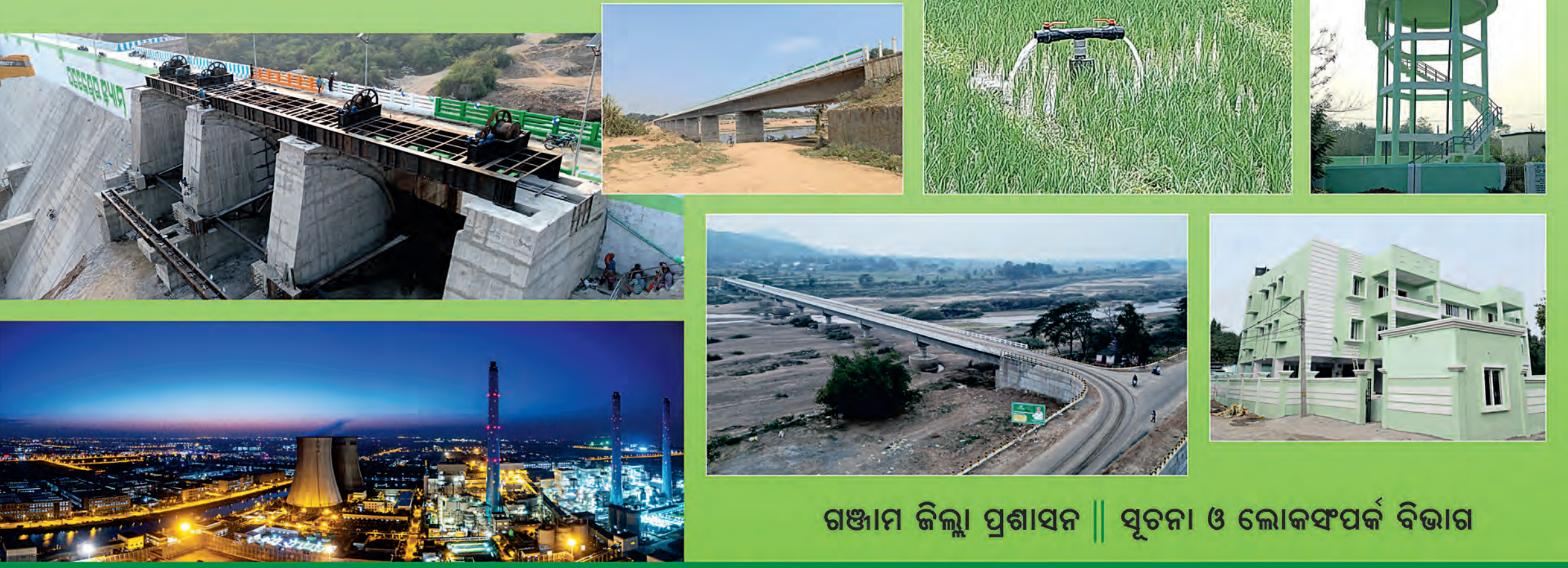
ଗଞ୍ଜାମ ଜିଲ୍ଲା ପ୍ରଶାସନ || ସୂଚନା ଓ ଲୋକସଂପର୍କ ବିଭାଗ