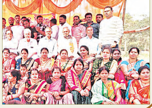
କୃତଜ୍ଞ,୧୩୧୨(ସମ୍ବିଧ): କୃତଜ୍ଞ ରୁକ୍ମ ଫାଉଣ୍ଡେସନ୍ ମାଧ୍ୟମରେ ପୁରୁଣା ଦିନର ପୁଣି ଭୋଗଧାନ କରିଥିଲେ ।