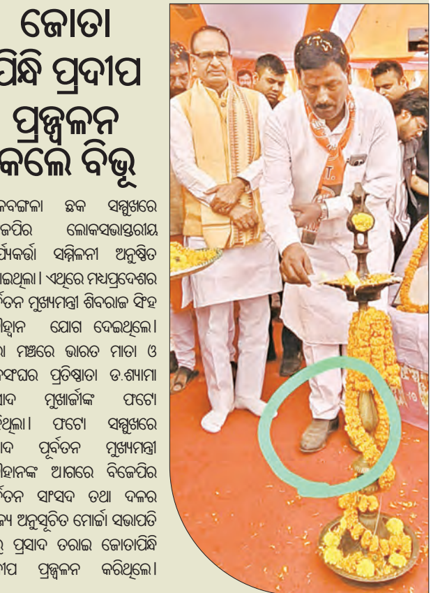
ଜୋତା ପିନ୍ଧି ପ୍ରଦୀପ ପ୍ରଜ୍ୱଳନ କରିଥିଲେ ।