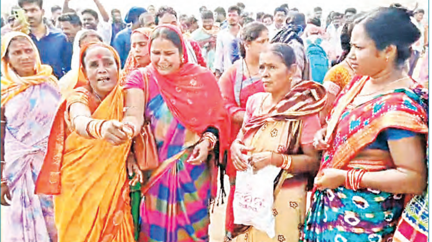
ପରିସ୍ଥିତି ସୃଷ୍ଟି ହେବାରୁ ଅଭୟତାହସୁର ପୂର୍ଣ୍ଣ ପହଞ୍ଚି ଉତ୍ତରୁପ ଶ୍ରମିକମାନଙ୍କ ସହିତ ଆଲୋଚନା କରିଥିଲେ । ଶାନ୍ତିପୂର୍ଣ୍ଣ ଭାବରେ ଧାରଣାରେ ବସିଥିଲେ ମଧ୍ୟ କମ୍ପାନୀ କୌଣସି ଆଲୋଚନା କରିବା ପରିବର୍ତ୍ତେ ଧାରଣାରେ ବସିଥିବା ଶ୍ରମିକଙ୍କ ଉପରେ ଚାରି ଦାବି ପୂରଣ ନକଲେ ଆନ୍ଦୋଳନ ତାକୁ କରିବାକୁ ଧାରଣାରେ ଶ୍ରମିକମାନେ ତେତାବନା ଦେଇଛନ୍ତି ।

ହୋଇଥିବା ଆଲୋଚନା ବିଫଳ ହେବାରୁ ଆଜି ସକାଳୁ ଧାରଣାରେ ଶତାଧିକ ଶ୍ରମିକ ସେମାନଙ୍କ ପରିବାର ସହିତ ପାଇପାଇନ ପ୍ରକଳ୍ପ ଫାଟକ ସମ୍ପର୍କରେ ଧାରଣାରେ ବସିବା ସହିତ କମ୍ପାନୀ ଗେଟ୍ ବନ୍ଦ କରିଦେଇଥିଲେ । ଯାହା ପରେ କମ୍ପାନୀ ମଧ୍ୟକୁ ଯାତାୟତ ପ୍ରତାପିତ ହୋଇଥିବା ବେଳେ କମ୍ପାନୀର କିଛି ଅଧିକାରୀ କୋର ଜବରଦସ୍ତ ଗେଟ୍ ଦେଇ ପ୍ରବେଶ କରିବାକୁ ନେଇ କମ୍ପାନୀର ସୁରକ୍ଷା ଦାୟିତ୍ୱରେ ଥିବା ସିଆଇଏସଏମ୍ ଓ ଶ୍ରମିକ ମାନଙ୍କ ପରିବାର ମଧ୍ୟରେ ଧସାଧସି ପରିସ୍ଥିତି ସୃଷ୍ଟି ହୋଇଥିଲା । ଫଳରେ ଘଟଣାସ୍ଥଳରେ ଉଡ୍ଡେଇନା