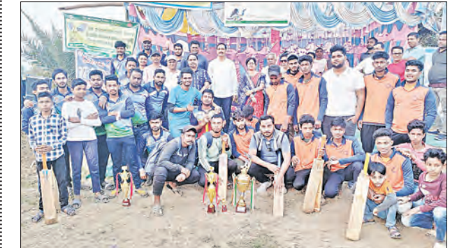
ଗାଦିବୁକ୍ତ କ୍ରିକେଟ ଟୁର୍ଣ୍ଣାମେଣ୍ଟ ଉଦ୍‌ଯାପିତ ହୋଇଥିଲା ।