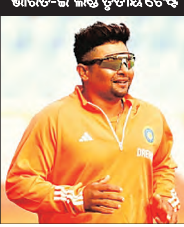
ଭାରତ-ଜ୍ୱାଲିତ ତୃତୀୟ ଟେଷ୍ଟ ଏକପ୍ରକାର ନିଶ୍ଚିତ ହୋଇଛି । ଏଠାରେ ସେ ମଧ୍ୟ ପ୍ରଥମ ପ୍ରଶିକ୍ଷକ ରାହୁଲ ଦ୍ୱାବିତଙ୍କ ତତ୍ପରାଧୀନରେ ଦୀର୍ଘ ସମୟ ଧରି ଅଭ୍ୟାସ କରିଥିଲେ । ଓକେଟ ପକ୍ଷରେ

ରାଜକୋଟ, ୧୩/୧୨ (ଏକେଡ଼ି): ଭାରତ ଓ ଜ୍ୱାଲିତ ମଧ୍ୟରେ ଏଠାରେ ଖେଳାଯିବାକୁ ଥିବା ତୃତୀୟ ଟେଷ୍ଟ ମ୍ୟାଚ୍ ଆଉ ଗୋଟିଏ ଦିନ ପରେ ଆରମ୍ଭ ହେବ । ଏଥିଲାଗି ଉଭୟ ଦଳ ଏଠାରେ ପହଞ୍ଚିବା ସହ ଜୋରଦାର ଅଭ୍ୟାସ ଆରମ୍ଭ କରିଦେଇଛନ୍ତି । ଜ୍ୱାଲିତ ଦଳ ପ୍ରଥମେ ଅଭ୍ୟାସ କରିବାକୁ ଆସିଥିଲା । କିନ୍ତୁ ଏମାନେ ଯେପରି ଅଭ୍ୟାସ କରିଥିଲେ, ସେଥିରେ କେବଳ ଅଲ୍ଲମ୍ବଣମୂଳକ ଖେଳ ଖେଳିବେ ବୋଲି ଜଣାଯାଇଥିଲା । ଅନ୍ୟ ପକ୍ଷରେ ଭାରତୀୟ ଦଳ ପାରମ୍ପରିକ ଭାବେ ଅଭ୍ୟାସ କରିଥିଲେ । ଏଭଳି ସମୟରେ ହୁଲ ନବାଗତ ଖେଳାଳିଙ୍କ ଟେଷ୍ଟ ପଦାର୍ପଣ ନେଇ ଜୋରଦାର ଚର୍ଚ୍ଚା ହେଉଛି । ବିରାଟ କୋହଲିଙ୍କ ଅନୁପସ୍ଥିତି, ଲୋକେଶ ରାହୁଲ ଓ ଶ୍ରେୟାସ ଆୟରଙ୍କୁ ବାନ୍ଦ୍ ଦେବା ପରେ ଭାରତୀୟ ମିଡ଼ଲ ଅର୍ଡର ଦୁର୍ବଳ ହୋଇପଡ଼ିଛି । ଏଣୁ ମୁମ୍ବାଇ ପକ୍ଷରୁ ଖେଳୁଥିବା ସର୍ପରାଜ ଖାନ ଏଠାରେ ଟେଷ୍ଟ ପଦାର୍ପଣ କରିବା