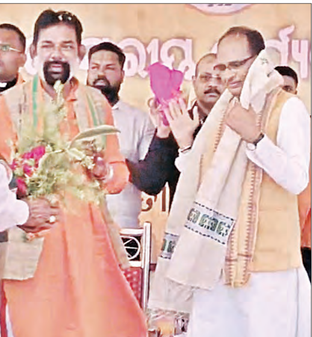
ଜଗତସିଂହପୁର/ଡି.ଭେ.ଇ. ୧୩୧୨(ସମ୍ବିଧ) ସହରର ତାକବଜଙ୍ଗ ଛକ ସମ୍ମୁଖରେ ବିଜେପି ପକ୍ଷରୁ ଆୟୋଜିତ ଲୋକସଭାସଭାରେ କାର୍ଯ୍ୟକର୍ତ୍ତା ଶିବରାଜ ଫିହ ଚୌହାନ ମୁଖ୍ୟଅତିଥି ଭାବେ ଯୋଗ ଦେଇଥିଲେ । ପ୍ରଥମେ ସେ ଜଗତସିଂହପୁରରେ ଅତିଥି ଭାବେ ଯୋଗ ଦେଇଥିଲେ । ଯୋଗ ଦେଇଥିବା ସମ୍ମାନୀତ ଶିବରାଜ ଫିହ ଚୌହାନଙ୍କୁ ମୁଖ୍ୟ ଅତିଥି ଭାବରେ ଯୋଗ ଦେଇଥିଲେ ।