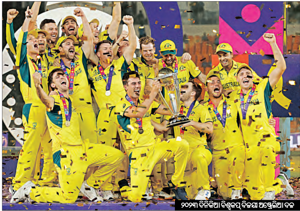
୨୦୨୩ ଦିନିକିଆ ବିଶ୍ୱକପ ବିଜୟ ଅଷ୍ଟ୍ରେଲିଆ ଦଳ

ବିଶ୍ୱକପର ୮ମ ଫେଡ଼ରଶ ୨୦୨୩ରେ ଦକ୍ଷିଣ ଆଫ୍ରିକାରେ ଆୟୋଜିତ ହୋଇଥିଲା । ଗ୍ରୀଷ୍ମ ପର୍ଯ୍ୟାୟରେ ୪୯୫ ୪ ମ୍ୟାଚ୍ ଜିତି ସେମିଫାଇନାଲରେ ପ୍ରବେଶ କରିଥିଲା । ଅଷ୍ଟ୍ରେଲିଆ କଡ଼ା ଫର୍ମରେ ପୁଣି ଫାଇନାଲରେ ଅଷ୍ଟ୍ରେଲିଆ ମାତ୍ର ୫ ରନରେ ଭାରତକୁ ପରାସ୍ତ କରି ପାଇନାଲରେ ପହଞ୍ଚିଥିଲା । ଏହାପରେ ଘରୋଇ ଦକ୍ଷିଣ ଆଫ୍ରିକା ସହ ପାଇନାଲ ମୁକାବିଲା ହୋଇଥିବାବେଳେ