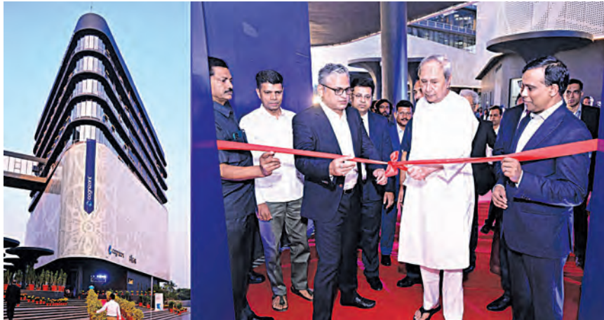
ଓଡ଼ିଶାର ଯୁବକଯୁବତୀଙ୍କ ପାଇଁ ନିୟୁକ୍ତିର ଅପାର ସୁଯୋଗ: ମୁଖ୍ୟମନ୍ତ୍ରୀ ପ୍ରତ୍ୟେକ କ୍ଷେତ୍ରରେ ବୃଦ୍ଧ ଆତ୍ମବିଶ୍ୱାସରେ ଆଗେଇ ଚାଲିଛି ଆମ ରାଜ୍ୟ ନିୟୁକ୍ତି ପାଇବେ ୮୦୦ରୁ ଅଧିକ ଦକ୍ଷ କର୍ମଚାରୀ

■ ଭୁବନେଶ୍ୱର, ୧୧/୨ (ସମ୍ପାଦକ): ଗୋଟିଏ ପରେ ଗୋଟିଏ ବିଶ୍ୱାସ ପ୍ରତିଷ୍ଠିତ ଆଇଡି କମ୍ପାନୀ ଓଡ଼ିଶାରେ କାରବାର ପାଇଁ ଆଗେଇ ଆସୁଛନ୍ତି। ଏହି କ୍ରମରେ ରବିବାର ଆଉ ଏକ ଅଗ୍ରଣୀ ଆଇଡି ପ୍ରତିଷ୍ଠାନ କର୍ମିଜେଣ୍ଟ ବିଧିବଦ୍ଧ ଭାବେ ଭୁବନେଶ୍ୱରରେ ନିଜ କାର୍ଯ୍ୟାଳୟ ପ୍ରତିଷ୍ଠା କରିଛି। ବିଶ୍ୱାସ ଅନ୍ୟତମ ଅଗ୍ରଣୀ ପ୍ରଯୁକ୍ତିବିଦ୍ୟା ସେବା ପ୍ରଦାନକାରୀ କମ୍ପାନୀ କର୍ମିଜେଣ୍ଟର କାର୍ଯ୍ୟାଳୟକୁ ମୁଖ୍ୟମନ୍ତ୍ରୀ ନବୀନ ପଟ୍ଟନାୟକ ଉଦ୍ଘାଟନ କରି ଏହାକୁ ଓଡ଼ିଶାର ପ୍ରଗତି ଯାତ୍ରାର ଆଉ ଏକ ସଫଳ ଅଧ୍ୟାୟ ବୋଲି କହିଛନ୍ତି। ଏହି ଉପଲକ୍ଷେ ଆୟୋଜିତ ଏକ ସତନ୍ତ୍ର କାର୍ଯ୍ୟକ୍ରମରେ ଉପସ୍ଥିତ ମାଣ୍ୟଗଣ୍ୟ