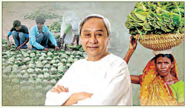
ପଦମ୍ପୁର ଉପ-ନିର୍ବାଚନ ପ୍ରତିଶ୍ରୁତି ପୂରଣ କଲେ ମୁଖ୍ୟମନ୍ତ୍ରୀ କେନ୍ଦ୍ରପଡ଼ା ତୋଳାଳିଙ୍କ ଲାଗି ମୋଟ ୨୫ ହଜାର କୋଟିର ପ୍ୟାକେଜ୍ ଉପକୃତ ହେବେ ରାଜ୍ୟର ୮.୫ ଲକ୍ଷ କେନ୍ଦ୍ରପଡ଼ା ତୋଳାଳି ଲାଭାନ୍ୱିତ ହେବେ ୪୦ ହଜାର ବନ୍ଧାଳି ଓ ସିଦ୍ଧନାଲ ଷ୍ଟାମ୍ପ୍ ଜାରି ରହିବ କେନ୍ଦ୍ରପଡ଼ା ତୋଳାଳିଙ୍କ ପିଲାଙ୍କ ବିବାହ ସହାୟତା

■ ଭୁବନେଶ୍ୱର, ୧୧/୨ (ସମ୍ବାଦ): ପଦମ୍ପୁର ଉପନିର୍ବାଚନ ସମୟରେ ମୁଖ୍ୟମନ୍ତ୍ରୀ ବେଳୁଥିବା ପ୍ରତିଶ୍ରୁତି ପୂରଣ କରିଛନ୍ତି ମୁଖ୍ୟମନ୍ତ୍ରୀ ନବୀନ ପଟ୍ଟନାୟକ । କେନ୍ଦ୍ରପଡ଼ା ତୋଳାଳି, ବନ୍ଧାଳି ଓ ଅସ୍ତାୟା କର୍ମଚାରୀଙ୍କ ସାଥୀ ପୂରଣ ପାଇଁ ମୁଖ୍ୟମନ୍ତ୍ରୀ ଘୋଷଣା କରିଛନ୍ତି ଐତିହାସିକ ନିଷ୍ପତ୍ତି । ମୁଖ୍ୟମନ୍ତ୍ରୀଙ୍କ ଘୋଷଣା ପରେ କେନ୍ଦ୍ରପଡ଼ା ତୋଳାଳି ଏବେ ପୂର୍ବତନରେ ଦୁଇଗୁଣ ବୋନସ ପାଇବେ । ଅର୍ଥାତ୍ ପୂର୍ବରୁ ପାଇଥିବା ୨୫% ବୋନସ ପରିବର୍ତ୍ତେ ଏବେ ତୋଳାଳିମାନେ ୫୦% ବୋନସ ପାଇବେ । ସେହିପରି କେନ୍ଦ୍ରପଡ଼ା ବନ୍ଧାଳି ଓ ସାମୟିକ କର୍ମଚାରୀ (ସିଦ୍ଧନାଲ ଷ୍ଟାମ୍ପ୍)ଙ୍କ ପ୍ରୋସ୍ତାହନ ରାଶି (ଇନ୍-ସେନ୍ଟିଭ)କୁ ମଧ୍ୟ ଦୁଇଗୁଣ କରିବାକୁ ମୁଖ୍ୟମନ୍ତ୍ରୀ ଘୋଷଣା କରିଛନ୍ତି । ପୂର୍ବରୁ ଏହି ପ୍ରୋସ୍ତାହନ ରାଶି ୫% ଥିଲା ଓ ଏବେ ତାହାକୁ ୧୦%କୁ ବୃଦ୍ଧି କରାଯାଇଛି । ଅନୁରୂପ ଭାବରେ କେନ୍ଦ୍ରପଡ଼ା ସିଦ୍ଧନାଲ ଷ୍ଟାମ୍ପ୍ ବେତନ ମଧ୍ୟ ମୁଖ୍ୟମନ୍ତ୍ରୀ ବୃଦ୍ଧି କରିଛନ୍ତି । ମୁଖ୍ୟମନ୍ତ୍ରୀଙ୍କ ଏହି ଘୋଷଣା ପରେ ରାଜ୍ୟର ୮ ଲକ୍ଷ ୫୦ ହଜାର କେନ୍ଦ୍ରପଡ଼ା ତୋଳାଳି ଏବଂ ୪୦ ହଜାର ବନ୍ଧାଳି ଓ ସିଦ୍ଧନାଲ ଷ୍ଟାମ୍ପ୍ ଉପକୃତ ହେବେ । ତୋଳାଳିଙ୍କ ବୋନସ ପାଇଁ ସରକାର