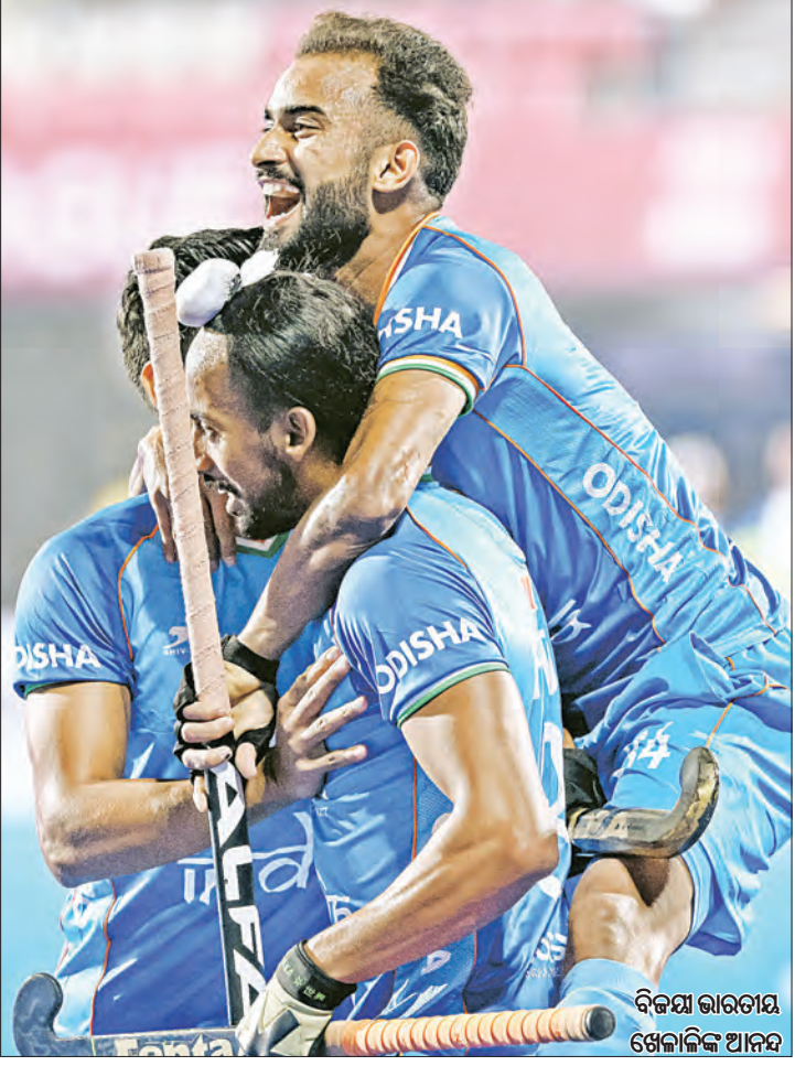
ବିଜୟ ଭାରତୀୟ ଖେଳାଳିଙ୍କ ଆନନ୍ଦ

ସ୍ଥାନୀୟ କଳିଙ୍ଗ ଷ୍ଟାଡ଼ିୟମରେ ଉଦ୍‌ଭାବ ଖେଳାୟକଙ୍କୁ ନେଦରଲାଣ୍ଡସ ବିପକ୍ଷ ପ୍ରୋ ଲିଗ୍ ମ୍ୟାଚ୍ ଘରୋଇ ଭାରତର ଦୁଇ ଖେଳାଳି ଅଧିନାୟକ ହରମନପ୍ରାଡ୍ ସିଏ ଓ ଗୁରୁଜୀନ୍ଦ୍ର ସିଏଙ୍କ ପାଇଁ ବେଶ୍ ସୁରୁଣୀୟ ରହିଥିଲା । ହରମନପ୍ରାଡ୍‌ଙ୍କ ଏହା ୨୦୦ତମ ଅନ୍ତର୍ଜାତୀୟ ମ୍ୟାଚ୍ ଥିଲା । ସେହିଭଳି ଗୁରୁଜୀନ୍ଦ୍ର ନିଜର ୧୦୦ତମ ମ୍ୟାଚ୍ ଖେଳିଥିଲେ ।