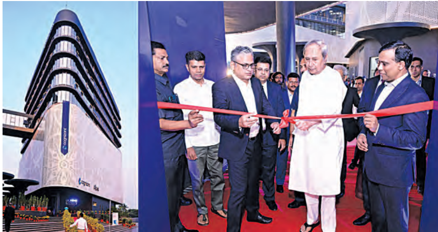
ଓଡ଼ିଶାର ଯୁବକଯୁବତୀଙ୍କ ପାଇଁ ନିୟୁକ୍ତିର ଅପାର ସୁଯୋଗ: ମୁଖ୍ୟମନ୍ତ୍ରୀ ପ୍ରତ୍ୟେକ କ୍ଷେତ୍ରରେ ଦୃଢ଼ ଆତ୍ମବିଶ୍ୱାସରେ ଆଗେଇ ଚାଲିଛି ଆମ ରାଜ୍ୟ ନିୟୁକ୍ତି ପାଇବେ ୮୦୦ରୁ ଅଧିକ ଦକ୍ଷ କର୍ମଚାରୀ

■ ଭୁବନେଶ୍ୱର, ୧୧/୨ (ସମ୍ପାଦକ): ଗୋଟିଏ ପରେ ଗୋଟିଏ ବିଶ୍ୱାସ ପ୍ରତିଷ୍ଠିତ ଆଇଡି କମ୍ପାନୀ ଓଡ଼ିଶାରେ କାରବାର ପାଇଁ ଆଗେଇ ଆସୁଛନ୍ତି। ଏହି କ୍ରମରେ ରବିବାର ଆଉ ଏକ ଅଗ୍ରଣୀ ଆଇଡି ପ୍ରତିଷ୍ଠାନ କର୍ମିଜେଣ୍ଟ ବିଧିବଦ୍ଧ ଭାବେ ଭୁବନେଶ୍ୱରରେ ନିଜ କାର୍ଯ୍ୟାଳୟ ପ୍ରତିଷ୍ଠା କରିଛି। ବିଶ୍ୱାସ ଅନ୍ୟତମ ଅଗ୍ରଣୀ ପ୍ରତିଷ୍ଠାନିକ ସେବା ପ୍ରଦାନକାରୀ କମ୍ପାନୀ କର୍ମିଜେଣ୍ଟର କାର୍ଯ୍ୟାଳୟକୁ ମୁଖ୍ୟମନ୍ତ୍ରୀ ନବୀନ ପଟ୍ଟନାୟକ ଉଦ୍ଘାଟନ କରି ଏହାକୁ ଓଡ଼ିଶାର ପ୍ରଗତି ଯାତ୍ରାର ଆଉ ଏକ ସଫଳ ଅଧ୍ୟାୟ ବୋଲି କହିଛନ୍ତି। ଏହି ଉପଲକ୍ଷେ ଆୟୋଜିତ ଏକ ସତ୍ତ୍ୱ କାର୍ଯ୍ୟକ୍ରମରେ ଉପସ୍ଥିତ ମାଣ୍ୟଗଣ୍ୟ