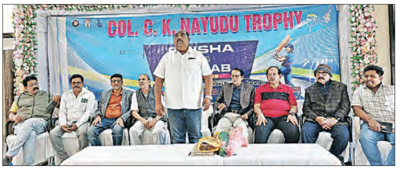
ବଳାଙ୍ଗିର, ୧୦/୧୨ (ସମିସ): ଓଡ଼ିଶା କ୍ରିକେଟ୍ ଆସୋସିଏସନ୍ ଏବଂ କିଲ୍ଲା କ୍ଲାଡ଼ା ଫାଉଣ୍ଡେସନ୍ ଆନୁକୁଲ୍ୟରେ ଆସନ୍ତା ୧୮ ରୁ ୨୧ ତାରିଖ

ପର୍ଯ୍ୟନ୍ତ ସ୍ଥାନୀୟ ଗାନ୍ଧୀ ସ୍ମାଡିୟମରେ ୨୩ ବର୍ଷରୁ କମ୍ ସିକେ ନାଲଡୁ ଟ୍ରଫି ଖେଳାଯିବ । ଏଥିରେ ଘରୋଇ ଓଡ଼ିଶାର ମୁକାବିଲା ପଞ୍ଚାବ ସହ ହେବ ।