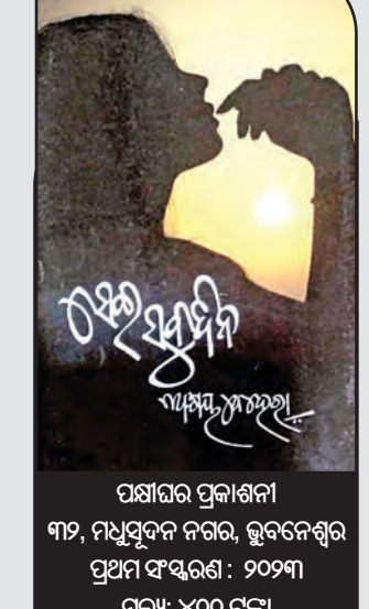
ପଞ୍ଚାୟତ ପ୍ରକାଶନୀ ୩୨, ମଧୁସୂଦନ ନଗର, ଭୁବନେଶ୍ୱର ପ୍ରଥମ ସଂସ୍କରଣ: ୨୦୧୩ ମୂଲ୍ୟ: ୪୦୦ ଟଙ୍କା

ମାଟିକୁ ଆବୋରି..." ପ୍ରକୃତରେ ଦେବୀରେ ହିଁ ଜୀବନର ସାଥିକତା ନିହିତ । ହୃଦୟକାମ ମଣିଷର ମନ ସର୍ବଦା ଜହ୍ନ ରାତି ପରି ନିର୍ମଳ । ଏହି କାବ୍ୟର ପ୍ରଥମ ପର୍ବ 'ପାତା ଉଦୟ'ରେ ଜୀବନର ନିରାଶ ସତ୍ୟ ପ୍ରତିଫଳିତ ହୋଇଛି ଅତି ଚମତ୍କାର ଭାବରେ । ଜୀବନରେ ଦୁଃଖ, ଯନ୍ତ୍ରଣାକୁ ଭୋଗ କରୁଥିବା ଅନୁଭବୀ ହିଁ ମଣିଷର ଅନ୍ତର୍ଦେହକୁ ଲିପିବଦ୍ଧ କରିପାରେ ନିଷ୍ପତ୍ତ ଭାବରେ । କାବ୍ୟ ପୁରୁଷ ପାପ, ପୁଣ୍ୟ ଉର୍ଦ୍ଧ୍ୱରେ ଜୀବନର ମହନାୟ, ସରାକୁ ଅନୁଭବ କରିଛନ୍ତି ହୃଦୟରେ ନିବିଡ଼ ଭାବରେ । ଏହି କାବ୍ୟର ବିଭିନ୍ନ ପର୍ବରେ ଜୀବନର ଦୁଃଖ, ଯନ୍ତ୍ରଣା, ହସ, ଲୁହ ପ୍ରତିଫଳିତ ହୋଇଛି । ମଣିଷ ସର୍ବଦା ଝୁରିହୁଏ ଚିତ୍ତମଧୁର ସ୍ମୃତିକୁ । ବହୁ ସକଳ ସ୍ମୃତି ଉକ୍ତି ଉଠିଛି ଏହି କାବ୍ୟରେ । 'ସେଇ ସବୁଦିନ' କାବ୍ୟ ପାଠକମାନଙ୍କୁ ଭଲ ଲାଗିବ ବୋଲି ଆଶା କରାଯାଏ ।