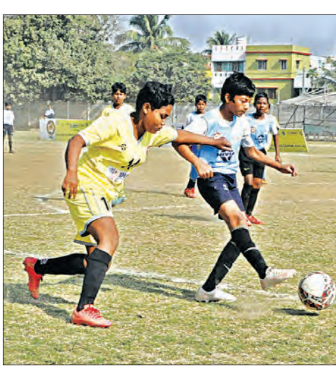
ଭୁବନେଶ୍ୱର, ୧୦/୧୨ (ସମିସ)

ଫୁଟ୍‌ବଲ ଆସୋସିଏସନ୍ ଆର୍ଡ୍ ଓଡ଼ିଶା (ପାଠ) ଆନୁକୁଲ୍ୟରେ କଟକରେ ଚାଲିଥିବା ଖେଲୋ ଲକ୍ଷ୍ମିଆ ମହିଳା ଫୁଟ୍‌ବଲ ଲିଗ୍ (୧୩ ବର୍ଷରୁ କମ୍) ରେ ଶନିବାର ଗାଟି ମ୍ୟାଚ୍ ଖେଳାଯାଇଥିଲା । ଏଥିରେ ପାଠ ଏକାଡେମୀ, ବିତ୍ତାନାସୀ କ୍ଲବ୍