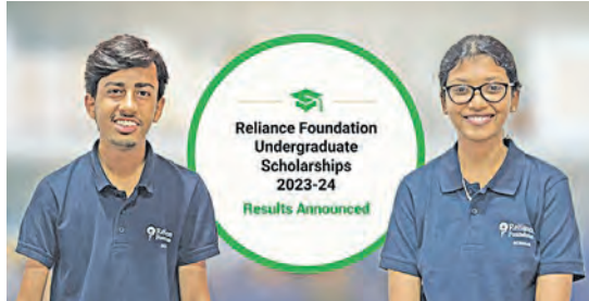
ରିଲାଇଣ୍ଡ ଫାଉଣ୍ଡେସନ୍ ଉପାଧ୍ୟକ୍ଷଙ୍କୁ ଶିକ୍ଷାବୃତ୍ତି ପ୍ରଦାନ କରାଯାଉଛି।