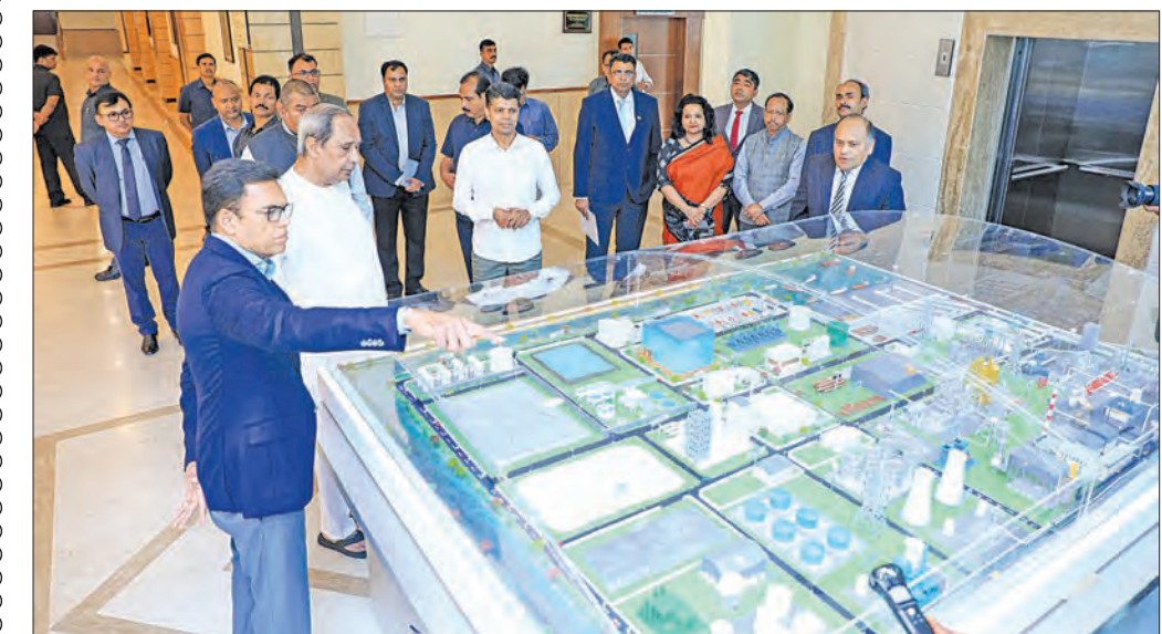
ଲୋକସେବା ଭବନରେ ଶନିବାର ମୁଖ୍ୟମନ୍ତ୍ରୀ ନବୀନ ପଟ୍ଟନାୟକ ଭବି ଏବଂ ଭବି ବ୍ୟାଚେରା ପ୍ରକଳ୍ପର ମଡେଲ ଦେଖୁଛନ୍ତି।

ପକ୍ଷରୁ ଭାଲେଣ୍ଡାଭନ୍ଦୁ... ପକ୍ଷରୁ ଭାଲେଣ୍ଡାଭନ୍ଦୁ ଡେ' ଅଫର