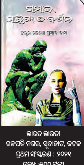
ଭାରତ ଭାରତୀ ଗଳପତି ନଗର, ସୁତାହାଟ, କଟକ ପ୍ରଥମ ସଂସ୍କରଣ: ୨୦୨୧ ମୂଲ୍ୟ: ୫୦୦ ଟଙ୍କା

'ଧର୍ମଛଡ଼ା ହେବାର ଲକ୍ଷଣ', 'ସାମୂହିକ ବିକାଶ', 'ଆଧୁନିକ ମୂଲ୍ୟବୋଧର ହ୍ରାସରେ ସାମାଜିକ ଅବସ୍ଥା' ଆଦି ପ୍ରବନ୍ଧ ସ୍ଥାନିତ ହୋଇଛି । ଏହି ସବୁ ପ୍ରବନ୍ଧରେ ତଥ୍ୟଭିତ୍ତିକ ଓ ସୂକ୍ଷ୍ମ ସଂଗତ ଆଲୋଚନା କରାଯାଇଛି । ଦର୍ଶନର ଅନେକ କ୍ଷେତ୍ରକୁ ସରଳ ଓ ବୋଧଗମ୍ୟ ଭାଷାରେ ଲେଖକ ବର୍ଣ୍ଣନା କରିଛନ୍ତି । ସେହିପରି ସାହିତ୍ୟ ସଂପର୍କିତ କେତୋଟି ଉଚ୍ଚକୋଟୀର ପ୍ରବନ୍ଧ ଓ ଆଲୋଚନା ସଂକଳିତ ହୋଇଛି ଏହି ପୁସ୍ତକରେ । 'ସାମାଜିକ ଜୀବନରେ ଲକ୍ଷ୍ମୀପୁରାଣର ଗୁରୁତ୍ୱ', 'ଶଶିସେଣା କାବ୍ୟରେ ଧର୍ମ ଓ ଦର୍ଶନ', 'ଗୀତି କବିତା, ଜୀବନ ଦର୍ଶନ ଓ ଭକ୍ତକବି ମଧୁସୂଦନ', 'କୃଷ୍ଣପ୍ରସାଦଙ୍କ ସାହିତ୍ୟିକ ସୃଷ୍ଟି ଓ ଦାର୍ଶନିକ ଦୃଷ୍ଟି', 'ବସନ୍ତ-ଗନ୍ଧ-ପରିକ୍ରମା' ଆଦି ପ୍ରବନ୍ଧରେ ଓଡ଼ିଆ ସାହିତ୍ୟର କେତେକଣ କବି, ଗାଳ୍ପିକଙ୍କ କୃତି ସଂପର୍କରେ ସୂକ୍ଷ୍ମ ଆଲୋଚନା କରାଯାଇଛି । 'ସମାଜ, ସାହିତ୍ୟ ଓ ଦର୍ଶନ' ପୁସ୍ତକଟି ଓଡ଼ିଆ ପ୍ରବନ୍ଧ ଓ ସମାଲୋଚନା ସାହିତ୍ୟକୁ ସମୃଦ୍ଧଶାଳୀ କରିବ ବୋଲି ଆଶା କରାଯାଏ ।