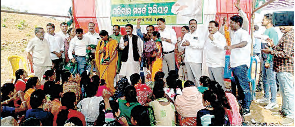
କୋରାପୁଟ, ୧୦/୨ (ସମିପ)

ବିଜେଡିରେ ଯୋଗଦେଲେ ୨୦୦ରୁ ଊର୍ଦ୍ଧ୍ୱ କଂଗ୍ରେସ କର୍ମୀ