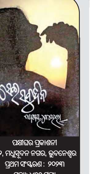
ପଞ୍ଚାୟତ ପ୍ରକାଶନୀ ୩୨, ମଧୁସୂଦନ ନଗର, ଭୁବନେଶ୍ୱର ପ୍ରଥମ ସଂସ୍କରଣ: ୨୦୨୩ ମୂଲ୍ୟ: ୪୦୦ ଟଙ୍କା

ମାଟିକୁ ଆବୋରି..." ପ୍ରକୃତରେ ଦେବାରେ ହିଁ ଜୀବନର ସାଥିକତା ନିହିତ । ହୃଦୟକାମ ମଣିଷର ମନ ସର୍ବଦା ଜହ୍ନ ରାତି ପରି ନିର୍ମଳ । ଏହି କାବ୍ୟର ପ୍ରଥମ ପର୍ବ 'ପାତା ଉଦୟ'ରେ ଜୀବନର ନିରାଶ ସତ୍ୟ ପ୍ରତିଫଳିତ ହୋଇଛି ଅତି ଚମତ୍କାର ଭାବରେ । ଜୀବନରେ ଦୁଃଖ, ଯନ୍ତ୍ରଣାକୁ ଭୋଗ କରୁଥିବା ଅନୁଭବୀ ହିଁ ମଣିଷର ଅନ୍ତର୍ଦେହନାକୁ ଲିପିବଦ୍ଧ କରିପାରେ ନିଷ୍ପତ୍ତ ଭାବରେ । କାବ୍ୟ ପୁରୁଷ ପାପ, ପୁଣ୍ୟ ଉର୍ଦ୍ଧ୍ୱରେ ଜୀବନର ମହନାୟ, ସରାକୁ ଅନୁଭବ କରିଛନ୍ତି ହୃଦୟରେ ନିବିଡ଼ ଭାବରେ । ଏହି କାବ୍ୟର ବିଭିନ୍ନ ପର୍ବରେ ଜୀବନର ଦୁଃଖ, ଯନ୍ତ୍ରଣା, ହସ, ଲୁହ ପ୍ରତିଫଳିତ ହୋଇଛି । ମଣିଷ ସର୍ବଦା ଝୁରିହୁଏ ଚିତ୍ତମଧୁର ସ୍ମୃତିକୁ । ବହୁ ସକଳ ସ୍ମୃତି ଉକ୍ତି ଉଠିଛି ଏହି କାବ୍ୟରେ । 'ସେଇ ସବୁଦିନ' କାବ୍ୟ ପାଠକମାନଙ୍କୁ ଭଲ ଲାଗିବ ବୋଲି ଆଶା କରାଯାଏ ।