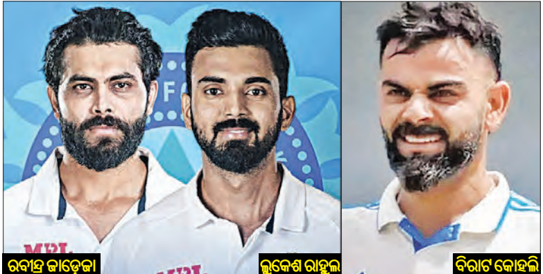
ରବିନ୍ଦ୍ର ଜାଡେଜା, ଭୃଗୁକେଶ ରାହୁଲ, ବିରାଟ କୋହଲି

ଭୁଆଦିଲ୍ଲା, ୧୦/୧୨ (ସମ୍ବିଧ) ସେ ସାମାନ୍ୟ ଆହତ ହେଇଥିବାରୁ ବାଦ୍ ପଡ଼ିବାର କାରଣ ସମ୍ପର୍କରେ ଜଣାପଡ଼ିନାହିଁ। ଏହି ଦୁଇ ଅଭିଜ୍ଞ ଖେଳାଳିଙ୍କ ସ୍ଥାନ ପୂରଣ କରିବା ଲାଗି ଆହତ ହୋଇ ବିଜୟ ଟେଷ୍ଟରୁ ବାଦ୍ ପଡ଼ିଥିବା ଲୋକେଶ ରାହୁଲ ଓ ରବିନ୍ଦ୍ର ଜାଡେଜାଙ୍କୁ ସାମିଲ ଦଳରେ କରାଯାଇଛି। ଉଭୟ ଦଳ ଲାଗି ଗୁରୁତ୍ୱପୂର୍ଣ୍ଣ ଭୂମିକା ଗ୍ରହଣ କରିବେ। ଦୁଆଦିଲ୍ଲା, ୧୦/୧୨ (ସମ୍ବିଧ) ଇଂଲଣ୍ଡ ବିପକ୍ଷ ଶେଷ ୩ଟି ଟେଷ୍ଟ ମ୍ୟାଚ୍ ଲାଗି ଶନିବାର ଭାରତୀୟ ବରିଷ୍ଠ ପୁରୁଷ କ୍ରିକେଟ୍ ଦଳ ଘୋଷଣା କରାଯାଇଛି। ଏହି ଦଳରେ ୧୬ଜଣ ଖେଳାଳିଙ୍କୁ ନିଆଯାଇଛି। କିନ୍ତୁ ବ୍ୟକ୍ତିଗତ କାରଣରୁ ପ୍ରଥମ ଦୁଇଟି ଟେଷ୍ଟରେ ଖେଳି ନ ଥିବା ପୂର୍ବତନ ଅଧିନାୟକ ତଥା ଷ୍ଟାର ବ୍ୟାଟ୍‌ମ୍ୟାନ ବିରାଟ କୋହଲିଙ୍କୁ ଏହି ଦଳରେ ସାମିଲ କରାଯାଇନାହିଁ। ସେ ପୁନର୍ବାର ଅନୁପସ୍ଥିତ ରହିବେ ବୋଲି ଚୟନକର୍ତ୍ତାଙ୍କୁ ସୂଚନା ଦେବା ପରେ ତାଙ୍କ ନାମ ବିଚାରକୁ ନିଆଯାଇ ନଥିଲା। ସେହିପରି ଆଦୌ ଫର୍ମରେ ନଥିବା ମିତଲ ଅର୍ଦ୍ଧତ୍ୟାଗର ଶ୍ରେୟସ୍ ଆୟରଙ୍କୁ ଅବଶିଷ୍ଟ ୩ଟି ମ୍ୟାଚ୍‌ରୁ ବାଦ୍ ଦିଆଯାଇଛି। ସେ ଅଷ୍ଟ୍ରେଲିଆ, ଦକ୍ଷିଣ ଆଫ୍ରିକା ଓ ଇଂଲଣ୍ଡ ବିପକ୍ଷରେ ୧୨ଟି ପାଲି ଖେଳି ମୋଟ ୧୮୬ ରନ୍ କରିଛନ୍ତି। ଏହା ମଧ୍ୟରେ ଘରୋଇ ମାଟିରେ ଇଂଲଣ୍ଡ ବିପକ୍ଷରେ ୧୮୩ ରନ୍ କରିଥିବା ୩୫ତମ ସର୍ବାଧିକ। କିନ୍ତୁ ଫିଜିଓ ପିଟ୍‌ନେସ୍ ସାର୍ଟିଫିକେଟ୍ ଦେବା ପରେ ସେମାନଙ୍କୁ ସାମିଲ କରାଯିବ କି ନାହିଁ ନିଶ୍ଚିତ ନିଆଯିବ। ଆକାଶବାପ ପ୍ରଥମଥର ସାମିଲ ବୋଲିଂରେ ମଧ୍ୟ କିଛି ପରିବର୍ତ୍ତନ କରାଯାଇଛି। ଉପଅଧିନାୟକ ଯଶପ୍ରାଦ୍