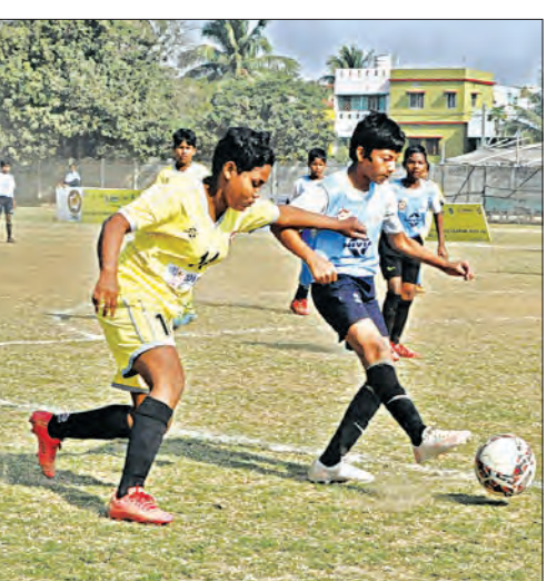
ଭୁବନେଶ୍ଵର, ୧୦/୧୨ (ସମ୍ବାଦ)

ଫୁଟ୍‌ବଲ ଆୟୋଜିତ ହେବ ଏବଂ ଓଡ଼ିଶା (ପାଓ) ଆନୁକୂଲ୍ୟରେ କଟକରେ ଚାଲିଥିବା ଖେଳୋ ଲକ୍ଷ୍ମିଆ ମହିଳା ଫୁଟ୍‌ବଲ ଲିଗ୍ (୧୩ ବର୍ଷରୁ କମ୍) ରେ ଶନିବାର ଗାଟି ମ୍ୟାଚ୍ ଖେଳାଯାଇଥିଲା। ଏଥିରେ ପାଓ ଏକାଡେମୀ, ବିତ୍ତାନାସୀ କ୍ଲବ୍