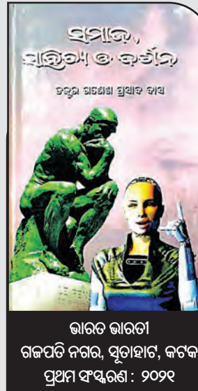
ଭାରତ ଭାରତୀ ଗଳପତି ନଗର, ସୁତାହାଟ, କଟକ ପ୍ରଥମ ସଂସ୍କରଣ: ୨୦୨୧ ମୂଲ୍ୟ: ୫୦୦ ଟଙ୍କା

'ଧର୍ମଛଡ଼ା ହେବାର ଲକ୍ଷଣ', 'ସାମୂହିକ ବିକାଶ', 'ଆଧୁନିକ ମୂଲ୍ୟବୋଧର ହ୍ରାସରେ ସାମାଜିକ ଅବକ୍ଷୟ' ଆଦି ପ୍ରବନ୍ଧ ସ୍ଥାନିତ ହୋଇଛି । ଏହି ସବୁ ପ୍ରବନ୍ଧରେ ତଥ୍ୟଭିତ୍ତିକ ଓ ସୂକ୍ଷ୍ମ ସଂଗତ ଆଲୋଚନା କରାଯାଇଛି । ଦର୍ଶନର ଅନେକ କ୍ଷେତ୍ର ତତ୍ତ୍ୱକୁ ସରଳ ଓ ବୋଧଗମ୍ୟ ଭାଷାରେ ଲେଖକ ବର୍ଣ୍ଣନା କରିଛନ୍ତି । ସେହିପରି ସାହିତ୍ୟ ସଂପର୍କିତ କେତୋଟି ଉଚ୍ଚକୋଟୀର ପ୍ରବନ୍ଧ ଓ ଆଲୋଚନା ସଂକଳିତ ହୋଇଛି ଏହି ପୁସ୍ତକରେ । 'ସାମାଜିକ ଜୀବନରେ ଲକ୍ଷ୍ମୀପୁରାଣର ସ୍ମରଣ', 'ଶଶିସେଣା କାବ୍ୟରେ ଧର୍ମ ଓ ଦର୍ଶନ', 'ଗୀତି କବିତା, ଜୀବନ ଦର୍ଶନ ଓ ଭକ୍ତକବି ମଧୁସୂଦନ', 'କୃଷ୍ଣପ୍ରସାଦଙ୍କ ସାହିତ୍ୟିକ ସୃଷ୍ଟି ଓ ଦାର୍ଶନିକ ଦୃଷ୍ଟି', 'ବସନ୍ତ-ଗନ୍ଧ-ପରିକ୍ରମା' ଆଦି ପ୍ରବନ୍ଧରେ ଓଡ଼ିଆ ସାହିତ୍ୟର କେତେକଣ କବି, ଗାଳ୍ପିକଙ୍କ କୃତି ସଂପର୍କରେ ସୂକ୍ଷ୍ମ ଆଲୋଚନା କରାଯାଇଛି । 'ସମାଜ, ସାହିତ୍ୟ ଓ ଦର୍ଶନ' ପୁସ୍ତକଟି ଓଡ଼ିଆ ପ୍ରବନ୍ଧ ଓ ସମାଲୋଚନା ସାହିତ୍ୟକୁ ସମୃଦ୍ଧଶାଳୀ କରିବ ବୋଲି ଆଶା କରାଯାଏ ।