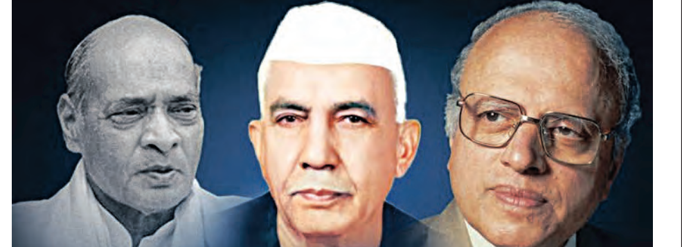
ପି.ଭି. ନରସିଂହ ରାଓ ପୂର୍ବତନ ପ୍ରଧାନମନ୍ତ୍ରୀ ଚୌଧୁରୀ ଚରଣ ସିଂହ ପୂର୍ବତନ ପ୍ରଧାନମନ୍ତ୍ରୀ ଏମ.ଏସ. ସ୍ୱାମୀନାଥନ ସରକାରୀ କର୍ମଚାରୀ

■ ନୂଆଦିଲ୍ଲୀ, ୯/୧୨ (ଏଜେନ୍ଟି): ଭାରତ ସରକାରଙ୍କ ପକ୍ଷରୁ ଶୁକ୍ରବାର ଐତିହାସିକ ଘୋଷଣା କରାଯାଇଛି । ବିଭିନ୍ନ କ୍ଷେତ୍ରରେ ଦେଶ ପାଇଁ ବରିଷ୍ଠ ଯୋଗଦାନ ଦେଇଥିବା ପୁଣି ତିନି ଜଣ ମହାନ ହସ୍ତୀଙ୍କୁ ସର୍ବୋଚ୍ଚ ନାଗରିକ ସମ୍ମାନ 'ଭାରତ ରତ୍ନ' ଦେବାକୁ ଘୋଷଣା ହୋଇଛି । ଏହି ମହାନ ବ୍ୟକ୍ତିତ୍ୱଙ୍କ ମଧ୍ୟରେ ପୂର୍ବତନ ପ୍ରଧାନମନ୍ତ୍ରୀ ଚୌଧୁରୀ ଚରଣ ସିଂହ, ପୂର୍ବତନ ପ୍ରଧାନମନ୍ତ୍ରୀ ପି.ଭି. ନରସିଂହ ରାଓ ଏବଂ ସରକାରୀ କର୍ମଚାରୀ ଏମ.ଏସ. ସ୍ୱାମୀନାଥନ ସାମିଲ ଅଛନ୍ତି । ପ୍ରଧାନମନ୍ତ୍ରୀ ନରେନ୍ଦ୍ର ମୋଦୀ ଏହି ସୂଚନା ଦେଇଛନ୍ତି । କୃଷି, କୃଷକଙ୍କ କଲ୍ୟାଣ, ଅର୍ଥନୈତିକ ସଂସ୍କାର ଏବଂ ରାଷ୍ଟ୍ର-ଗଠନରେ ସ୍ୱାମୀନାଥନଙ୍କ ଅବଦାନ ଅତୁଳନୀୟ । ଚୌଧୁରୀ ଚରଣ ସିଂହ ୧୯୦୨ ଡିସେମ୍ବର ୨୩ରେ ଉତ୍ତରପ୍ରଦେଶ ମାଉସିରେ ଜନ୍ମଗ୍ରହଣ କରି ୧୯୮୭ ମଇ ୨୯ରେ ମୃତ୍ୟୁବରଣ କରିଥିଲେ । ସେ ଦେଶର ପଞ୍ଚମ ପ୍ରଧାନମନ୍ତ୍ରୀ ।