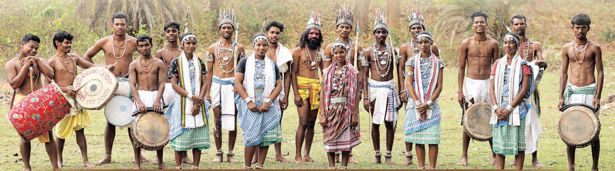
ଅନୁସୂଚିତ ଜନଜାତି ଓ ଅନୁସୂଚିତ ଜାତି ଉନ୍ନୟନ ତଥା ସଂଖ୍ୟାଲଘୁ ଓ ପଛୁଆ ବର୍ଗ କଲ୍ୟାଣ ବିଭାଗ