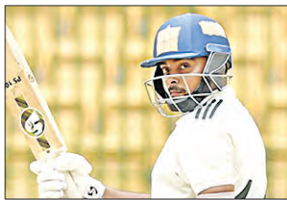
ମ୍ୟାଚରେ ମୁମ୍ବାଇ ଦୃଢ଼ ବ୍ୟାଟି କରିଛି। ଦୀର୍ଘ ଦିନର ବ୍ୟବଧାନ ପରେ ଦଳକୁ ଯେଉଁଥିବା ପୃଥ୍ୱୀ ଶୀଘ୍ର ଶତକ ସହାୟତାରେ ପ୍ରଥମ ଦିନର ଶ୍ରେଷ୍ଠ ବ୍ଲଟ୍ ମୁମ୍ବାଇ ୪ ଓକେଟ୍ ହରାଇ ୩୧୦ ରନ ସଂଗ୍ରହ କରିଛି।

ସେହିଭଳି ଜାମ୍ମୁ କାଶ୍ମୀର ଓ ଘରୋଇ ପୃଥ୍ୱୀଚରା ମଧ୍ୟରେ ଖେଳାଯାଇଥିବା ମ୍ୟାଚର ପ୍ରଥମ ଦିନରେ ୨୧ ଓକେଟ୍ରେ ଓପନ କରିଥିବା ପୃଥ୍ୱୀ ୧୦୬ ରନ କରିଥିବାବେଳେ ପୃଥ୍ୱୀଚରା ୧୨୭ ରନରେ ସାମିତ ରହିଥିଲେ।