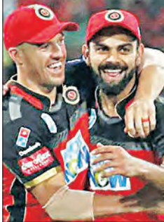
ଯାଉଥିବାରୁ କ୍ରେଜ୍ ନେଇଛନ୍ତି ବୋଲି ଡିଭିଲାର୍ସ କହିଥିଲେ। ତେବେ ଏହି କଥା ଆଣ୍ଡିଓ ଟୁହେଁ ଓ ଏହି ପୂର୍ବନା ଠିକ୍ ନ ଥିଲା ବୋଲି ସେ ସାକାର କରିଛନ୍ତି।

କୋହଲିଙ୍କୁ ନେଇ ଡିଭିଲାର୍ସଙ୍କ ଯୁତ୍ତ୍ୱ: ଦକ୍ଷିଣ ଆଫ୍ରିକା କିମ୍ବୁରୁଜୁ କ୍ରିକେଟର ଏବି ଡିଭିଲାର୍ସ ଭାରତୀୟ ବ୍ୟାଟିଂ ସୁପରଷ୍ଟାର ବିରାଟ କୋହଲିଙ୍କ ବ୍ୟକ୍ତିଗତ ତଥ୍ୟ ସାବିତ୍ରୀଙ୍କୁ ନିଜର ଭୁଲ ସାକାର କରିଛନ୍ତି।