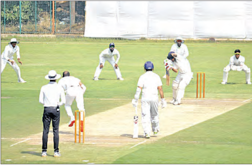
ଅନ୍ୟତମ ଓପନର ସଞ୍ଚିତ ସାଜଝାଜ ପଥ ଅଧିକ ସମୟ ଚିତ୍ତି ପାରିନଥିଲେ। ସେ ଶତକ କରିଥିବା ବେଳେ ପୁନାଲ ରାଉଟଙ୍କ ବଳରେ କ୍ରିକେଟର ବୋଲି ହୋଇଥିଲେ।

କଲିକତା ଗ୍ରୀଷ୍ମ ଋତୁର ଶୁଭକାରୀଙ୍କୁ ଭେଟିଛି ଓଡ଼ିଶା ଦଳ। ଚାଲିଥିବା ଦ୍ୱିପ୍ପ ଗ୍ରାଉଣ୍ଡରେ ଶୁଭକାରୀଙ୍କୁ ଭେଟିଛି ଓଡ଼ିଶା ଦଳ। ଚାଲିଥିବା ଦ୍ୱିପ୍ପ ଗ୍ରାଉଣ୍ଡରେ ଶୁଭକାରୀଙ୍କୁ ଭେଟିଛି ଓଡ଼ିଶା ଦଳ।