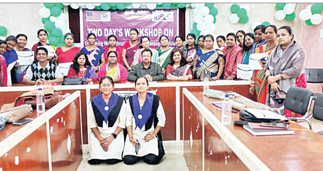
ଲିଡର, ଜାଗ୍ରିତି, ଗ୍ରାଜବାଲ ଲିଡର, ବ୍ୟାଙ୍କ ମିଡ୍ର, ମାନବସ୍ୱାଧିକାର କର୍ମୀ, ସ୍ୱେଚ୍ଛାସେବୀ

କେନ୍ଦୁଝର ସଦର ପଞ୍ଚାୟତ ସମିତି ପ୍ରଶିକ୍ଷଣ ଗୃହଠାରେ ସ୍ତ୍ରୀ ଅନୁଷ୍ଠାନ ପକ୍ଷରୁ ଏବଂ ଯୁବକ କନସ୍ପିକ୍ଟେସନ୍ ଜେନେରାଲ ହାଇଦ୍ରାବାଦ ସହାୟତାରେ ମହିଳାମାନଙ୍କ ପାଇଁ ଆଇନଗତ ସଚେତନତା ଉପରେ ଦୁଇଦିନିଆ ପ୍ରଶିକ୍ଷଣ କାର୍ଯ୍ୟକ୍ରମ ଅନୁଷ୍ଠିତ ହୋଇଯାଇଛି।