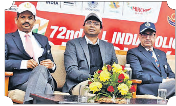
କମ୍ପ୍ୟୁଟର କେବେ ହାକୁ ଆଣିବେ? ଟିକଟ୍ ବିକ୍ରି ପ୍ରତିଯୋଗିତାକୁ ମୁଖ୍ୟ ଅତିଥି ପଦ୍ମଶ୍ରୀ ଦିଲୀପ ଚନ୍ଦ୍ର ଉଦ୍‌ସାଗର କରୁଛନ୍ତି। ଏହି ଅବସରରେ କମ୍ପ୍ୟୁଟର ଯୋଗିତା ମହାନିର୍ଦ୍ଦେଶକ ରଞ୍ଜନାକ୍ଷରୀ ସାଲ୍ (ବାମ) ଉପସ୍ଥିତ ରହିଛନ୍ତି।