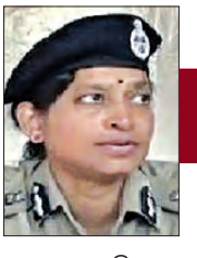
ବି. ରାଧିକାଙ୍କ ସେକ୍ସ୍‌ସ୍‌ରେ ଅବସରକୁ ଅନୁମୋଦନ

ଅନ୍ୟପକ୍ଷରେ ରୁଧିରା ରାଜ୍ୟ ସରକାର ବରିଷ୍ଠ ଆଇପିଏସ୍‌ସ୍‌ସ୍‌ରେ ଏକ ଛୋଟ ଅଦଳବଦଳ କରିଛନ୍ତି। ଗୃହ ବିଭାଗ ପକ୍ଷରୁ ପ୍ରକାଶିତ ବିଜ୍ଞପ୍ତି ବି. ରାଧିକାଙ୍କ ସେକ୍ସ୍‌ସ୍‌ରେ ଅବସରକୁ ଅନୁମୋଦନ ଅନୁସାରେ ୧୯୯୮ ବ୍ୟାଚର ଆଇପିଏସ୍ ଦୟାଲ ଗଙ୍ଗାଧରଙ୍କୁ ପୁଲିସ୍ ଆଧିକାରକର ଶ୍ରେଣୀ ରୂପେ ନିୟୁଜି ଦିଆଯାଇଛି। ଶ୍ରୀ ଗଙ୍ଗାଧର ସମ୍ପ୍ରତି ରେକର୍ଡର ଏବଂ ଉପକୂଳ ସୁରକ୍ଷାର ଏଡିଜି ରୂପେ କାର୍ଯ୍ୟ କରୁଛନ୍ତି। ଅନୁରୂପ ଭାବରେ ୧୯୯୮ ବ୍ୟାଚର ଆଇପିଏସ୍ ତଥା ପୁଲିସ୍ ଆଧିକାରକର ଶ୍ରେଣୀ ଏଡିଜି ରୂପେ କାର୍ଯ୍ୟ କରୁଛନ୍ତି।