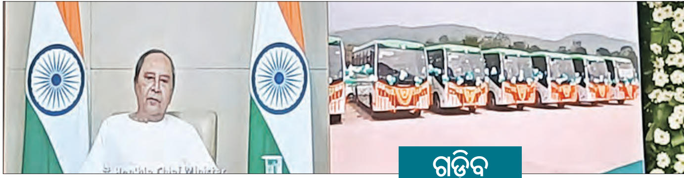
ଅନୁଗୋଳ, ୩୧୧ (ସମିସ)

ଅଜି ପୂର୍ବାହ୍ନରେ ଅନୁଗୋଳ ଉଚ୍ଚ ବିଦ୍ୟାଳୟ ପଡ଼ିଆଠାରେ ଆଭାସି ମାଧ୍ୟମରେ ଓଡ଼ିଶାର ମୁଖ୍ୟମନ୍ତ୍ରୀ ନବୀନ ପଟ୍ଟନାୟକଙ୍କ କରକମଳରେ 'ଲକ୍ଷ୍ମୀ' ବସ୍ ଯୋଜନା ଲୋକାର୍ପିତ ହୋଇଯାଇଛି। ଏହି ଯୋଜନା ଅନୁଗୋଳ ସମେତ ଢେଙ୍କାନାଳ ଓ ଦେବଗଡ଼ ଜିଲ୍ଲାରେ ମଧ୍ୟ ଲୋକାର୍ପିତ ହୋଇଯାଇଛି। ଜିଲ୍ଲାର ଅନୁଗୋଳ, ଛେଣ୍ଡିପଦା, କଣିହାଁ, କିଶୋରନଗର ଓ ଚାକଟେର ବ୍ଲକ୍‌ରେ ୩ଟି ଲେଖାଏଁ ଓ ବର୍ଦ୍ଧମାଳ, ପାଳକହଡ଼ା ଓ ଆଠମଲ୍ଲିକ ବ୍ଲକ୍‌ରେ ୪ଟି ଲେଖାଏଁ ମୋଟ ୨୭ଟି ବସ୍ ଆଜିଠାରୁ ଗ୍ରାମ ପଞ୍ଚାୟତରୁ ବୁକ୍‌କରାଯିବ।