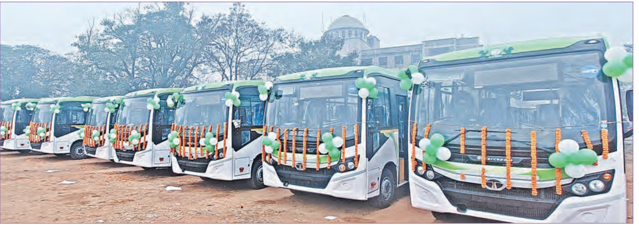
ଢେଙ୍କାନାଳ, ୩୧୧

ଢେଙ୍କାନାଳ ଜିଲ୍ଲାରେ ଆଜିଠାରୁ ଲକ୍ଷ୍ମୀବସ୍ ଚଳାଚଳ କରିଛି। ଓଡ଼ିଶାର ମୁଖ୍ୟମନ୍ତ୍ରୀ ନବୀନ ପଟ୍ଟନାୟକ ଲକ୍ଷ୍ମୀ ବସ୍ ସେବାର ଆନୁଷ୍ଠାନିକ ଭାବରେ ଉଦଘାଟନ କରିଛନ୍ତି। ଏହି ଅବସରରେ ମୁଖ୍ୟମନ୍ତ୍ରୀ ଜିଲ୍ଲାବାସୀଙ୍କୁ ଶୁଭେଚ୍ଛା ପ୍ରଦାନ କରିବା ସହିତ ଶୁଭି ବ୍ୟକ୍ତ କରିଛନ୍ତି। ଏହି ବସ୍‌ସେବା ଦ୍ଵାରା ଗ୍ରାମାଞ୍ଚଳର ଲୋକମାନେ ଦୈନନ୍ଦିନ କାର୍ଯ୍ୟ ପାଇଁ ବୁକ୍ ଚାହା ସହରାଞ୍ଚଳକୁ ଯିବା ଆସିବା ସହଜ ଏବଂ ସୁଲଭ ହେବ ବୋଲି କହିଛନ୍ତି। ସେମାନଙ୍କର ଆର୍ଥିକ ଏବଂ ସାମାଜିକ ଅବସ୍ଥା