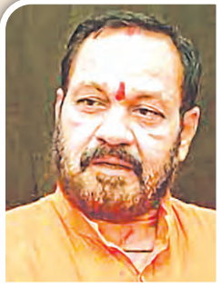
ଫଗୁଣ ପୂର୍ବରୁ ବସନ୍ତ ଉତ୍ଥାନ