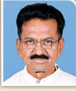
ଆପଣା ହସ୍ତେ ଜିହ୍ଵା ଛେଦି