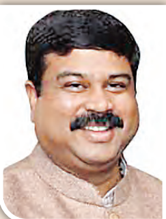
ଚେଇଁ ଶୋଇଥିବ ଯିଏ...