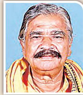
ଗୋଟିଏ ଗୁଳିରେ ଦୁଇ ଶିକାର