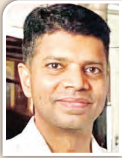
ଅକ୍ଳାନ୍ତ କାର୍ଯ୍ୟ, ଅବିଶ୍ରାନ୍ତ ସେବା

ଜନସେବା ଓ ଲୋକଙ୍କ ପାଇଁ କାର୍ଯ୍ୟ କରିବା ସମୟରେ ଶଙ୍ଖପତି ନବୀନ ଯେପରି କୁଳ୍ତ ଅନୁଭବ କରନ୍ତି ନାହିଁ, ତାଙ୍କର ଯୋଗ୍ୟ ଛାତ୍ର ଭାବରେ ପାଣ୍ଡିଆନ ଶଙ୍ଖପତିଙ୍କ 'ଅକ୍ଳାନ୍ତ' ସେବା ମନ୍ତ୍ରକୁ ଅକ୍ଷରେ ଅକ୍ଷରେ କାର୍ଯ୍ୟରେ ପରିଣତ କରି ଚାଲିଛନ୍ତି । ଶଙ୍ଖପତି ନବୀନଙ୍କ ଓଡ଼ିଶା ରୂପାନ୍ତରଣ ଉଥର ସାରଥୀ ସାଜି ପାଣ୍ଡିଆନ ରାଜ୍ୟସାରା ଆରମ୍ଭ କରିଥିବା ବିକାଶ ଯାତ୍ରାକୁ ସମ୍ଭବତଃ ସେଇଥିପାଇଁ ତାଙ୍କର ପ୍ରଚଣ୍ଡ ବିରୋଧୀମାନେ ବି ପ୍ରଶଂସା କରୁଛନ୍ତି । ଜାନୁଆରୀ ୧୨ ତାରିଖ ସକାଳେ କଳାହାଣ୍ଡିରେ ଛାତ୍ରଛାତ୍ରୀଙ୍କ ସହ ଭାବ ବିନିମୟ, ଲୋକଙ୍କ ଆପତ୍ତି ଅଭିଯୋଗ ଶୁଣାଣି, ବିଭିନ୍ନ ଉନ୍ନୟନ କାମର ହିସାବ ପ୍ରଦାନ; ଅପରାହ୍ଣରେ ସମ୍ବଲପୁର ଜିଲ୍ଲାର ବରେଇପାଲି ଓ ରେଙ୍ଗାଲିରେ ଦୁଇ