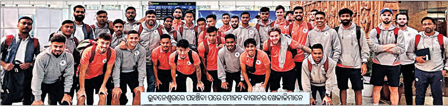
ଭୁବନେଶ୍ୱରରେ ପହଞ୍ଚିବା ପରେ ମୋହନ ବାଗାନର ଖେଳାଳିମାନେ

ଭାରତୀୟ ପୁରୁଷ ଲୀଗ ଅନ୍ୟତମ ସମ୍ମାନଜନକ ପ୍ରତିଯୋଗିତା କଳିଙ୍ଗ ସୁପର କପ୍ ୪ର୍ଥ ଏଫ୍‌ସି ଆଇଏସ୍ଏଲ୍ ୦୩୦ ଯୁଗାୟ କଳିଙ୍ଗ କ୍ଷେତ୍ରରେ ଆରମ୍ଭ ହେବାର ଯାଉଛି । ପୂର୍ବରୁ ସୁପର କପ୍ ନାମରେ ପରିଚିତ ଏହି ପ୍ରତିଯୋଗିତା ଚଳିତ ଏଫ୍‌ସି ଆଇଏସ୍ଏଲ୍ ୦୩୦ ନାମ 'କଳିଙ୍ଗ' ସୁପର କପ୍ ରେ ଖେଳାଯିବ । ଏଥିରେ ଇଣ୍ଡିଆନ୍ ସୁପର ଲିଗ୍ (ଆଇଏସ୍ଏଲ୍) ର ସମସ୍ତ ୧୨ ଗୋଟି ଦଳ ଭାଗନେଇଛି । ସେହିଭଳି ଆଇ-ଲିଗ୍ ୧୬ ଗୋଟି ଶ୍ରେଣୀ ଦଳ ଗୋଟିକି ଗୋଟିକି ଏଫ୍‌ସି, ଶ୍ରୀନିବି ଡେକାନ୍ ଏଫ୍‌ସି, ସିଲ୍‌ଲାଇଫ୍ ଏଫ୍‌ସି ଓ ଇଣ୍ଡିଆନ୍ କାମି ଷ୍ଟେଲିସ୍ । ଏହା ଭାବେ ମୋର୍ ୧୬ଟି ଦଳ ଚଳିତ କଳିଙ୍ଗ ସୁପର କପ୍‌ରେ ଅଂଶଗ୍ରହଣ କରିଛନ୍ତି । କାର୍ତ୍ତୀୟା ୨୮ ରେ ପାଇନାଲ ମୁକାବିଲା ଖେଳାଯିବ ।