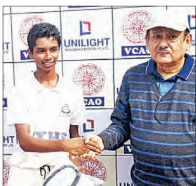
ଭୁବନେଶ୍ୱର ଆନ୍ତଃସ୍କୁଲ କ୍ରିକେଟ୍ ସେଣ୍ଟ୍ରାଲ୍‌ରେ ବିଜୟ, କିସ୍କର ବିଜୟ ।

ଭୁବନେଶ୍ୱର ଆନ୍ତଃସ୍କୁଲ କ୍ରିକେଟ୍ ସେଣ୍ଟ୍ରାଲ୍‌ରେ ବିଜୟ, କିସ୍କର ବିଜୟ । ଭୁବନେଶ୍ୱର ଆନ୍ତଃସ୍କୁଲ କ୍ରିକେଟ୍ ସେଣ୍ଟ୍ରାଲ୍‌ରେ ବିଜୟ, କିସ୍କର ବିଜୟ ।