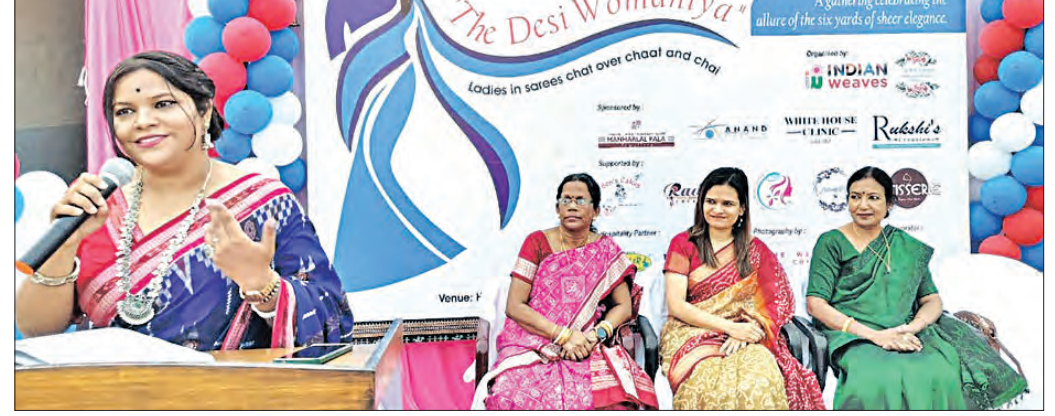
ବାଲେଶ୍ୱର, ୮ (ସମ୍ପାଦକ)

କଳିଙ୍ଗ ସରକାର ଓମେନିଆ ପ୍ରକଳ୍ପରେ ବାଲେଶ୍ୱରରେ 'ଦେଶା ଓମେନିଆ' ନାମରେ ପ୍ରଥମ ଥର ପାଇଁ ଶାଢ଼ୀ ସମ୍ମିଳନୀ ଅନୁଷ୍ଠିତ ହୋଇଯାଇଛି।