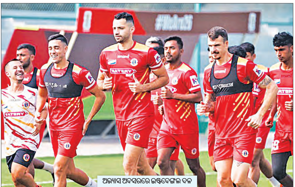
ଅଭ୍ୟାସ ଅବସରରେ ଇଣ୍ଡିଆନ୍ କାମି ଦଳ

ଗ୍ରୁପ୍-ଡି: ଏସ୍‌ଏସ୍‌ଆ, ଓଡ଼ିଶା ଏଫ୍‌ସି, ବେଙ୍ଗାଲୁରୁ ଏଫ୍‌ସି ଓ ଇଣ୍ଡିଆନ୍ କାମି