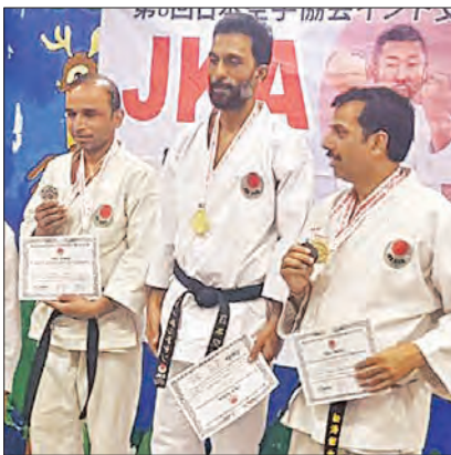
କାର୍ତ୍ତୀୟା କରାଟେ ଚାରିଦଳୀୟ ଉଦ୍‌ଘାଟନା ହେବ ।

ଭୁବନେଶ୍ୱର, ୮ ଫେବୃଆରୀ (ସମିଦ୍ଧ): କାର୍ତ୍ତୀୟା କରାଟେ ଆୟୋଜିତ ହେବ, ଇଣ୍ଡିଆନ୍ ୮ମ କାର୍ତ୍ତୀୟା କରାଟେ ଚାରିଦଳୀୟ ଉଦ୍‌ଘାଟନା ହେବ ।