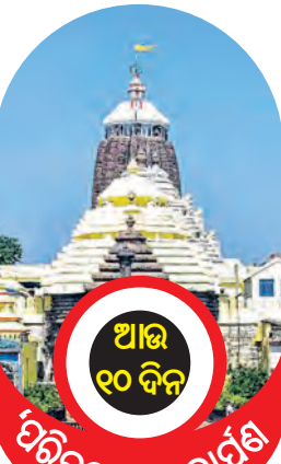
ଆଜି ୧୦ ଦିନ 'ପରିକ୍ରମା' ଲୋକାର୍ପଣ