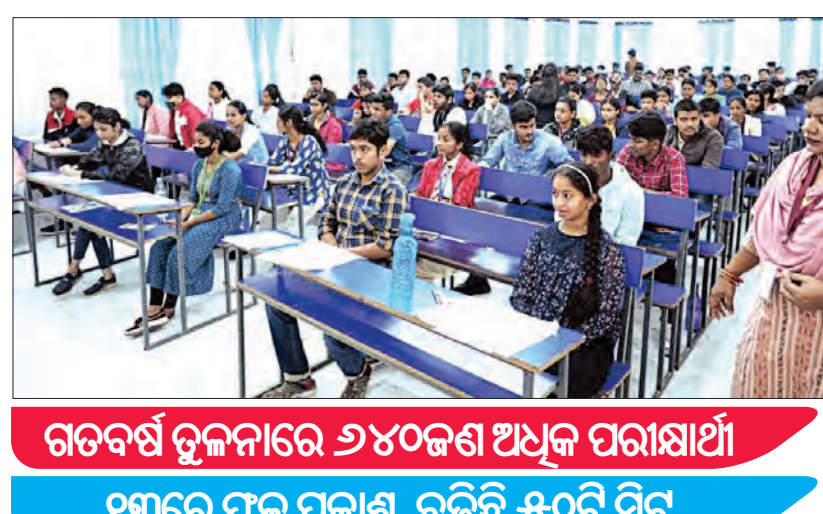
ଗର୍ଭବର୍ଣ୍ଣ ବୁକ୍ ନିମନ୍ତେ ୧୫୪୦ ଜଣ ଅଧିକ ପରୀକ୍ଷାର୍ଥୀ ଏହାରେ ଫଳ ପ୍ରକାଶ, ବଢ଼ିଛି ଖୁସି

ଚଳିତ ପ୍ରବେଶିକା ପରୀକ୍ଷାରେ ଯାଜପୁରରେ ସର୍ବାଧିକ ୧୦୮୦ ଜଣ, ବାଲେଶ୍ୱରରେ ୩୯୦ ଜଣ, ଭୁବନେଶ୍ୱରରେ ୯୦ ଜଣ ଓ ଅନୁଗୋଳରେ ୮୦ ଜଣ ଛାତ୍ରଛାତ୍ରୀ ପରୀକ୍ଷାରେ ଅବତୀର୍ଣ୍ଣ ହୋଇଥିଲେ । ଗୋଟିଏ ଦିନ (ସକାଳ ୧୨:୩୦ରୁ ଅପରାହ୍ଣ ୧:୩୦)ରେ ରିଭାର ଅନୁଷ୍ଠିତ ହୋଇଥିବା ଏହି ପ୍ରବେଶିକା ପରୀକ୍ଷାରେ ୧୫୪୦ ଜଣ ଛାତ୍ରଛାତ୍ରୀ ଅଭିମାନ ଟେଷ୍ଟ