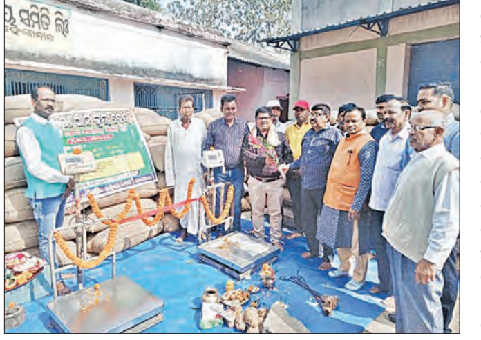
ଗୌଡ଼ିଆ, ୨୧ (ସମ୍ବିଧ)

ଗୌଡ଼ିଆ ବୁକ୍ରେ ଧାନମଣ୍ଡିର ଶୁଭ ଉଦଘାଟନ ହୋଇଛି । ୨ଟି ମଣ୍ଡିରେ ହୋଇଛି ଧାନ କ୍ରୟ । ଗୌଡ଼ିଆ ବୁକ୍ରେ ଆଜି ୨ଟି ମଣ୍ଡିରେ ଚାଷୀମାନେ