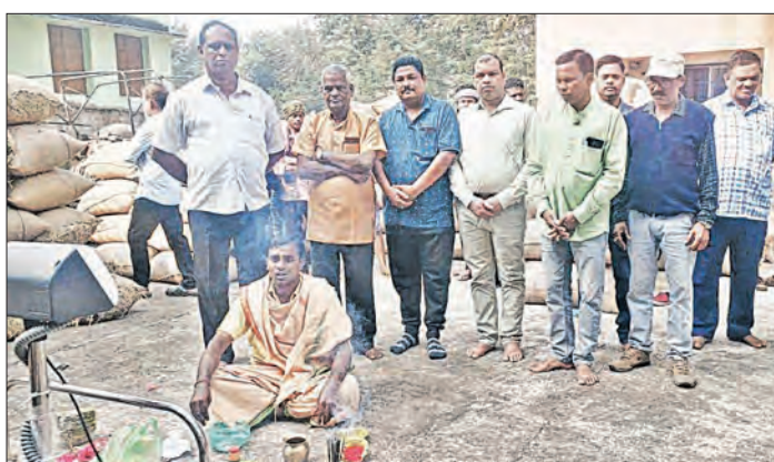
ହିନ୍ଦୋଳ, ୨୧ (ସମ୍ବିଧ)

କେନ୍ଦ୍ରୀୟ ଜିଲ୍ଲା ହିନ୍ଦୋଳ ବୁକ୍ରେ ଚାଷୀଙ୍କ ପାଇଁ ଆରମ୍ଭ ହୋଇଛି ଧାନମଣ୍ଡି । ହିନ୍ଦୋଳ ବୁକ୍ରେ ଏମାର୍ଗେଟି ପ୍ରାଥମିକ କୃଷି ସେବା ସମବାୟ ସମିତି ପକ୍ଷରୁ ଆଜି ପ୍ରଥମକରି ବିଭାଗୀୟ ପ୍ରାଥମିକ