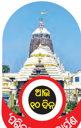
ଆଜି ୧୦ ଦିନ 'ପରିକ୍ରମା' ଲୋକାର୍ପଣ