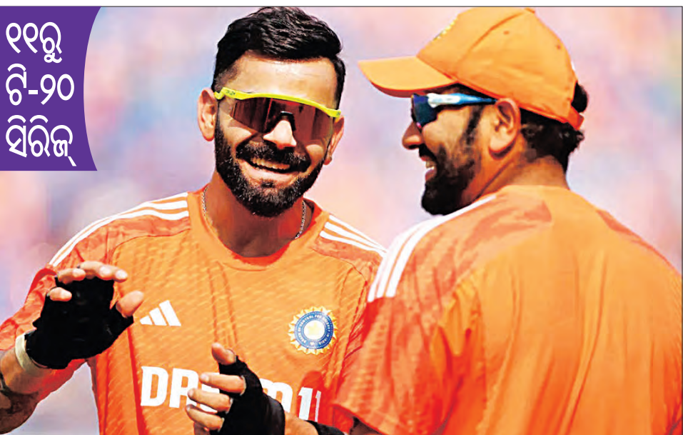
୧୧ରୁ ଟି-୨୦ ସିରିଜ୍

ଆପତନିତ୍ୱାନ୍ ବିପକ୍ଷ ୩ ମ୍ୟାଚ୍ ବିଶିଷ୍ଟ ଟି-୨୦ ସିରିଜ୍ ଆରମ୍ଭ ହେବାକୁ ଆଇ ମାଡ୍ରୁ ୫ ଦିନ ରହିଛି । କିନ୍ତୁ ଏବେ ପୁଣି ଭାରତୀୟ ଦଳ ଚୟନ କରାଯାଇ ପାରି ନାହିଁ । ଏହାର ମୁଖ୍ୟ କାରଣ ହେଲେ ରୋହିତ ଶର୍ମା ଓ ବିରାଟ କୋହଲି । ଏମାନଙ୍କୁ ଦଳରେ ସାମିଲ କରିବା ନେଇ ଦୁହେଁରେ ଚଳିଥିବା ଯୁଦ୍ଧ ଦଳ ଚୟନ କରିବା ସମ୍ଭବ ହୋଇନାହିଁ । ଉଭୟ ବରିଷ୍ଠ ଖେଳାଳି ଗତି ଫର୍ମାଟରେ ଖେଳୁଛନ୍ତି । ଏଣୁ ଟି-୨୦ରେ ଖେଳିବା ନେଇ ସେମାନଙ୍କ ମତାମତ ଜାଣିବା ଲାଗି ଭାରତୀୟ କ୍ରିକେଟ ଦଳର ମୁଖ୍ୟ ଚୟନକର୍ତ୍ତା ଅଜିତ ଅଗରକର ଦକ୍ଷିଣ ଆଫ୍ରିକା ଯାଇଥିଲେ । ଉଭୟ ଭାରତ ପକ୍ଷରୁ ଖେଳିବା ଲାଗି ଇଚ୍ଛା ପ୍ରକାଶ କରିବାରୁ ଏଭଳି ସ୍ଥିତି ସୃଷ୍ଟି ହୋଇଛି । ଚଳିତବର୍ଷ ଆମେରିକା ଏବଂ ଫେସ୍ଟିଭାଲରେ ଟି-୨୦ ବିଶ୍ୱକପ୍ ଖେଳାଯିବ । ଏହି ମେଗା ଇଭେଣ୍ଟ ଲାଗି ଯୁବ ଖେଳାଳିଙ୍କୁ ସୁଯୋଗ ଦିଆଯିବ କିମ୍ବା ବରିଷ୍ଠ ଖେଳାଳିଙ୍କୁ ସାମିଲ କରାଯିବ ତାହାକୁ ନେଇ ଦୁହେଁ ରହିବା ସ୍ୱାଭାବିକ । ଯୁବ ଖେଳାଳିଙ୍କୁ ଗୁରୁତ୍ୱ ଦେଲେ ଉଭୟ ରୋହିତ ଓ ବିରାଟଙ୍କୁ ବାଦ୍ ଦେବା କେବଳ ଚୟନକର୍ତ୍ତାଙ୍କ ପକ୍ଷେ ସମ୍ଭବ ନୁହେଁ । ଏଥିଲାଗି ସର୍ବଶକ୍ତିମାନ ବିସିସିଆଲ