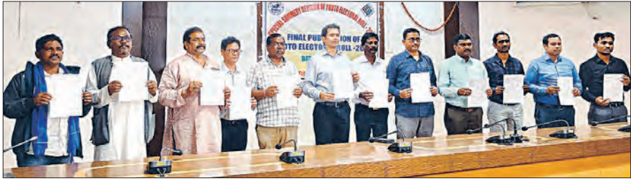
ମାଲକାନଗିରି, ୬/୧ (ସମିପ)