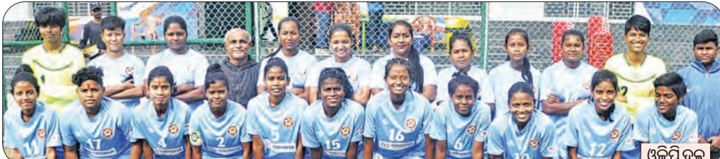
ଓଡ଼ିଶା ମହିଳା ଦଳ

ଭୁବନେଶ୍ୱର, ୨୧ (ସମିପ) ପୁରୁଷ ଏକାଡେମୀ ଆରମ୍ଭ ହୋଇଛି। ଏଥିରେ ପୁରୁଷ ଏକାଡେମୀ ଆଧାରରେ ନୀତା ପୁରୁଷ ଏକାଡେମୀ ଚାମ୍ପିଅନ ଓ ଓଡ଼ିଶା ସରକାରୀ ପ୍ରେସ (ଓଡିପି) ରନର୍ସଅପ୍ ହୋଇଛି। ସେହିଭଳି ଇଣ୍ଡିଆନ ଓମେନ୍ସ ଲିଗ୍ (ଆଇଡିଓଏଲ) ଦ୍ୱିତୀୟ ଡିଭିଜନ ପ୍ରତିଯୋଗିତାକୁ ମଧ୍ୟ ନୀତା ପୁରୁଷ ଏକାଡେମୀ ଯୋଗ୍ୟତା ଅର୍ଜନ କରିଛି। ଓଡ଼ିଶା ନୀତା ପୁରୁଷ ଏକାଡେମୀ ୫-୦ ଗୋଲରେ