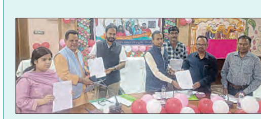
ନବରଙ୍ଗପୁର: ଭୋଟର ତାଲିକା ସୂଚକ ସଂକ୍ଷିପ୍ତ ସଂଶୋଧନ କାର୍ଯ୍ୟକ୍ରମ ୨୦୨୪ ଆରମ୍ଭ ହେବା ସହ ଏହି ସଂଶୋଧନ କାର୍ଯ୍ୟକ୍ରମରେ ଗତ ଅକ୍ଟୋବର ୨୨ରେ ଡ୍ରାପ୍ ତାଲିକା ପ୍ରକାଶ ପାଇଥିଲା ଏବଂ ଏହାର ତୁଡ଼ାନ୍ତ ଭୋଟର ତାଲିକା ଶୁକ୍ରବାର ପ୍ରକାଶ ପାଇଛି।