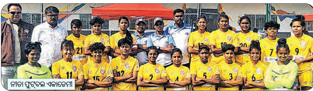
ନୀତା ପୁରୁଷ ଏକାଡେମୀ