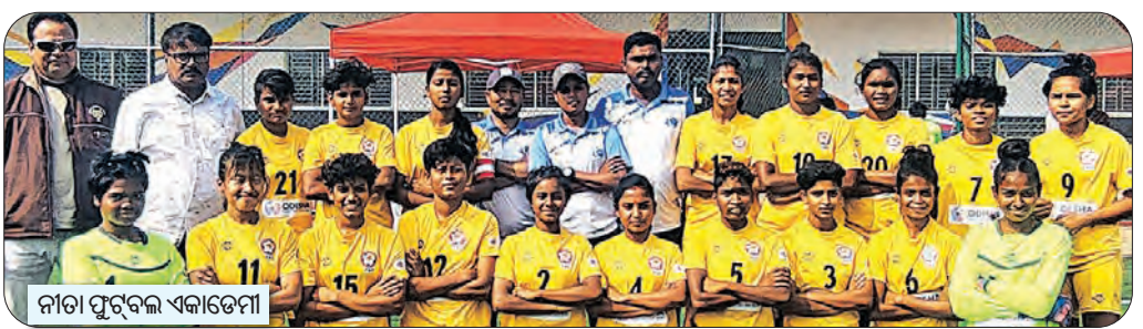
ନୀତା ପୁରୁଷ ଏକାଡେମୀ