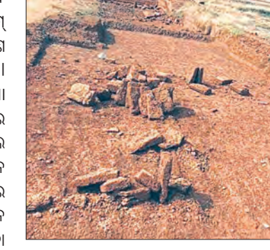
କର୍ମଚାରୀ ସପେକ୍ତ ହେଉଛନ୍ତି। ସେପଟେ ବୈଧ କାର୍ଯ୍ୟକ୍ରମ ଥାଇ ମୋରମ ଚାଲାଣ କରାଯାଉଥିବା କୁହାଯାଉଥିବା ବେଳେ କେବଳ ରାତିଅଧିଆ ମୋରମ ଚାଲାଣ ହେବା ଘଟଣାକୁ ନେଇ ସ୍ଥାନୀୟ ଅଞ୍ଚଳରେ ନାନା ଗୁଣ୍ଡାଣ ସୃଷ୍ଟି କରିଛି।

ଧାରେ ଧାରେ ଅବକ୍ଷୟ ହେବାକୁ ଲାଗିଛି। ମୋରମ ଖାଦାନ ପରିଲୋ ଏଠାରେ ଜଙ୍ଗଲ ମଧ୍ୟରେ ଥିଲେ ମଧ୍ୟ ତାହା ଫରେଷ୍ଟ ଏରିଆରେ ଯାଉନଥିବା ବନ ବିଭାଗର ସୈରାତରୁ ବ୍ୟୋଧନ ଭାବେ ରାତିଅଧିଆ ଟ୍ରିପ୍ ଟ୍ରିପ୍ ମୋରମ ଯାକପୁର ଅଞ୍ଚଳକୁ ଚୋରାଚାଲାଣ ହେଉଥିବା ଅଭିଯୋଗ ହେଉଛି। ଏଥିନେଇ ସ୍ଥାନୀୟ ଦାନ୍ତୁଆ ଗ୍ରାମବାସୀ ପ୍ରଶାସନ ନିକଟରେ ବାରମ୍ବାର ଅଭିଯୋଗ କରିଥିଲେ ମଧ୍ୟ କୌଣସି କାର୍ଯ୍ୟାନୁଷ୍ଠାନ ଗ୍ରହଣ କରାଯାଇନାହିଁ। ପ୍ରଶାସନର ମଧୁଚନ୍ଦ୍ରକାରେ ଏଭଳି ବ୍ୟୋଧନ ଚୋରାଚାଲାଣର ଚାଲିଥିବା ଗ୍ରାମବାସୀ ପାଳଣ ଅଭିଯୋଗ ଆଣିଛନ୍ତି। ହାଲୁକା ଟ୍ରିପ୍ ଯୋଗେ ରାତିଅଧିଆ ଟ୍ରିପ୍ ଟ୍ରିପ୍ ମୋରମ ଏବଂ ମାଙ୍କଡ଼ା ପଥର ଚୋରାଚାଲାଣ ହେବା ଫଳରେ ସ୍ଥାନୀୟ ଅଞ୍ଚଳରେ ବଡ଼ବଡ଼ ଖାଲଖାମା ସୃଷ୍ଟି ହେବା ସହ ପରିଲୋ ଏଠାରେ ଜଙ୍ଗଲ ଅଞ୍ଚଳ