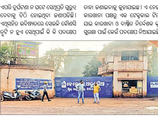
ନିଆଁଯିବ ତାହା ଲିଖିତ ଭାବେ ଜଣାଇବାକୁ କୁହାଯାଇଛି। ଦୁର୍ଘଟଣା କେଉଁ କାରଣ ପାଇଁ ଘଟିଲା ଏବଂ ଏଥିରେ କାହାର ତ୍ରୁଟି ରହିଛି