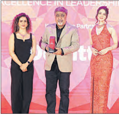
ସିଇଓମାନେ ସାମିଲ ହୋଇଥିଲେ। ଯେଉଁମାନେ ଏହି ଶିଳ୍ପର ଅଭିବୃଦ୍ଧିର ପରିଚାୟକ ଭାବରେ ବିବେଚିତ ହେଉଛନ୍ତି। ଏହାବ୍ୟତୀତ ଭାରତୀୟ ଅର୍ଥନୀତିର

ଭୁବନେଶ୍ୱର, ୬୧ (ଏକେଡ଼ି): ଓଡ଼ିଶାର ପ୍ରତିଷ୍ଠିତ କୁଏଲର୍ସି ଟ୍ରାଷ୍ଟି ଖୁମ୍ପା କୁଏଲର୍ସିକୁ ଭାରତର ପୂର୍ବାଞ୍ଚକ କୁଏଲର୍ସି ଶିଳ୍ପରେ ଉଲ୍ଲେଖନୀୟ କାର୍ଯ୍ୟ ନିମନ୍ତେ ରିଟେଲ୍ କୁଏଲର୍ସି, ଏମ୍ପ୍ରି ଓ ସିଇଓ ଆଝାର୍ଡ-୨୦୨୪ ପକ୍ଷରୁ ସମ୍ମାନଜନକ ରିଟେଲ୍ ଟେନ୍ ଅଫ୍ ଦି ଇୟର (ଇଷ୍ଟ) ସମ୍ମାନରେ ସମ୍ମାନିତ କରାଯାଇଛି।