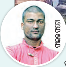
ପାଲିକ ପଟ୍ଟା ବେଳେ ଭଗାମର କାରଟି ଭାରସାମ୍ୟ ଖୁଣ୍ଟରେ ଧକ୍କା ଚାଳକ ଘଟଣାସ୍ଥଳରେ