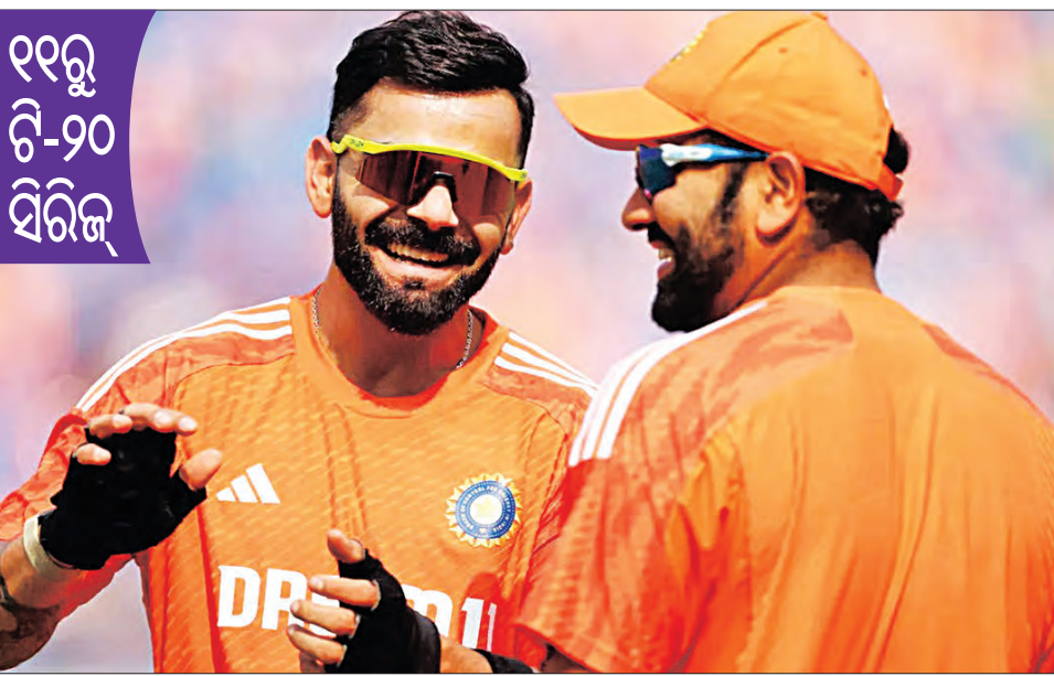
୧୧ରୁ ଟି-୨୦ ସିରିଜ୍

ଆପତନିତ୍ୟାନ୍ ବିପକ୍ଷ ୩ ମ୍ୟାଚ୍ ବିଶିଷ୍ଟ ଟି-୨୦ ସିରିଜ୍ ଆରମ୍ଭ ହେବାକୁ ଆଇ ମାଡ୍ରୁ ୫ ଦିନ ରହିଛି । କିନ୍ତୁ ଏବେ ପୁଣି ଭାରତୀୟ ଦଳ ଚୟନ କରାଯାଇ ପାରି ନାହିଁ । ଏହାର ମୁଖ୍ୟ କାରଣ ହେଲେ ରୋହିତ ଶର୍ମା ଓ ବିରାଟ କୋହଲି । ଏମାନଙ୍କୁ ଦଳରେ ସାମିଲ କରିବା ନେଇ ଦୁହେଁରେ ଚଳିଥିବା ଯୁଦ୍ଧ ଦଳ ଚୟନ କରିବା ସମ୍ଭବ ହୋଇନାହିଁ । ଉଭୟ ବରିଷ୍ଠ ଖେଳାଳି ଗତି ଫର୍ମାଟରେ ଖେଳୁଛନ୍ତି । ଏଣୁ ଟି-୨୦ରେ ଖେଳିବା ନେଇ ସେମାନଙ୍କ ମତାମତ ଜାଣିବା ଲାଗି ଭାରତୀୟ କ୍ରିକେଟ ଦଳର ମୁଖ୍ୟ ଚୟନକର୍ତ୍ତା ଅଜିତ ଅଗରକର ଦକ୍ଷିଣ ଆଫ୍ରିକା ଯାଇଥିଲେ । ଉଭୟ ଭାରତ ପକ୍ଷରୁ ଖେଳିବା ଲାଗି ଲକ୍ଷ୍ୟ ପ୍ରକାଶ କରିବାକୁ ଏଭଳି ସ୍ଥିତି ସୃଷ୍ଟି ହୋଇଛି । ଚଳିତବର୍ଷ ଆମେରିକା ଏବଂ ଫେସ୍ଟିଭାଲରେ ଟି-୨୦ ବିଶ୍ୱକପ୍ ଖେଳାଯିବ । ଏହି ମେଗା ଇଭେଣ୍ଟ ଲାଗି ଯୁବ ଖେଳାଳିଙ୍କୁ ସୁଯୋଗ ଦିଆଯିବ କିମ୍ବା ବରିଷ୍ଠ ଖେଳାଳିଙ୍କୁ ସାମିଲ କରାଯିବ ତାହାକୁ ନେଇ ଦୁହେଁ ରହିବା ସ୍ୱାଭାବିକ । ଯୁବ ଖେଳାଳିଙ୍କୁ ଗୁରୁତ୍ୱ ଦେଲେ ଉଭୟ ରୋହିତ ଓ ବିରାଟଙ୍କୁ ବାଦ୍ ଦେବା କେବଳ ଚୟନକର୍ତ୍ତାଙ୍କ ପକ୍ଷେ ସମ୍ଭବ ନୁହେଁ । ଏଥିଲାଗି ସର୍ବଶକ୍ତିମାନ ବିସିସିଆଲ