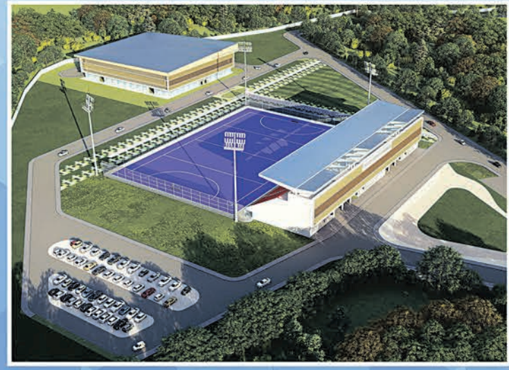
ସ୍ପୋର୍ଟ୍ସ କମ୍ପ୍ଲେକ୍ସ ସମ୍ବଲପୁର ୟୁନିଭରସିଟି