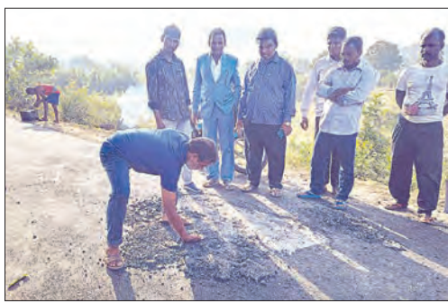
ପକାଇ କାର୍ଯ୍ୟ କରାଯିବ ବୋଲି ମୋହନା ଗ୍ରାମ୍ୟ ନିର୍ମାଣ ବିଭାଗ ଯତ୍ନ ଲୋକଙ୍କୁ କହିବା ପରେ ପରିସ୍ଥିତି ଶାନ୍ତ ପଡ଼ିଥିଲା ।

ମୋହନା, ୫।୧(ସମିପ): ରାସ୍ତାରେ ପିଚୁ ଢଳାଇ କାର୍ଯ୍ୟର ଗୋଟିଏ ଦିନ ପରେ ପିଚୁ ଉଠିଯାଇଛି । ଏକାକି ଚିତ୍ର ଦେଖିବା ପାଇଁ ମିଳିଛି ଗଜପତି ଜିଲ୍ଲାର ମୋହନା-ଖାରିଗୁଡ଼ା ପ୍ରଧାନମନ୍ତ୍ରୀ ଗ୍ରାମ୍ୟ ସହକାରୀ ଯୋଜନା ରାସ୍ତା ମରାମତି କାର୍ଯ୍ୟରେ । ସୂଚନା ପ୍ରକାରେ ମୋହନା ଶ୍ରୀକ୍ଷିତାନ୍ତରାଳୀ ସାହିତ୍ୟ ଶାଳାକୁ ଗ୍ରାମ୍ୟ ସହକାରୀ କରୁଥିବା ୧.୯୦୦କିମି ରାସ୍ତା ମରାମତି କାର୍ଯ୍ୟ ନିମନ୍ତେ ମୋହନା ଗ୍ରାମ୍ୟ ନିର୍ମାଣ ବିଭାଗ ପକ୍ଷରୁ ୧୨ ଲକ୍ଷ ୯୯ ହଜାର ୯୯୯ ଟଙ୍କା ବ୍ୟୟଭରଣ କରାଯିବ । ସହକାରୀ ଯୋଜନା ଗ୍ରାମ୍ୟ ନିର୍ମାଣ ବିଭାଗ ପକ୍ଷରୁ ୧୨ ଲକ୍ଷ ୯୯ ହଜାର ୯୯୯ ଟଙ୍କା ବ୍ୟୟଭରଣ କରାଯିବ । ସହକାରୀ ଯୋଜନା ଗ୍ରାମ୍ୟ ନିର୍ମାଣ ବିଭାଗ ପକ୍ଷରୁ ୧୨ ଲକ୍ଷ ୯୯ ହଜାର ୯୯୯ ଟଙ୍କା ବ୍ୟୟଭରଣ କରାଯିବ ।