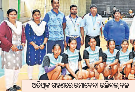
ଅତିଥିଙ୍କ ସହ ଉଦ୍‌ଘାଟନୀ ଭଳିବଲ୍ ଦଳ

ଭୁବନେଶ୍ୱର, ୪୧ (ସମିଧ): କିସ୍ ବିଶ୍ୱବିଦ୍ୟାଳୟ ଆନୁକୁଲ୍ୟରେ ଗୁରୁବାର ପୂର୍ବାଞ୍ଚଳ ଆନ୍ତର୍ବିଶ୍ୱବିଦ୍ୟାଳୟ ମହିଳା ଭଲିବଲ୍ ପ୍ରତିଯୋଗିତା ଉଦ୍‌ଘାଟିତ ହୋଇଯାଇଛି। ଭାରତୀୟ ବିଶ୍ୱବିଦ୍ୟାଳୟ ଫାଏଁ (ଏଆଇୟୁ) ଆନୁକୁଲ୍ୟରେ