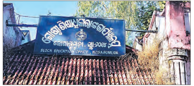
କୋଷାଗୁମୁଡ଼ା, ୪୧ (ସମିପ)

ଦୁଆ ବର୍ଷ ଆରମ୍ଭରୁ କାର୍ଯ୍ୟରେ ଅବହେଳା ପ୍ରଦର୍ଶନ କରୁଥିବା ଶିକ୍ଷକଶିକ୍ଷୟିତ୍ରୀ ଓ ସିଆରସିସିକ ବାଜିଛି କୋଷାଗୁମୁଡ଼ା ଗୋଷ୍ଠୀ ଶିକ୍ଷା ଅଧିକାରୀ(ବିଲଓକ) ଛାଟ। ଏକମାସ ଛୁଟି ପରେ ମଧ୍ୟ କାର୍ଯ୍ୟରେ ଯୋଗଦେଇ ନ ଥିବା କୋଷାଗୁମୁଡ଼ା ବ୍ଲକ୍ରେ କାର୍ଯ୍ୟରେ ଗଣା ଜଣ ପ୍ରାଥମିକ ଓ ଉଚ୍ଚ ବିଦ୍ୟାଳୟ ଶିକ୍ଷକ ଓ ସିଆରସିସିକ ଦରମାକୁ ବିଲଓ ବନ୍ଦ କରିଛନ୍ତି। ସୂଚନାପ୍ରକାରେ, ଡିସେମ୍ବର ଏକମାସ ଛୁଟି କାନ୍ଦୁଆରୀ ୧ରେ ଶେଷ ହୋଇଥିବାବେଳେ କାନ୍ଦୁଆରୀ ୨ରେ ବିଦ୍ୟାଳୟ ଖୋଲିଛି। କିନ୍ତୁ ଗା ତାରିଖ ପୁଣ୍ୟ ବିଦ୍ୟାଳୟରେ ବହୁ ଶିକ୍ଷକଶିକ୍ଷୟିତ୍ରୀ ଓ ଉଚ୍ଚ ବିଦ୍ୟାଳୟ କାର୍ଯ୍ୟରେ ଯୋଗଦେଇ ନ ଥିଲେ। ଏପରିକି ସେମାନେ କାର୍ଯ୍ୟାଳୟରେ ଛୁଟି ଦରମା ମଧ୍ୟ ପ୍ରଦାନ କରିନଥିଲେ। ଫଳରେ କାର୍ଯ୍ୟରେ ଅବହେଳା କରିଥିବା ଦର୍ଶାଇ ଅନୁପସ୍ଥିତ ରହିଥିବା ଗଣା ଜଣ ପ୍ରାଥମିକ, ଉଚ୍ଚ ବିଦ୍ୟାଳୟର ଶିକ୍ଷକଶିକ୍ଷୟିତ୍ରୀ ଓ ସିଆରସିସିକ ଦରମାକୁ କୋଷାଗୁମୁଡ଼ା ଗୋଷ୍ଠୀ ଶିକ୍ଷା ଅଧିକାରୀ ଦର୍ଶାଏ ବନ୍ଦ କରିବା ସହ ଜିଲ୍ଲା ଶିକ୍ଷା ଅଧିକାରୀଙ୍କ ପାଖକୁ ଚିଠି କରିଥିବା ସୂଚନା ମିଳିଛି। ସୂଚନାପ୍ରକାରେ, କୋଷାଗୁମୁଡ଼ା ବ୍ଲକ୍ରେ