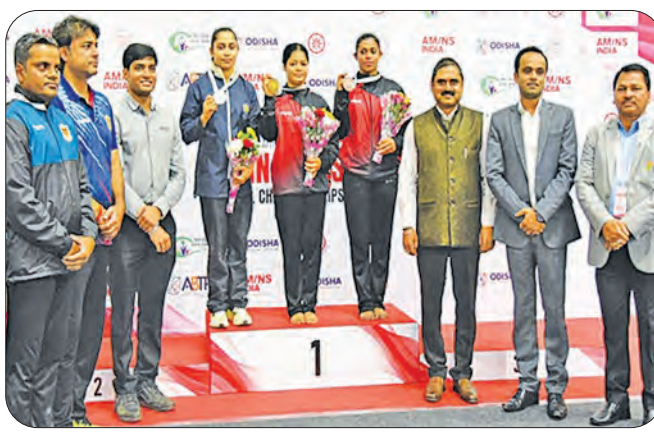
କଳିଙ୍ଗ ଷ୍ଟାଡିୟମରେ ଅନୁଷ୍ଠିତ ସିନିୟର ଆର୍ଟିଷ୍ଟିକ୍ କିମ୍ପାଷ୍ଟିକ୍ ଚାମ୍ପିଅନସିପର ଉତ୍ତର ପୁରୁଷ ଓ ମହିଳା ବିଭାଗରେ ରେକର୍ଡ଼ ବାଜାଇବା ପାଇଁ ଚାମ୍ପିଅନ ଆଖ୍ୟା ଅର୍ଜନ କରିଛି। ଅତିଥିଙ୍କୁ ସହ ପଦକ ବିତରଣ ମହିଳା କିମ୍ପାଷ୍ଟିକ୍।

ଭୁବନେଶ୍ୱର, ୪୧ (ସମିପ): ସର୍ବଭାରତୀୟ ବିଶ୍ୱବିଦ୍ୟାଳୟ ଫାଏଁ (ଏଆଇୟୁ) ଆନୁକୂଲ୍ୟରେ ରାଜସ୍ଥାନ ଜୟପୁରଠାରେ ଚାଲିଥିବା ସର୍ବଭାରତୀୟ ଆନ୍ତର୍ବିଶ୍ୱବିଦ୍ୟାଳୟ ଆନ୍ତର୍ଜାତୀୟ ପୁରୁଷ ଟେନିସ୍ ପ୍ରତିଯୋଗିତାରେ କିଟ୍ ଦଳ ସେମିଫାଇନାଲରେ ପ୍ରବେଶ କରିଛି। ଗୁରୁବାର କିଟ୍ ଓ ଆକ୍ସ ପ୍ରଦେଶ ମଧ୍ୟରେ କାର୍ତ୍ତବୀ ପାଇନାଲ ମ୍ୟାଚ୍ ଖେଳାଯାଇଥିଲା।