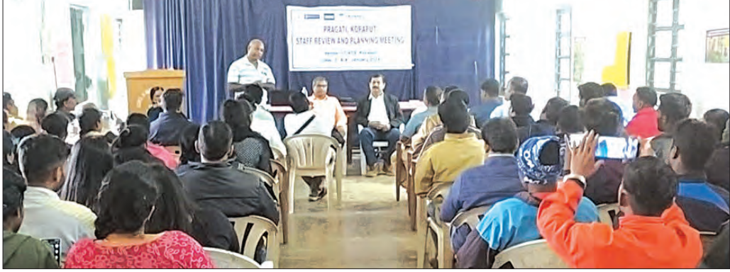
କୋରାପୁଟ, ୪୧ (ସମିପ)

କୋରାପୁଟ କପି, ଝାଡୁ, ସାବୁନ ଓ ହଳଦୀ ପରେ ବିରଳ ଧାନ କୋରାପୁଟିଆ କଳାଜିରା ଧାନକୁ ଜିଆଇ ଟ୍ୟାଗ୍ ପ୍ରଦାନ କରାଯାଇଛି।