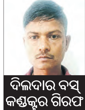
ଦିଲ୍ଲୀଦାର ବସ୍ କଣ୍ଠକୂର ଗିରଫ

ବାସିନ୍ଦାଙ୍କ ସମେତ ବିଭିନ୍ନ ମହଲ ସାଗତ ହୋଇଛନ୍ତି । ହେଲେ ଦାବି ୧୦ ବର୍ଷରୁ ଉର୍ଦ୍ଧ୍ୱ ସମୟ ସମୟରେ ମାତ୍ର ଦେଖିବା ମିଳେ ରାସ୍ତା ଅଧିକ୍ରମ କରିବା ପାଇଁ ୧୫ରୁ ୨୦ ମିନିଟ୍ ସମୟ ଲାଗୁଛି । ସେହିଭଳି ରାସ୍ତା ଉପରେ ଅବାଧ ଅଟେ । ପାର୍କିଂ ଯୋଗୁଁ ରାସ୍ତା ଆହୁରି ସଂକୀର୍ଣ୍ଣ ହୋଇଯାଉଛି । ଦିନବେଳା ତଥା ସନ୍ଧ୍ୟାରୁ ଭିଡ଼ ଏହା ସହିତ ରାସ୍ତା ପାରି ହେବାବେଳେ ପଥଚାରୀ ଭୟଙ୍କର ଟ୍ରାଫିକ୍ ଜାମ୍ରେ ସମ୍ମୁଖି ହେଉଛନ୍ତି । ଏହାକୁ ସ୍ଥାନୀୟ