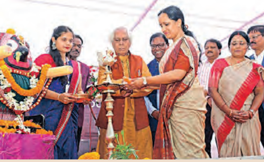
ବର୍ଷକ ମଧ୍ୟରେ ନିର୍ମାଣ ହେବ ପ୍ରେକ୍ଷାଳୟ ଆଗାମୀ ପଢ଼ିକ୍ରମ ମାର୍ଚ୍ଚ ଦେଖାଇବ ଗବେଷଣା

■ ଭୁବନେଶ୍ୱର, ୪୧ (ସମ୍ବିଧ): ଉତ୍କଳ ସଂସ୍କୃତି ବିଶ୍ୱବିଦ୍ୟାଳୟକୁ ବିଶ୍ୱସ୍ତରୀୟ ଉତ୍କର୍ଷ କେନ୍ଦ୍ରରେ ପରିଣତ କରାଯିବ । ଏଥିପାଇଁ ସରକାରଙ୍କ ପକ୍ଷରୁ ସହଯୋଗ ଯୋଗାଇଦେବାକୁ ମୁଖ୍ୟମନ୍ତ୍ରୀ ନବୀନ ପଟ୍ଟନାୟକଙ୍କ ନିର୍ଦ୍ଦେଶ ରହିଛି । ୧୯୯୯ ମସିହାରେ ମୁଖ୍ୟମନ୍ତ୍ରୀ ଏହାର ଶିଳାନିଧାସ କରିଥିଲେ । ଏହା ତାଙ୍କର ସ୍ୱପ୍ନ ପ୍ରକଳ୍ପ । ବିଶ୍ୱବିଦ୍ୟାଳୟର କାର୍ଯ୍ୟକଳ୍ପ ପରିବର୍ତ୍ତନ କରିବା ପାଇଁ ଆସନ୍ତା ଶନିବାର ବୈଠକ ବସିବ । ବୈଠକରେ ବିଶ୍ୱବିଦ୍ୟାଳୟର ଭିତ୍ତିଭୂମି ଓ ଶୈକ୍ଷିକ ବାତାବରଣ ବୃଦ୍ଧି ସମ୍ପର୍କରେ ଆଲୋଚନା କରାଯିବ । ବିଶ୍ୱବିଦ୍ୟାଳୟର ରୌପ୍ୟ । ► ପୃଷ୍ଠା-୧୪