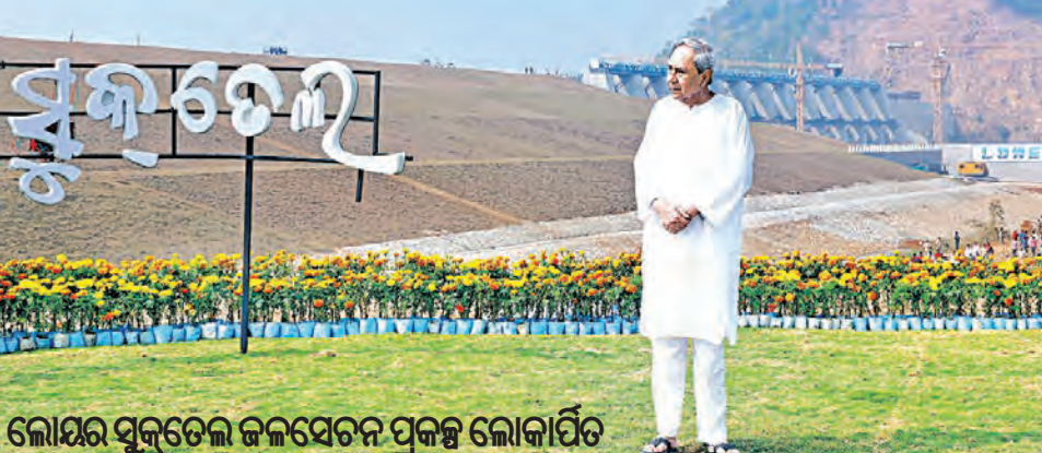
ଲୋକ୍ଷର ସୁକ୍ତେଲ ଜଳସେଚନ ପ୍ରକଳ୍ପ ଲୋକାର୍ପିତ

କୃଷକ ରାଜ୍ୟ ଅର୍ଥନୀତିର ସାରଥୀ। ତାହା ଭାଇମାନଙ୍କୁ ସାଥରେ ଧରି ଆମେ ଆଗକୁ ବଢ଼ୁଛୁ। ମୁଁ ସବୁବେଳେ ତାହା ଭାଇମାନଙ୍କ ସାଥରେ ଅଛି। ସେମାନଙ୍କ ପାଇଁ କାଳିଆ, ଏକ ଲକ୍ଷ ଟଙ୍କାର ବିନା ସୁଧରେ ଭଣ୍ଡା, ମାଗଣା ଫସଲ ବାମା, ତାହା ଘର ପିଲାଙ୍କ ପାଇଁ ମୋଧାବୁଦ୍ଧି ଏବଂ ଆହୁରି ଅନେକ ଯୋଜନା ଜାରି ରହିଛି।