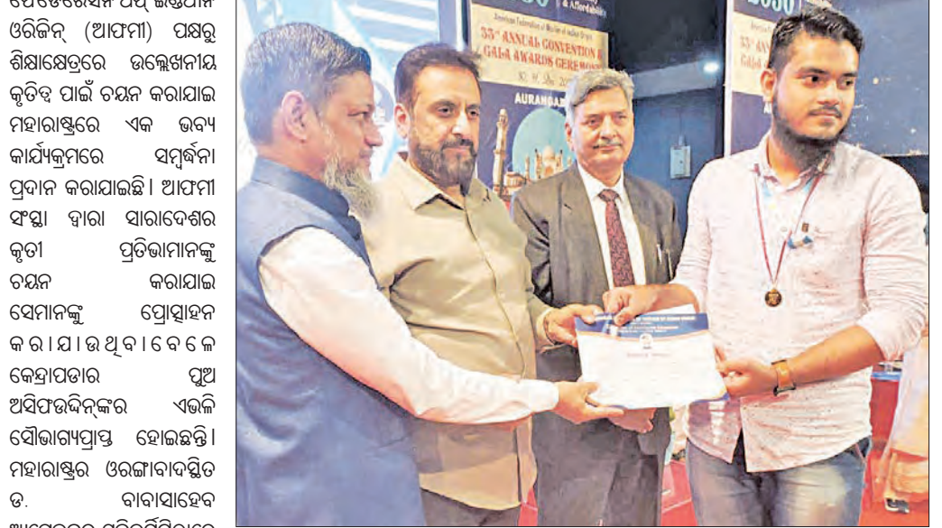
କେନ୍ଦ୍ରାପଡ଼ା ଛାତ୍ର ଆସିପିଉଭିନ୍ ସମ୍ବର୍ଦ୍ଧିତ ହୋଇଥିଲା। କେନ୍ଦ୍ରାପଡ଼ା ଛାତ୍ର ଆସିପିଉଭିନ୍ ସମ୍ବର୍ଦ୍ଧିତ ହୋଇଥିଲା।

କେନ୍ଦ୍ରାପଡ଼ା, ୩୧ (ସମ୍ପାଦକ): କେନ୍ଦ୍ରାପଡ଼ା ଛାତ୍ର ଆସିପିଉଭିନ୍ ସମ୍ବର୍ଦ୍ଧିତ ହୋଇଥିଲା। କେନ୍ଦ୍ରାପଡ଼ା ଛାତ୍ର ଆସିପିଉଭିନ୍ ସମ୍ବର୍ଦ୍ଧିତ ହୋଇଥିଲା।