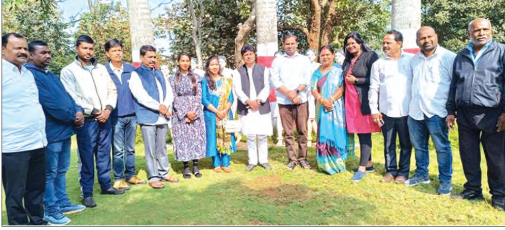
କୋରାପୁଟ, ୩୧ (ସମ୍ପାଦକ)