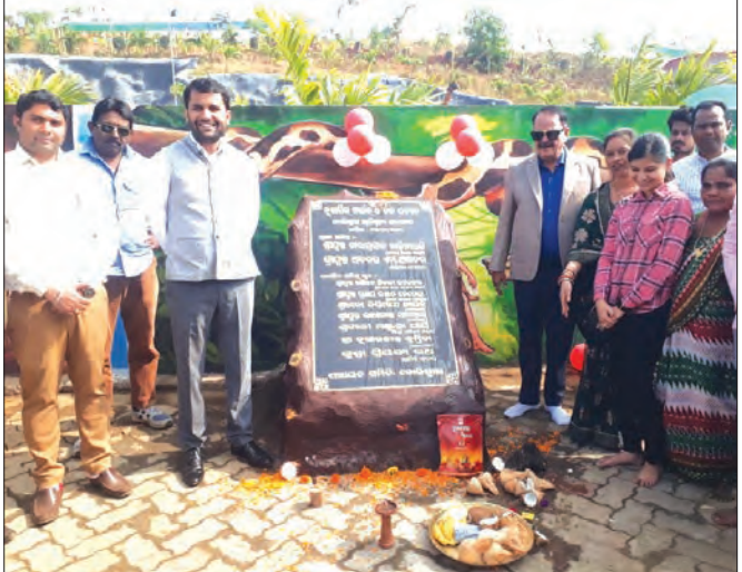
ବୋରିଗୁମ୍ଫା, ୩୧ (ସମ୍ପାଦକ)