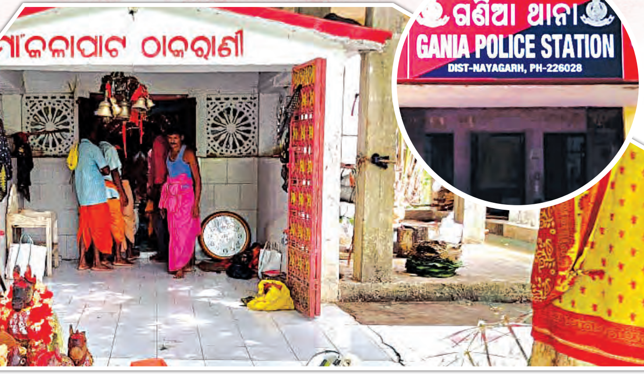
ଗଣିଆ ଥାନା GANIA POLICE STATION DIST-MAYAGARH, PH-226028