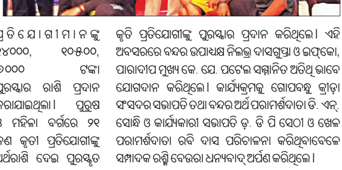
ପ୍ରତିଯୋଗୀମାନଙ୍କୁ ପୁରୁଷ ବର୍ଗରେ ଅଶୋକ, ମହିଳା ବର୍ଗରେ ସୁସ୍ମିତା ପ୍ରଥମ ସ୍ଥାନ ଅଧିକାର କରିଥିବା ବେଳେ...