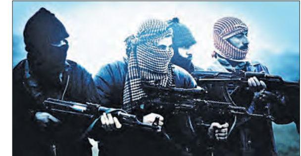
ଭାରତୀୟ ନ୍ୟାୟ ଫଣ୍ଡରେ ଆଡ଼କବାଦକୁ ଦଣ୍ଡନୀୟ ଅପରାଧ ବନାଇ ଦିଆଯାଇଛି । ଧାରା ୧୧୩ (୧)ରେ ଭାରତର ଏକତା, ଅଖଣ୍ଡତା, ସାର୍ବଭୌମତ୍ୱ, ସୁରକ୍ଷା ଏବଂ ଆର୍ଥିକ ସୁରକ୍ଷା କିମ୍ବା ପୁରୁତ୍ୱ ସଙ୍କଟରେ ପକାଇବା କିମ୍ବା ଆଡ଼କବାଦର ପ୍ରଚାରପ୍ରସାର ପାଇଁ ବୋମା, ଡିନାମାଇଟ୍, ବିସ୍ଫୋରକ ପଦାର୍ଥ, ବିସ୍ଫାଜ୍ଞା ବ୍ୟାସ, ଆଣବିକ ପରୀକ୍ଷା କଲେ କିମ୍ବା ଏଥିରେ କାହାର ମୃତ୍ୟୁ କିମ୍ବା ସମ୍ପତ୍ତି କ୍ଷତି ହେଲେ ଏଭଳି କାର୍ଯ୍ୟରେ ଲିପ୍ତ ଥିବା ବ୍ୟକ୍ତି କିମ୍ବା ଏହାଠିକକୁ ଆଡ଼କବାଦୀ ଧରାଯିବ । ସାର୍ବଜନୀନ ସୁବିଧା ଏବଂ ବ୍ୟକ୍ତିଗତ ସମ୍ପତ୍ତି ନଷ୍ଟ କରିବା ମଧ୍ୟ ଅପରାଧ ଚାଲିକାନ୍ତୁ କରାଯାଇଛି । ସେହିପରି ଫଣ୍ଡଠି ଅପରାଧ ପାଇଁ ଧାରା ୧୧୧ (୧) ସାମିଲ କରାଯାଇଛି । ଏଭଳି କାର୍ଯ୍ୟରେ ଲିପ୍ତ ଥିଲେ ୬ ବର୍ଷରୁ ଆକାବନ କାରାଦଣ୍ଡର ବ୍ୟବସ୍ଥା ରହିଛି ।