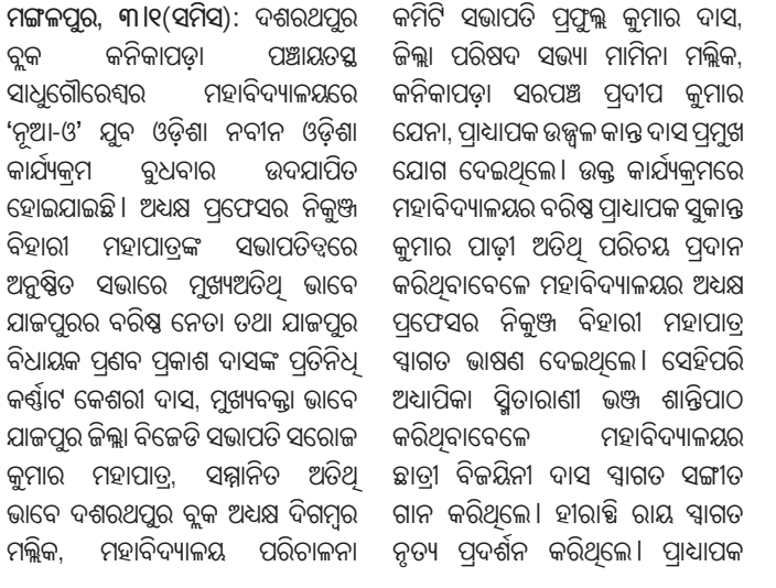
କେନ୍ଦ୍ରାପଡ଼ା ଛାତ୍ର ଆସିପଢ଼ିବନ୍ ସମ୍ବନ୍ଧିତ ପ୍ରକଳ୍ପର ଅନୁଷ୍ଠାନରେ କେନ୍ଦ୍ରାପଡ଼ା ଛାତ୍ର ଆସିପଢ଼ିବନ୍ ସମ୍ବନ୍ଧିତ ପ୍ରକଳ୍ପର ଅନୁଷ୍ଠାନରେ...