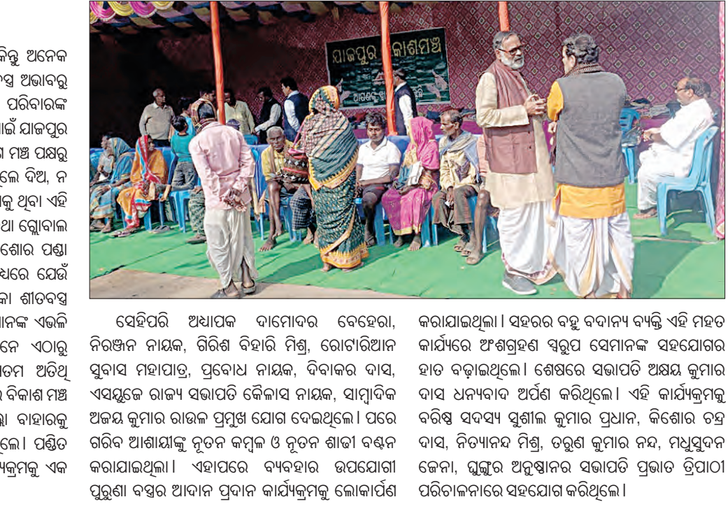
କେନ୍ଦ୍ରାପଡ଼ା ଛାତ୍ର ଆସିପଢ଼ିବନ୍ ସମ୍ବନ୍ଧିତ ପ୍ରକଳ୍ପର ଅନୁଷ୍ଠାନରେ କେନ୍ଦ୍ରାପଡ଼ା ଛାତ୍ର ଆସିପଢ଼ିବନ୍ ସମ୍ବନ୍ଧିତ ପ୍ରକଳ୍ପର ଅନୁଷ୍ଠାନରେ...