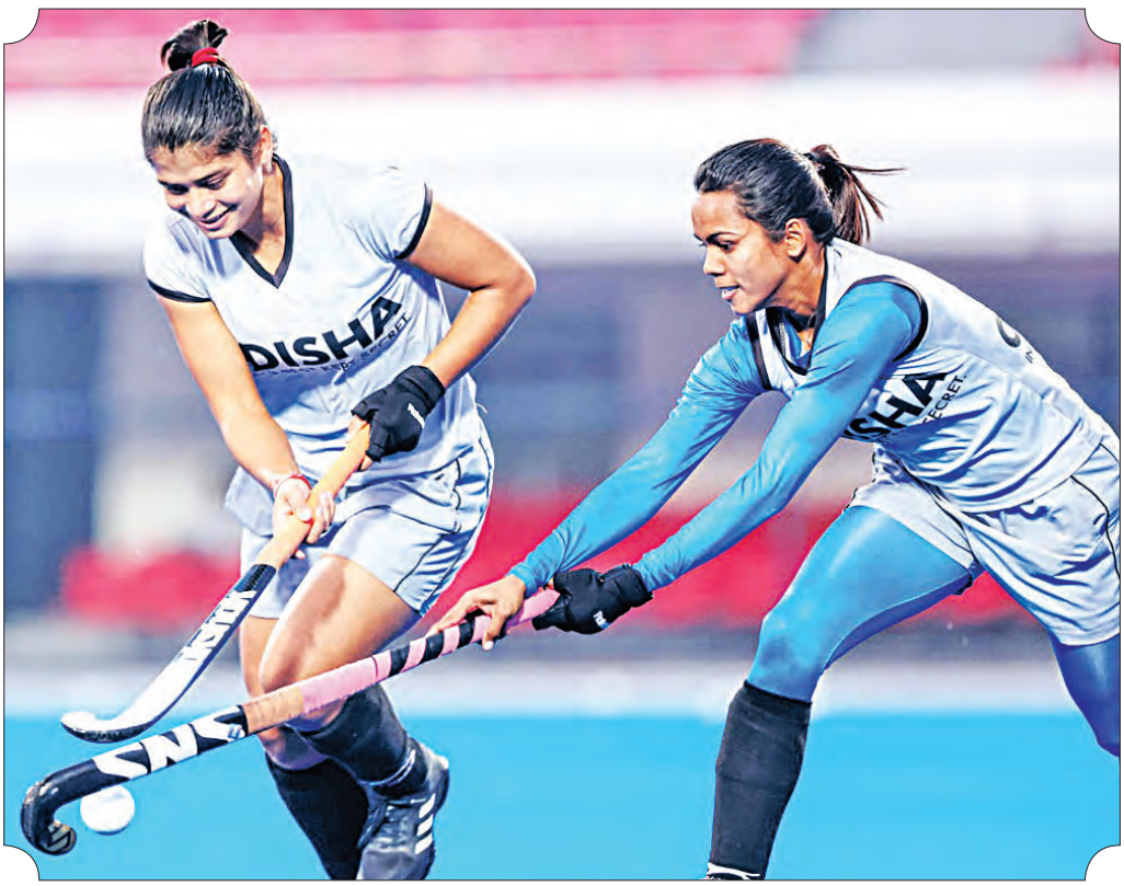
ପେଦୁଆରୀ ୩୩ରୁ ଆରମ୍ଭ ହେବାକୁ ଥିବା ଏସିଆଲ ଏବଂ ପ୍ରୋ ଲିଗ୍ ମ୍ୟାଚ୍ ଲାଗି କଳିଙ୍ଗ ସ୍ମାରକମଣ୍ଡପରେ ଭାରତୀୟ ମହିଳା ହକି ଦଳର ପ୍ରସ୍ତୁତି।