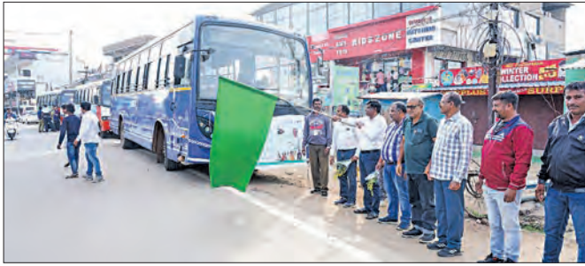
ଭବାନୀପାଟଣା, ୨୮ ୧୨ (ସମିପ) :