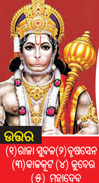
ଉତ୍ତର (୧) ରାଜା ସୁବଳ (୨) ବୃଷସେନ (୩) କାଳକୂଟ (୪) କୃବେର (୫) ମହାଦେବ