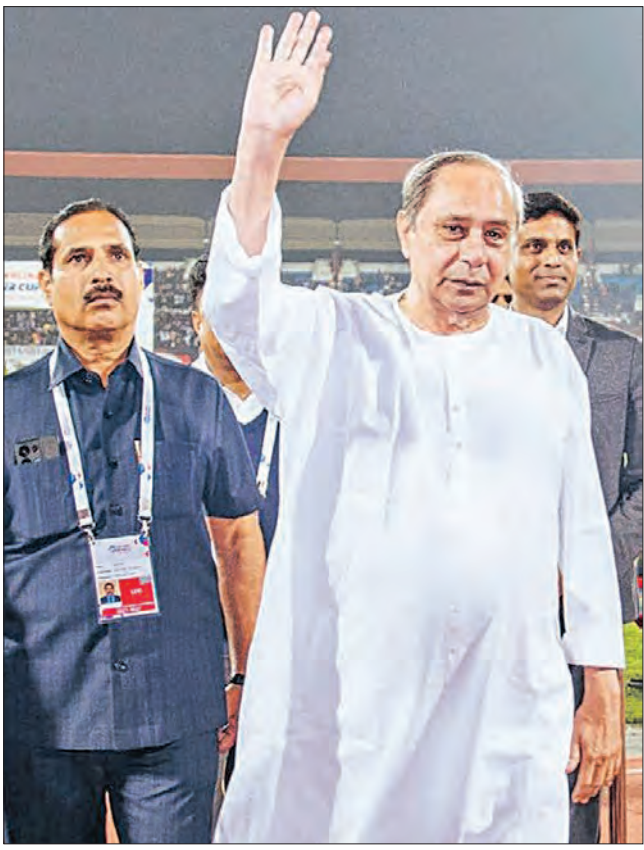
ରବିବାର କଳିଙ୍ଗ ଷ୍ଟାଡ଼ିୟମରେ ଓଡ଼ିଶା ଏପ୍ସି ଓ ଇଷ୍ଟ ବେଙ୍ଗଲ ମଧ୍ୟରେ ଖେଳାଯାଇଥିବା କଳିଙ୍ଗ ସୁପର କପ୍ ଫାଇନାଲ ଅବସରରେ ପୁଣ୍ୟମନ୍ତ୍ରୀ ନବୀନ ପଟ୍ଟନାୟକ ।

ଭୁବନେଶ୍ୱର, ୨୮।୧ (ସମ୍ପାଦକ): ସ୍ଥାନୀୟ କଳିଙ୍ଗ ଷ୍ଟାଡ଼ିୟମରେ ୩ ସପ୍ତାହ ଧରି ଚାଲିଥିବା କଳିଙ୍ଗ ସୁପର କପ୍ରେ ଇଷ୍ଟ ବେଙ୍ଗଲ ଚାମ୍ପିୟନ ହୋଇଛି । କଡ଼ା ଫିଲ୍ଡିଂ ପାଇଁ ପାଇନାଲରେ ଇଷ୍ଟ ବେଙ୍ଗଲ ଏପ୍ସି ୩-୨ ଗୋଲରେ ଡିଫେଣ୍ଡିଂ ଚାମ୍ପିୟନ ଓଡ଼ିଶା ଏପ୍ସିକୁ ପରାସ୍ତ ଟାଇଟଲ୍ ଜିତିବାରେ ସଫଳ ହୋଇଛି । ଫଳରେ କୁମାରୀ ୨୫ର ଚାମ୍ପିୟନ ହେବା ଲକ୍ଷ୍ୟରେ ରହିଥିବା ଓଡ଼ିଶା ଏପ୍ସିର ସ୍ୱପ୍ନ ଭଙ୍ଗ ହୋଇଛି ।