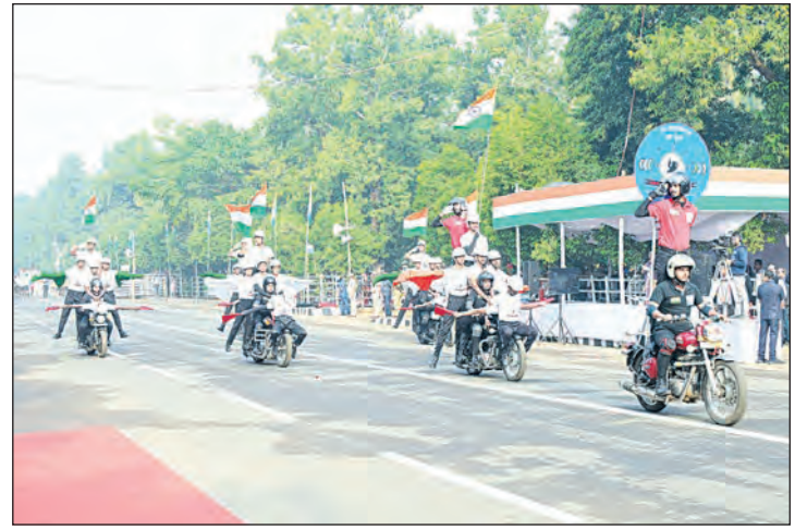
ଶୁକ୍ରବାର ରାଜ୍ୟମାର୍ଗରେ ଅନୁଷ୍ଠିତ ରାଜ୍ୟସ୍ତରୀୟ ସାଧାରଣତନ୍ତ୍ର ଦିବସର ଝଲକ