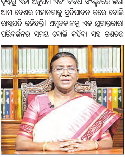
ସାଧାରଣତନ୍ତ୍ର ଦିବସରେ ବାର୍ତ୍ତା

ଅଯୋଧ୍ୟାରେ ଭଗବାନ ଶ୍ରୀରାମଙ୍କ ଜନ୍ମସ୍ଥାନରେ ନିର୍ମିତ ଭବ୍ୟ ମନ୍ଦିରରେ ସ୍ଥାପିତ ମୂର୍ତ୍ତିର ଐତିହାସିକ ପ୍ରାଣ ପ୍ରତିଷ୍ଠା ସମାପ୍ତ ହୋଇଛି । ନ୍ୟାୟିକ ପ୍ରକ୍ରିୟାରେ ଏହା ସମ୍ଭବ ହୋଇପାରିଛି । ଏହା ପଛରେ ନ୍ୟାୟିକ ପ୍ରକ୍ରିୟା ଉପରେ ଆମର ବିଶ୍ୱାସ ପ୍ରମାଣିତ ହୋଇଛି । ସେ କହିଛନ୍ତି ଯେ 'ନାରୀ ଶକ୍ତି ବଦଳ ଆଇନ' ମହିଳା ସଶକ୍ତୀକରଣର ଏକ ବୈପ୍ଳବିକ ମାଧ୍ୟମ ସାବ୍ୟସ୍ତ ହେବ । ଅକ୍ଷୟ ଶକ୍ତି ଉତ୍ସବ ପ୍ରୋତ୍ସାହିତ କରିବା ଏବଂ ବିଶ୍ୱ ଜଳବାୟୁ କାର୍ଯ୍ୟକୁ ନେତୃତ୍ୱ ପ୍ରଦାନ କରିବା ଦିଗରେ ଭାରତ ଅଗ୍ରଣୀ ଭୂମିକା ଗ୍ରହଣ କରୁଥିବାରୁ ସେ ଅତ୍ୟନ୍ତ ଆନନ୍ଦିତ ବୋଲି ରାଷ୍ଟ୍ରପତି କହିଛନ୍ତି ।