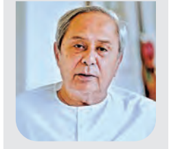
ସମସ୍ତଙ୍କ ପାଇଁ ସୁଯୋଗ ଆଣିଛି ଆମର ବିକାଶ ମତେଲ ବାରିଦ୍ୟୁ ସ୍ୱାସରେ ଓଡ଼ିଶା ପ୍ରମୁଖ ପ୍ରଦର୍ଶନକାରୀ ରାଜ୍ୟ ଶିଳ୍ପ, ପ୍ରଯୁକ୍ତି ବିଦ୍ୟା, ଷ୍ଟାର୍ଟ ଅପ୍ ସବୁଥିରେ ଓଡ଼ିଶା ଆଗରେ ମା' ମାନେ କେବଳ ପରିବାର ନୁହେଁ, ଆମ ସମାଜର ଶକ୍ତି ମହାପ୍ରଭୁ ଜଗନ୍ନାଥ ଓଡ଼ିଆ ଜାତିର ଶ୍ରେଷ୍ଠ ପରିଚୟ

ଭୁବନେଶ୍ୱର, ୨୫ (ସମ୍ପାଦକ): ଆଜି ବିଶ୍ୱ ଦରବାରରେ ଭାରତର ପ୍ରତିଷ୍ଠା ବୃଦ୍ଧି ପାଇଛି । ଦେଶର ବିକାଶରେ ସବୁ ରାଜ୍ୟର ଅବଦାନ ରହିଛି ଓ ଏଥିରେ ଓଡ଼ିଶାର ମଧ୍ୟ ଗୁରୁତ୍ୱପୂର୍ଣ୍ଣ ଭୂମିକା ରହିଛି । ଗତ କୋଡ଼ିଏ ବର୍ଷ ମଧ୍ୟରେ ବିକାଶର ସବୁ କ୍ଷେତ୍ରରେ ଓଡ଼ିଶା ନୂଆ ଇତିହାସ ସୃଷ୍ଟି କରିଛି, ରୂପାନ୍ତର ପଥରେ ଆଗେଇ ଚାଲିଛି । ଓଡ଼ିଶାର ବିକାଶ ଅନ୍ୟମାନଙ୍କ ଆଦର୍ଶ ହୋଇଛି । ଆମର ବିକାଶ ମତେଲ ସମସ୍ତଙ୍କ ପାଇଁ ସୁଯୋଗ ଆଣିଛି । ସମସ୍ତେ ବିକାଶର ସହଯୋଗୀ ହୋଇଛନ୍ତି । ସମସ୍ତଙ୍କ ସହଯୋଗରେ ଓଡ଼ିଶା ଆଗକୁ ବଢ଼ୁଛି । ତଥାପି ଆମକୁ ଆହୁରି ଆଗକୁ ଯିବାକୁ ଅଛି । ତେଣୁ ମିଳିମିଶି ଆମେ ନୂଆ ଓଡ଼ିଶା ଗଢ଼ିବା । ଆମ ଓଡ଼ିଶା ଦେଶରେ ଶ୍ରେଷ୍ଠ ଓ ସଶକ୍ତ ହେବ ବୋଲି ରାଜ୍ୟବାସୀଙ୍କ ଉଦ୍ଦେଶ୍ୟରେ କହିଛନ୍ତି ମୁଖ୍ୟମନ୍ତ୍ରୀ ନବୀନ ପଟ୍ଟନାୟକ । ସାଧାରଣତନ୍ତ୍ର ଦିବସ ଅବସରରେ ରାଜ୍ୟବାସୀଙ୍କୁ ଶୁଭେଚ୍ଛା ଜ୍ଞାପନ କରି ମୁଖ୍ୟମନ୍ତ୍ରୀ କହିଛନ୍ତି ଯେ ମହାପ୍ରଭୁ