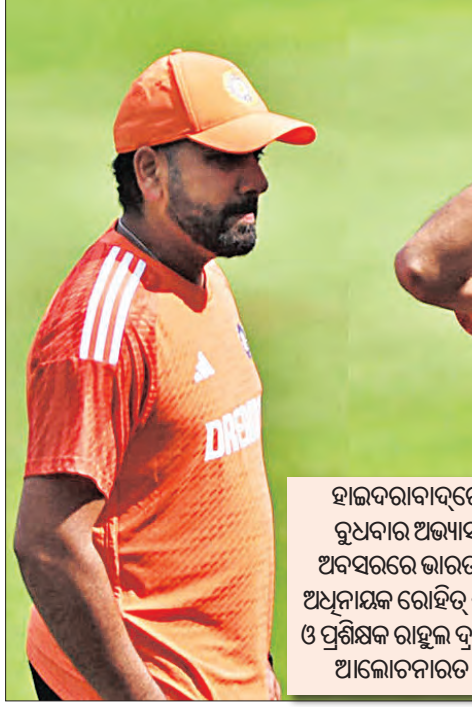
ହାଇଦରାବାଦରେ ରୁଧିରାଣୀ ଅଖ୍ୟାୟ ଅବସରରେ ଭାରତର ଅଧିନାୟକ ରୋହିତ୍ ଶର୍ମା ଓ ପ୍ରଶିକ୍ଷକ ରାହୁଲ ଦ୍ରାବିଡ୍ ଆଲୋଚନାରେ।

ସର୍ବବୃହତ୍/ସର୍ବନିମ୍ନ ଦଳଗତ ସ୍କୋର ଭାରତ ନାମରେ ରହିଛି।