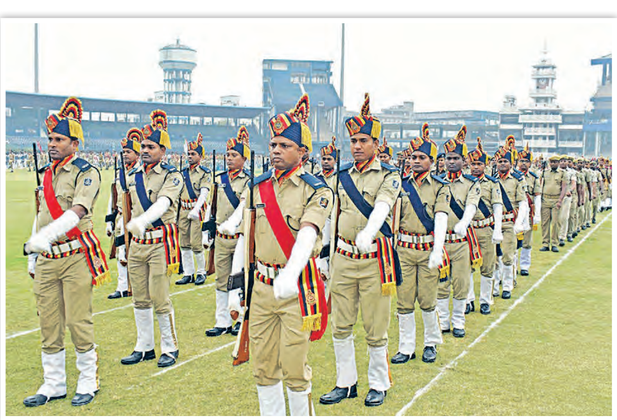
ସାଧାରଣତନ୍ତ୍ର ଦିବସ ପାଇଁ ବୁଧବାର କଟକ ବାରବାଟୀ ସ୍ତ୍ରୀତ୍ୟାଗରେ ପରେଡ଼ ଅଭିଯାନ

ଚାହିଦା ମେଣ୍ଟାଇଥାଏ । ମାଲଗୋଦାମକୁ ଦେଇଥିବା ପ୍ରାୟ ୫୦ ଟଙ୍କା ଡାଲି ଆସିଥାଏ । ବ୍ୟବସାୟକ କହିବାନୁସାରେ ଡାଲି ଦର ବଢ଼ିଯିବାରୁ ସେପାର କମିଯାଇଛି । ରାଜ୍ୟରେ ରବି ରତ୍ନରେ ସାଧାରଣତଃ ମୁଗ ଓ ବିଭିନ୍ନ ଡାଲି ବହୁଳ ପରିମାଣରେ ଉତ୍ପାଦନ ହୋଇଥାଏ । ଉପକୂଳ ଜିଲ୍ଲା ମାଲକରେ ବେଶୀ ଏହି ଡାଲି ହୋଇଥାଏ । ଏଥିର ଅଦିନିଆ ବର୍ଷା ପାଇଁ ଏହି ଫସଲ ନଷ୍ଟ ହେବ ବୋଲି କୁହାଯାଇଛି । ଏବେ ମୁଗ ଓ ବିଭିନ୍ନ ଡାଲି ଦର କିଲୋ ପ୍ରତି ୧୨୦ ଟଙ୍କା ହୋଇଛି । ସେହିପରି ମସୁର ଡାଲି କିଲୋ ପ୍ରତି ୮୦ରୁ ୯୦ ଟଙ୍କା ଥିବା ବେଳେ ବୁଟ ଡାଲି ଦର ୧୦ ଟଙ୍କା ରହିଛି । କୃଷି ବିଭାଗର ତଥ୍ୟ ଅନୁସାରେ ରାଜ୍ୟରେ ବର୍ଷକୁ ମାତ୍ର ଦେଢ଼ ଲକ୍ଷ ଟନ ବିଭିନ୍ନ ପ୍ରକାର ଡାଲି କାଟାୟ ଶସ୍ୟ ଚାଷିକ ଉତ୍ପାଦନ କରିଥାଏ । ହେଲେ ବାର୍ଷିକ ପ୍ରାୟ ୪ ଲକ୍ଷ ଟନରୁ ଅଧିକ ଡାଲି ଲୋକେ ଖାଇଥାନ୍ତି । ଏଥିର ଉତ୍ପାଦନ କମିଯିବ ପୁଣି ଦର ଆକାଶକୁ ହେବ ବୋଲି କୁହାଯାଇଛି ।