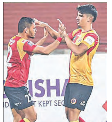
ଆଜି ଦ୍ଵିତୀୟ ସେମିଫାଇନାଲ ଓଡ଼ିଶା ଏସିଏ ବନାମ ମୁମ୍ବାଇ ସିଟି ସମୟ ରାତି ୭.୩୦ ସ୍ଥାନ: କଳିଙ୍ଗ ଷ୍ଟାଡିୟମ

ଭୁବନେଶ୍ଵର, ୨୪।୧ (ସିନି): ସ୍ଥାନୀୟ କଳିଙ୍ଗ ଷ୍ଟାଡିୟମରେ ଚାଲିଥିବା 'କଳିଙ୍ଗ ସୁପର କପ୍' ଫୁଟବଲ ପ୍ରତିଯୋଗିତାର ୪ର୍ଥ ଏସିଏଲରେ ପ୍ରଥମ ଦଳ ଭାବେ ଇଷ୍ଟ ବେଙ୍ଗଲ ଏସିଏ ଫାଇନାଲରେ ପ୍ରବେଶ କରିଛି। ରୁଧିରାଣୀ ଖେଳାଯାଇଥିବା ପ୍ରଥମ ସେମିଫାଇନାଲରେ ଇଷ୍ଟ ବେଙ୍ଗଲ ୨-୦ ଗୋଲରେ ଜାମସେଦପୁର ଏସିଏକୁ ପରାସ୍ତ କରିଥିଲା। ଏଥିପରେ ଇଷ୍ଟବେଙ୍ଗଲ ସୁପର କପ୍ରେ ପ୍ରଥମଥର ଫାଇନାଲ ଖେଳିବାର ସୌଭାଗ୍ୟ ହାସଲ କରିଛି। ଗୁରୁବାର ୨ୟ ସେମିଫାଇନାଲରେ ଘରୋଇ ଓଡ଼ିଶା ଏସିଏ ସହ ମୁମ୍ବାଇ ସିଟି ଏସିଏର ଲକ୍ଷକେ ହେବ। ଗତବର୍ଷ ଓଡ଼ିଶା ଏସିଏ ସୁପର କପ୍ ଚାମ୍ପିଅନ ହୋଇଥିଲା।