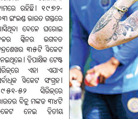
ଇଲଣ୍ଡ ଅଧିନାୟକ ବେନ୍ ଷୋକ୍ସ

ଗୋଟିଏ ସିରିଜ୍ରେ ସର୍ବାଧିକ ଡିକେଟ୍ ନେବାର ରେକର୍ଡ ଭାରତୀୟ ଖେଳାଳିଙ୍କ ନାମରେ ରହିଛି। ୧୯୭୨-୭୩ ଇଲଣ୍ଡ ଭାରତ ଗସ୍ତରେ ଆସିଥିବା ବେଳେ ଘରୋଇ ଦଳର ସିନର ଉଭୟ ଚକ୍ରଶେଖର ୩୫ଟି ଡିକେଟ୍ ନେଇଥିଲେ। ଦ୍ଵିପାର୍ଶ୍ଵୀକ ଟେଷ୍ଟ ସିରିଜ୍ରେ ଏହା ଏଯାବ ସର୍ବାଧିକ ଡିକେଟ୍ ଫଗୁନ୍। ୧୯୫୧-୫୨ ସିରିଜ୍ରେ ଭାରତର ବିପ୍ଳୁ ମିଶ୍ର ୩୫ଟି ଡିକେଟ୍ ନେଇ ବିତୀର