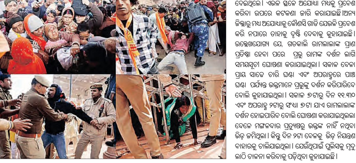
ଲୋକଙ୍କୁ ଶାନ୍ତି ବଜାଇ ରଖିବାକୁ କହିଥିଲେ। ଏହାସହିତ ମୁଖ୍ୟମନ୍ତ୍ରୀ ଯୋଗା ଅଧିକାରୀ ପୁଲିସ୍ ଡିଡିଙ୍କ ସହ ଆକାଶମାର୍ଗରୁ ସ୍ଥିତି ପରଖିଥିଲା ବେଳେ ଶୁଖାଳୁ ସହିତ ଭକ୍ତମାନଙ୍କୁ ନିୟନ୍ତ୍ରଣ କରିବାକୁ ଅଧିକାରୀମାନଙ୍କୁ ନିର୍ଦ୍ଦେଶ