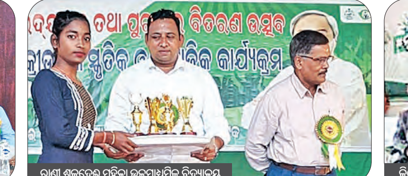
ରାଣୀ ଶୁକଦେବି ମହିଳା ଉଚ୍ଚମାଧ୍ୟମିକ ବିଦ୍ୟାଳୟ