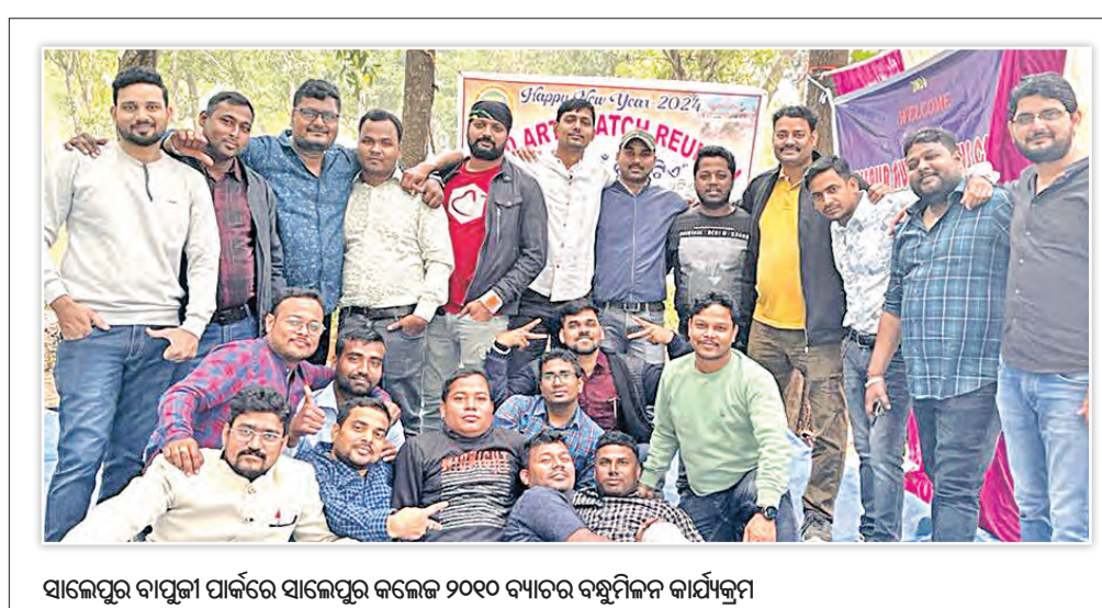
ସାଲେପୁର ବାପୁଜୀ ପାର୍କରେ ସାଲେପୁର କଲେଜ ୨୦୧୯ ବ୍ୟାଚର ବନ୍ଧୁମିଳନ କାର୍ଯ୍ୟକ୍ରମ