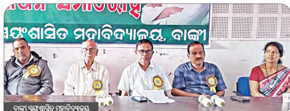
ବାଙ୍କୀ ସଂଘଶାସିତ ମହାବିଦ୍ୟାଳୟ