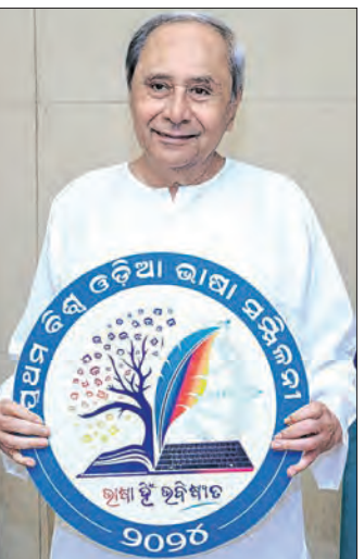
ଏଥିସହିତ ସମସ୍ତ ବିଭାଗୀୟ ପତ୍ରାଳୟରେ ଏହାକୁ ପ୍ରମୁଖ ଭାବେ ସ୍ଥାନିତ କରିବାକୁ ପ୍ରମୁଖ୍ୟ ସଚିବ ନିର୍ଦ୍ଦେଶନା ଦେଇଛନ୍ତି ।

ସରକାରୀ ଗାଡ଼ି, ପ୍ରମୁଖ ସ୍ଥାନରେ ବ୍ୟବହାର ହେବ ପ୍ରମୁଖ୍ୟମନ୍ତ୍ରୀଙ୍କ ଦ୍ୱାରା ଉଦ୍ଘୋଷିତ ଲୋଗୋ ସମସ୍ତ ବିଭାଗୀୟ ପତ୍ରାଳୟରେ ବ୍ୟବହାର ନିମନ୍ତେ ନିର୍ଦ୍ଦେଶ ଦେଲେ ପ୍ରମୁଖ୍ୟ ଶାସନ ସଚିବ