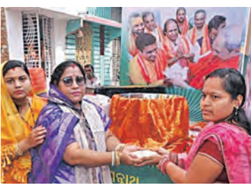
ବିଭିନ୍ନ ପଞ୍ଚାୟତରୁ ପ୍ରାୟ ୧୦ହଜାର ଲୋକ ଆସି ପ୍ରଥମ ସଙ୍ଗମ ପାର୍ଟିରେ ପହଞ୍ଚିବେ । ସେମାନେ ଆଣିଥିବା ଗୁଆ, ଅରୁଆ ଚାଉଳ, ନଡ଼ିଆ ଆଦି ଦେବା ପରେ ମହାପ୍ରଭୁଙ୍କ ଦର୍ଶନ ସହ ଶ୍ରୀମନ୍ଦିର ପରିକ୍ରମା ପ୍ରକଳ୍ପ ବୁଲିବେ । ସମସ୍ତଠାରେ ୧୦ ହଜାର ଲୋକଙ୍କ ଖାଦ୍ୟ ସହ ବିଶ୍ରାମ ବ୍ୟବସ୍ଥା କରାଯାଇଛି ।

■ ପୁରୀ, ୨୧।୧ (ସମିପ): ଅର୍ପଣ ରଥରେ ଫଗୁଆତ ପ୍ରତ୍ୟେକ ସାମଗ୍ରୀ ଏବଂ ଦାନ ଅର୍ଥ ଶ୍ରୀକ୍ଷେତ୍ର ଆସିବ । ଏସବୁ ମହାପ୍ରଭୁଙ୍କ କାମରେ ହିଁ ଲାଗିବ । ଏଥିପାଇଁ ସମସ୍ତ ପ୍ରକାର ପ୍ରସ୍ତୁତି ସରିଛି । ଚେବେ ଅର୍ପଣ ରଥରେ ଫଗୁଆତ ଦାନ ଟଙ୍କା ଶ୍ରୀମନ୍ଦିର ତୋନେସର୍ ଦେଲେ ଜମା ହେବ । ପ୍ରତି ଜିଲ୍ଲାକୁ ପ୍ରତିନିଧି ଏହି ଟଙ୍କା ଆଣି ଶ୍ରୀମନ୍ଦିର କାର୍ଯ୍ୟକ୍ରମ ତୋନେସର୍ ଦେଲେ ଦେବେ । ୨୨ରୁ ୨୫ତାରିଖ ପର୍ଯ୍ୟନ୍ତ ଏହି ଦେଲରେ ଟଙ୍କା ଦିଆଯିବ । ଏଥିପାଇଁ ସ୍ୱତନ୍ତ୍ର ଭାବେ କର୍ମଚାରୀଙ୍କୁ ଦାୟିତ୍ୱ ଦିଆଯାଇଛି । ସେମାନେ ଏହି ଟଙ୍କା ଗଣତି କରି ରଖିବେ । ସେହିପରି ଅର୍ପଣ ରଥରେ ଫଗୁଆତ ଗୁଆ, ଅରୁଆ ଚାଉଳ ଓ ନଡ଼ିଆ ଆଣି ପ୍ରତ୍ୟେକ ଜିଲ୍ଲାକୁ ଭକ୍ତମାନେ ପୁରୀ ଆସିବେ । ଏହି କାର୍ଯ୍ୟକ୍ରମ ଆସନ୍ତା ୨୫ତାରିଖରୁ ଆରମ୍ଭ କରାଯିବ । ତାଲିକା ଅନୁଯାୟୀ, ନିଜ ଜିଲ୍ଲାକୁ ବସ୍ତରେ ଭୋଜନାମାନେ ୨୪ ତାରିଖରେ ବାହାରିବେ । ପୁରୀରେ ପହଞ୍ଚି ୨୫ ତାରିଖରେ ଅରୁଆ ଚାଉଳ, ଗୁଆ ଗୁଣ୍ଡିଆ ମନ୍ଦିରରେ ସେମାନଙ୍କଠାରୁ ଗ୍ରହଣ କରାଯିବ । ପ୍ରତିଦିନ ମହାପ୍ରଭୁଙ୍କ ଦର୍ଶନ ପାଇଁ