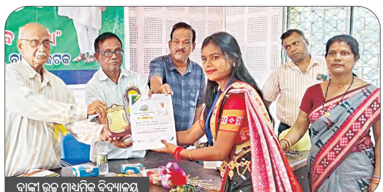
ବାଙ୍କୀ ଉଚ୍ଚ ମାଧ୍ୟମିକ ବିଦ୍ୟାଳୟ