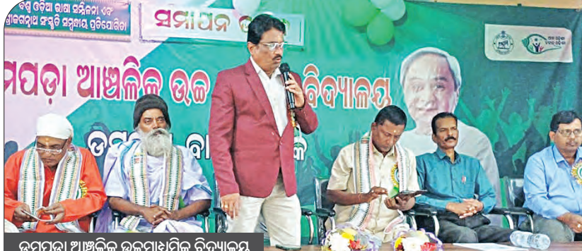
ତମପଡ଼ା ଆଞ୍ଚଳିକ ଉଚ୍ଚମାଧ୍ୟମିକ ବିଦ୍ୟାଳୟ