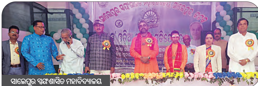
ସାଲେପୁର ସଂଘଶାସିତ ମହାବିଦ୍ୟାଳୟ