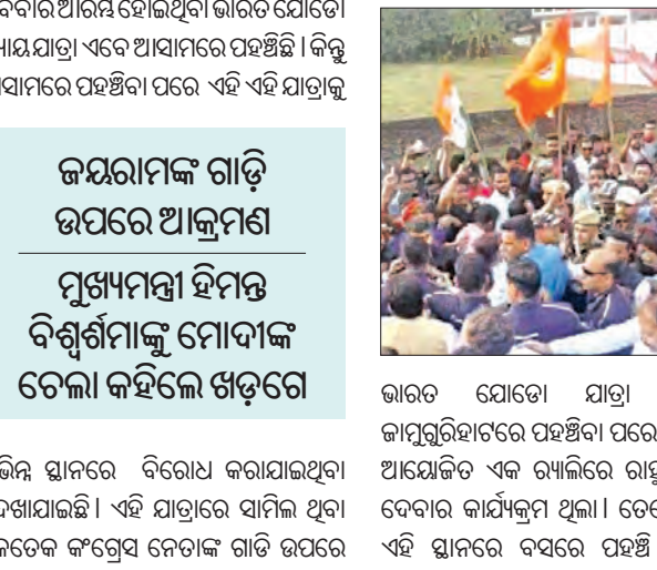
ଜୟରାମଙ୍କ ଗାଡ଼ି ଉପରେ ଆକ୍ରମଣ ମୁଖ୍ୟମନ୍ତ୍ରୀ ହିମନ୍ତ ବିଶ୍ୱଶର୍ମାଙ୍କୁ ମୋଦୀଙ୍କ ଠେଲୀ କହିଲେ ଖଡ଼୍‌ଗେ

ରାହୁଲଙ୍କୁ ବିଜେପି କର୍ମୀଙ୍କ ଠେଲୀପେଲ ଗୌହାଟୀ, ୨୧ (ଏକେଡ଼ି): ଗତକାଳି ଆକ୍ରମଣ କରାଯାଇଥିବା ବେଳେ ରବିବାର ରାହୁଲ ଗାନ୍ଧୀଙ୍କୁ ଠେଲୀପେଲ କରାଯାଇଛି। ମିଳିଥିବା ଖବର ଅନୁଯାୟୀ, ଆସିବା ପରେ ସେଠାରେ ଉପସ୍ଥିତ ଥିବା ଶତାଧିକ ବିଜେପି କର୍ମୀ ତାଙ୍କୁ ଠେଲୀପେଲ କରିଥିଲେ। ସ୍ଥିତି ଏଭଳି ହୋଇଥିଲା ଯେ, ଏକ ଜନସଭାକୁ ସମ୍ବୋଧନ କରି ବିଜେପି ବିରୋଧରେ ବର୍ଷଥିଲେ। ବିଜେପି ଗୁଣ୍ଡା ମାନେ ଯେତେବେଳେ ଯାତ୍ରା କରି ବିଜେପି ବିରୋଧରେ ବର୍ଷଥିଲେ। ବିଜେପି କର୍ମୀମାନେ ଯେତେବେଳେ ଯାତ୍ରା କଲେ ବି କଂଗ୍ରେସ କାହାକୁ ଭୟ କରେ ନାହିଁ କି ନିଜ ଆଭିମୁଖ୍ୟରୁ ଉଦ୍ଧରୀତ ନାହିଁ ବୋଲି କହିଥିଲେ। ଭାରତ ଯୋଡ଼େ ଯାତ୍ରା ତାଙ୍କର ବ୍ୟକ୍ତିଗତ ଯାତ୍ରା ନୁହେଁ, ବରଂ ଦେଶବାସୀଙ୍କୁ ନ୍ୟାୟ ମିଳିବା ଲକ୍ଷ୍ୟରେ କରାଯାଉଛି ବୋଲି ସେ କହିଥିଲେ। ଅନ୍ୟପକ୍ଷରେ ଆସାମରେ ହିମନ୍ତ ବିଶ୍ୱଶର୍ମା ନେତୃତ୍ୱ ବିଜେପି ସରକାର ଚାଲିଥିବାରୁ ଏହି ଘଟଣାକୁ ନେଇ କଂଗ୍ରେସ ଅଧିକ ମାଲିକାନା ଶୃଙ୍ଖଳାକୁ ବୃଦ୍ଧି କରିବାକୁ ଚାହୁଁଛନ୍ତି ବୋଲି କହିଥିଲେ। କିନ୍ତୁ କଂଗ୍ରେସ ଡରିବାର ନାହିଁ, ଦେଶବାସୀଙ୍କୁ ହିତସାଧନ ଲାଗି ବାହାରିଥିବା ଏହି ଯାତ୍ରା ଜାରି ରହିବ ବୋଲି ଖଡ଼୍‌ଗେ କହିଥିଲେ।