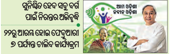
ସୁନିଶ୍ଚିତ ହେବ ସବୁ ବର୍ଗ ପାଇଁ ନିରନ୍ତର ଅଭିବୃଦ୍ଧି ୨୨ରୁ ଆରମ୍ଭ ହୋଇ ଫେବୃଆରୀ ୬ ପର୍ଯ୍ୟନ୍ତ ଚାଲିବ କାର୍ଯ୍ୟକ୍ରମ

■ ଭୁବନେଶ୍ୱର, ୧୯।୧ (ସମ୍ପାଦକ): ସମାଜର ସବୁ ବର୍ଗଙ୍କ ପାଇଁ ନିରନ୍ତର ଅଭିବୃଦ୍ଧି ସୁନିଶ୍ଚିତ କରିବା ପାଇଁ ରାଜ୍ୟ ସରକାର '୫-ଟି' ଉପକ୍ରମ ଆଧାରରେ ଅନେକ ଯୋଜନା କାର୍ଯ୍ୟକାରୀ କରୁଛନ୍ତି। ଏହି ଯୋଜନାକୁ ଯେପରି ଜଣେ ବି ଯୋଗ୍ୟ ହିତାଧିକାରୀ ବାଦ ନ ପଡ଼ନ୍ତି ତାକୁ ରାଜ୍ୟ ସରକାର ଗୁରୁତ୍ୱ ଦେଉଛନ୍ତି। ଏହି କ୍ରମରେ ଆସନ୍ତା ଜାନୁଆରୀ ୨୨ ତାରିଖରୁ ରାଜ୍ୟର ସହରାଞ୍ଚଳଗୁଡ଼ିକରେ ଆରମ୍ଭ ହେବ 'ଆମ ଓଡ଼ିଶା ନବୀନ ଓଡ଼ିଶା' (ସହରା) କାର୍ଯ୍ୟକ୍ରମ। ଏହି କାର୍ଯ୍ୟକ୍ରମ ମାଧ୍ୟମରେ ସରକାରୀ ଯୋଜନାଗୁଡ଼ିକ ସମ୍ପର୍କରେ ବିଶଦ ଆଲୋଚନା ହେବା ସହ ପ୍ରତି