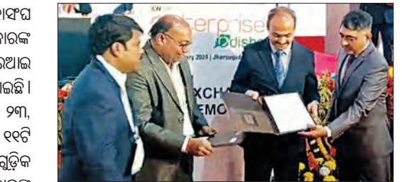
ଆହୁରି ବଡ଼ିବ ବୋଲି ଆଶା କରାଯାଉଛି। ଝାରସୁଗୁଡ଼ା ପ୍ରଦର୍ଶନୀ ପଡ଼ିଆରେ ଆୟୋଜିତ ଏହି ନିବେଶକ ସମ୍ମେଳନ ଆସନ୍ତା ୨୧ ତାରିଖ ପର୍ଯ୍ୟନ୍ତ ଚାଲିବ। ସମ୍ମେଳନର ଉଦ୍‌ଘାଟନା ପ୍ରସ୍ଥା-୯

■ ଝାରସୁଗୁଡ଼ା, ୧୯।୧ (ସମ୍ପାଦକ): ଭାରତୀୟ ଶିଳ୍ପ ମହାସଂଘ (ସିଆଇଆଇ) ଓଡ଼ିଶା ରାଜ୍ୟର ପକ୍ଷରୁ ଓଡ଼ିଶା ସରକାରଙ୍କ ସହଯୋଗରେ ପ୍ରଥମଥର ପାଇଁ ଝାରସୁଗୁଡ଼ାରେ ସିଆଇଆଇ ଏକ୍ସପ୍ରେସ୍ ଓଡ଼ିଶା ୨୦୨୪ ଶୁକ୍ରବାରଠାରୁ ଆରମ୍ଭ ହୋଇଛି। ଏହି ମହାଭାଗ୍ୟକାରୀ କାର୍ଯ୍ୟକ୍ରମରେ ଓଡ଼ିଶା ସରକାରଙ୍କ ସହ ୨୩, ୩୮୯.୪୩ କୋଟି ଟଙ୍କା ପୁଞ୍ଜିନିବେଶ ପ୍ରତିଶ୍ରୁତି ଥିବା ୧୧ଟି ବୁଝାମଣାପତ୍ର (ଏମ୍‌ଏସ୍) ସ୍ୱାକ୍ଷର ହୋଇଛି। ପ୍ରକଳ୍ପଗୁଡ଼ିକ କାର୍ଯ୍ୟକାରୀ ହେଲେ ରାଜ୍ୟରେ ୧୫, ୧୨୮ ଜଣ ଲୋକଙ୍କ ପାଇଁ ନିୟୁତ୍ତି ସୁଯୋଗ ସୃଷ୍ଟି ହେବ। ଏହି ସମ୍ମିଳନୀରେ ଦୁଇଦିନ ମଧ୍ୟରେ ବହୁସଂଖ୍ୟାରେ ଜିଏଚ୍ ଓ ଜିଏଚ୍ ଟେକ୍ ଆୟୋଜନ ହେବାର କାର୍ଯ୍ୟକ୍ରମ ଥିବାରୁ ପୁଞ୍ଜିନିବେଶ ପ୍ରସ୍ତାବ ପରିମାଣ