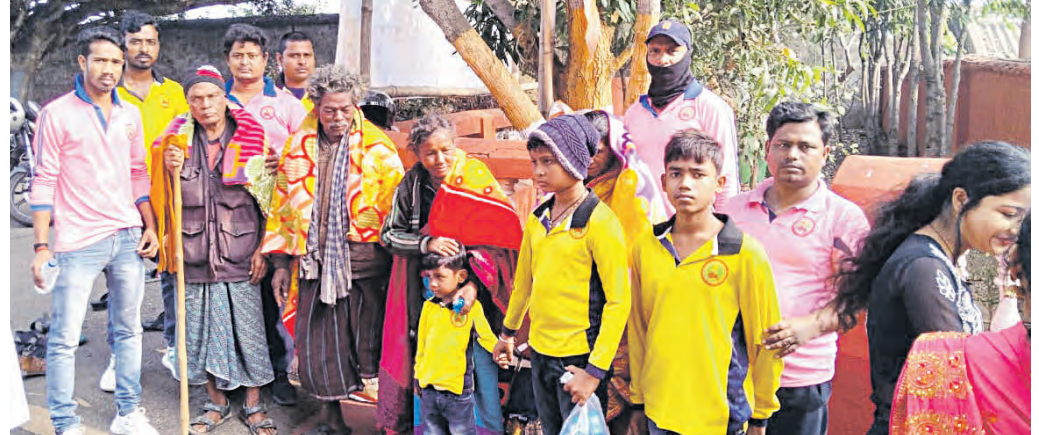
ପାରାଦୀପ, ୧୧ (ସମ୍ପାଦକ): ନିଆରା ଢଙ୍ଗରେ ନବବର୍ଷ ପାଳନ କରିଛନ୍ତି ବିଭିନ୍ନ ଶାଳ ଖୁସି ମନାଉଛନ୍ତି।

ଖାଦ୍ୟ ବଣ୍ଟନ କରିଛନ୍ତି। ଏହି କାର୍ଯ୍ୟକ୍ରମ ବିଭିନ୍ନ ଶାଳ ଖୁସି ମନାଉଛନ୍ତି।