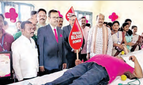
ପାରାଦାସ ବିଭିନ୍ନ ଅନୁଷ୍ଠାନ, ବ୍ୟକ୍ତି ବିଶେଷ, ଅନୁଷ୍ଠାନକୁ ଭଲ ପାଇଥିବା ପୁରୁଷ ଓ ମହିଳା ରକ୍ତଦାନୀମାନେ ଆସି ଶିବିରରେ ସେକ୍ସକ୍ସ ଭାବେ ରକ୍ତଦାନ କରିଥିଲେ ।

ରକ୍ତଦାନ ଏକ ମହତ୍ତ୍ୱପୂର୍ଣ୍ଣ କାର୍ଯ୍ୟକ୍ରମ । ରକ୍ତ ଦାନ ଯେଉଁଠି କୌଣସି ଲୋକ ନ ମିଳୁ, ଏଭଳି ପ୍ରୟାସ ନେଇ ଆହୁନ କମ୍ପାଉଣ୍ଡ ଦାଫି ୧୦ ବର୍ଷ ଧରି ପ୍ରୟାସ ଜାରି ରଖିଛନ୍ତି ।