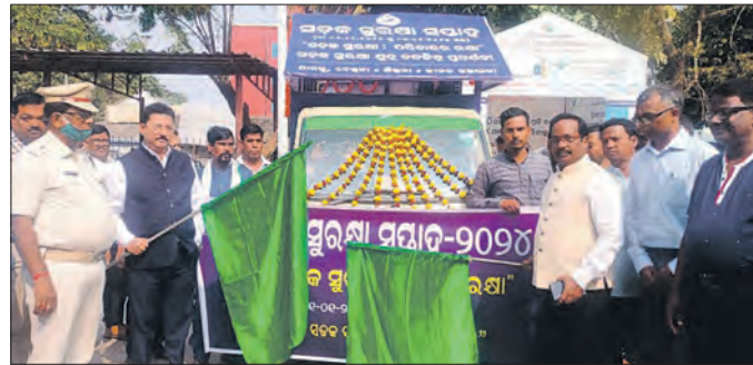
କେନ୍ଦ୍ରାପଡ଼ା, ୧୧(ସମ୍ପାଦକ): ଭ୍ରାମ୍ୟମାଣ ସଚେତନତା ରଥ ଉଦ୍ଘାଟନ ହୋଇଯାଇଛି।

କେନ୍ଦ୍ରାପଡ଼ା, ୧୧(ସମ୍ପାଦକ): ଜାତୀୟ ସଡ଼କ ସୁରକ୍ଷା ସପ୍ତାହ-୨୦୨୪ ପାଳନ ଅବସରରେ ଭ୍ରାମ୍ୟମାଣ ସଚେତନତା ରଥ ଉଦ୍ଘାଟନ ହୋଇଯାଇଛି।