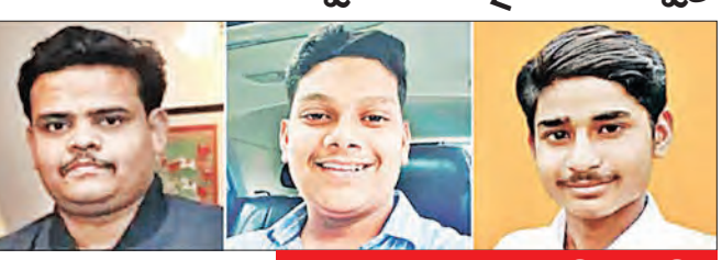
ବାରାଣସୀ, ୧୧ (ଏକେଡି) ନେଇ ଆଇଆଇଟି-ବିଏଚ୍‌ସିରେ ଜୋରଦାର ବିଶୋଧ ପ୍ରଦର୍ଶନ ହୋଇଥିଲା। ଏହାକୁ ବେଶ୍ ତିନି ଅଭିଯୁକ୍ତ ଭୟ କରିଯାଇଥିଲେ। ଘଟଣାର ତାରିଖ ଦିନ ପରେ ନଭେମ୍ବର ୫ରେ ସହର ଛାଡ଼ି ମଧ୍ୟପ୍ରଦେଶ ପଳାଇଥିଲେ। ଏଠାରେ ମଧ୍ୟପ୍ରଦେଶ ବିଧାନସଭା ନିର୍ବାଚନ ପାଇଁ ବିଜେପି ଆଇଟି ସେଲରେ ସାମିଲ ହୋଇଥିଲେ।