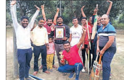
ଏରସମା ଯୁବକଙ୍କୁ ନେଇ ଡିଭିସନ କ୍ରିକେଟ୍ ଟୁର୍ଣ୍ଣାମେଣ୍ଟ ଅନୁଷ୍ଠିତ ହୋଇଥିଲା । ଏଥିରେ ୪ଟିଦଳ ଭାଗ ନେଇଥିବା ବେଳେ ଜାଗୁଳାଇ ଟିମ୍ ୫୩ରୁ କରାଯାଇ ବିଜୟ ଲାଭ କରିଛି ।

ଏରସମା, ୧୧ (ସମିପ) : ଏରସମା -ୟୁବ ଚମ୍ପେଶ୍ୱର ଡିଭିସନ ଗ୍ରାମର ଯୁବକଙ୍କୁ ନେଇ ଡିଭିସନ କ୍ରିକେଟ୍ ଟିମ୍ ଆଗେ ଅଭିଯୋଗ ଦିନିକିଆ କ୍ରିକେଟ୍ ଟୁର୍ଣ୍ଣାମେଣ୍ଟ ଅନୁଷ୍ଠିତ ହୋଇଥିଲା । ଏଥିରେ ୪ଟିଦଳ ଭାଗ ନେଇଥିବା ବେଳେ ଜାଗୁଳାଇ ଟିମ୍ ୫୩ରୁ କରାଯାଇ ବିଜୟ ଲାଭ କରିଛି ।