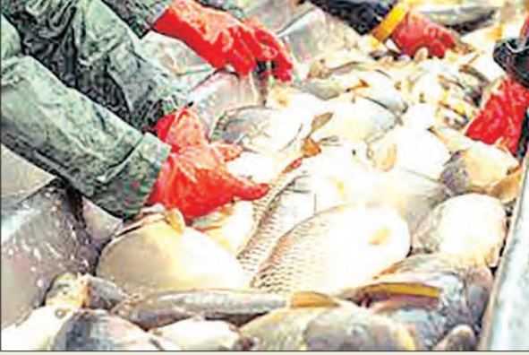
କିଲୋ ୧୨୦ରୁ ୧୮୦ ଟଙ୍କା ରହିଛି । ଗୋଟିଏ ଅଡେଇ ଗୁଣା ବୃଦ୍ଧି ପାଇଥିବା ଜଣାପଡ଼ିଛି । ଅବଶ୍ୟ ପଟରେ ଜିଲ୍ଲାରେ ବାର୍ଷିକ ହାରାହାରି ୩୨ ହଜାର ଜିଲ୍ଲାରେ ମାଛ ଉତ୍ପାଦନ ନିଅଣ୍ଟିଆ ଥିବା ଜଣାପଡ଼ିଛି ।

ଏବେ କଟକ ସହରକୁ ଦୈନିକ ୨୦ ଟନ୍ ମାଛ ଆମଦାନୀ ହେଉଛି । ସହରରେ ପ୍ରାୟ ୩୦ରୁ ଅଧିକ ମାଛ ଗୋଦାନ ରହିଛି । ତେବେ ପୂର୍ବରୁ ଯେତିକି ପରିମାଣରେ ଅଳ୍ପପ୍ରଦେଶରୁ ମାଛ ଆମଦାନୀ ହେଉଥିଲା ତାହା ଏବେ ହ୍ରାସ ପାଇଛି । କାରଣ ଜିଲ୍ଲାରେ ମାଛ ଉତ୍ପାଦନ ପ୍ରତି ବର୍ଷ ବୃଦ୍ଧି ପାଇ ଚାଲିଛି । ମିଳିଥିବା ସୂଚନାମୁତାବେ ଜିଲ୍ଲାରେ ବର୍ଷକୁ ପ୍ରାୟ ୨୭ ହଜାର ମେଟ୍ରିକ ଟନ୍ ମଧ୍ୟରୁ କମ ମାଛ ଉତ୍ପାଦନ ହେଲାଣି । ହାତପାଆଁରେ ପର୍ଯ୍ୟାପ୍ତ ଦେଶୀ ମାଛ ମିଳି ଯାଉଥିବା ହେତୁ ପୂର୍ବରୁ ଅଳ୍ପ ଅବା ବାଲୁଗାଠାରୁ ଆସୁଥିବା ମାଛର ଚାହିଦା ନ ଥିବା ଜଣାପଡ଼ିଛି । ଦେଶୀ ମାଛ କିଲୋ ପ୍ରତି ଏବେ ୨୦୦ରୁ ୨୫୦ଟଙ୍କାରେ ବିକ୍ରି ହେଉଥିବା ବେଳେ ଅଳ୍ପ ମାଛ