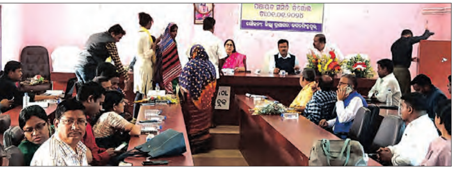
ସମସ୍ୟା ସମ୍ପର୍କରେ ଯୁକ୍ତି ଦେବା ପାଇଁ ଉପସ୍ଥିତ ରହି ଉପସଭାପତି ଡିଡିଓଲ ବୁକ୍ କାର୍ଯ୍ୟାଳୟର ଅଧିକାରୀଙ୍କ ସହିତ ଶୁଣାଣି କରାଯାଇଥିଲା ।