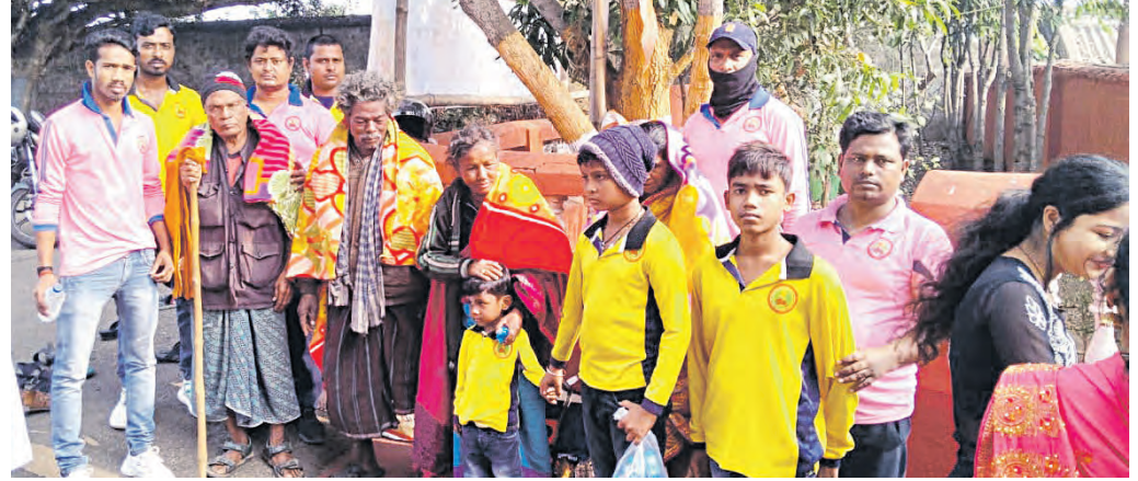
ପାରାଦୀପ, ୧୧ (ସମ୍ପାଦକ): ନିଆରା ଭଙ୍ଗରେ ନବବର୍ଷ ପାଳନ କରିଛନ୍ତି ବିଭିନ୍ନ ଶାଖା ବିଭାଗର କର୍ମଚାରୀମାନେ।

ଖାଦ୍ୟ ବଣ୍ଟନ କରିଛନ୍ତି। ଏହି କାର୍ଯ୍ୟକ୍ରମ ବିଭିନ୍ନ ଶାଖା ବିଭାଗର କର୍ମଚାରୀମାନଙ୍କୁ ଏକତ୍ର କରିବା ପାଇଁ ଉଦ୍ଦିଷ୍ଟ।