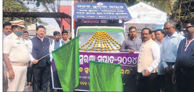
କେନ୍ଦ୍ରାପଡ଼ା, ୧୧(ସମ୍ପାଦକ): ଜାତୀୟ ସଡ଼କ ସୁରକ୍ଷା ସପ୍ତାହ-୨୦୨୪ ପାଳନ ଅବସରରେ ଭ୍ରାମ୍ୟମାଣ ସଚେତନତା ରଥ ଉଦ୍ଘାଟନ କରାଯାଇଛି।

କେନ୍ଦ୍ରାପଡ଼ା ସଦର ମହକୁମାରେ ଭ୍ରାମ୍ୟମାଣ ସଚେତନତା ରଥ ଉଦ୍ଘାଟନ କରାଯାଇଛି। ଏଥିରେ ବିଭିନ୍ନ ଶାଖା ବିଭାଗର କର୍ମଚାରୀମାନେ ଯୋଗଦେଇଥିଲେ।