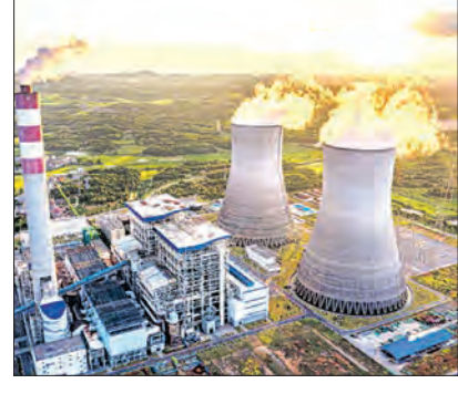
ପ୍ରକଳ୍ପ ଭାବେ ସାଉଥ୍ ଇଣ୍ଡିଆ କୋଲ୍ ଫିଲ୍ଡ୍

ମହାନଦୀ ବେସିନ୍ ପାଖରେ ଲିମିଟେଡ୍ (ଏମସିଏଏଲ୍) କରିଆରେ ମହାନଦୀ କୋଲ୍ ଫିଲ୍ଡ୍ ଲିମିଟେଡ୍ (ଏମସିଏଏଲ୍) ପକ୍ଷରୁ ସୁନ୍ଦରଗଡ଼ରେ ୧୬୦୦ ମେଗାଓର୍ କ୍ଷମତା ବିଶିଷ୍ଟ ପାଉଜ ବିଦ୍ୟୁତ୍ ପ୍ଲାଣ୍ଟ ପ୍ରତିଷ୍ଠା କରାଯିବ। ପ୍ରଧାନମନ୍ତ୍ରୀ ନରେନ୍ଦ୍ର ମୋଦୀଙ୍କ ଅଧିକାରରେ ଅନୁଷ୍ଠିତ ଆର୍ଥିକ ବ୍ୟାପାର ସଂକ୍ରାନ୍ତ କ୍ୟାବିନେଟ୍ କମିଟି ଗୁରୁବାର ଦୁଇଟି ପାଉଜ ବିଦ୍ୟୁତ୍ ପ୍ଲାଣ୍ଟ ପ୍ରତିଷ୍ଠା ପାଇଁ ଇଲ୍ୟୁପ୍ଟି ନିବେଶ ପ୍ରସ୍ତାବକୁ ମଞ୍ଜୁରୀ କରିଛି। ପ୍ରଥମ