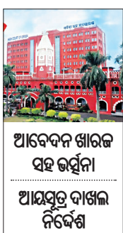
ଆବେଦନ ଖାରଜ ସହ ରହିବ ଆଇସ୍ପିଟି ଦାଖଲ ନିର୍ଦ୍ଦେଶ

କଟକ, ୧୬୧୧ (ସମ୍ପାଦନା): ଶ୍ରୀମନ୍ଦିର ପରିକ୍ରମା ପ୍ରକଳ୍ପ ଉଦ୍‌ଘାଟନ ବିରୋଧରେ ରୁକୁ ମାମଲାରେ ଆବେଦନକାରୀଙ୍କୁ ଛାଟି ଦିଆଯାଇଛି।