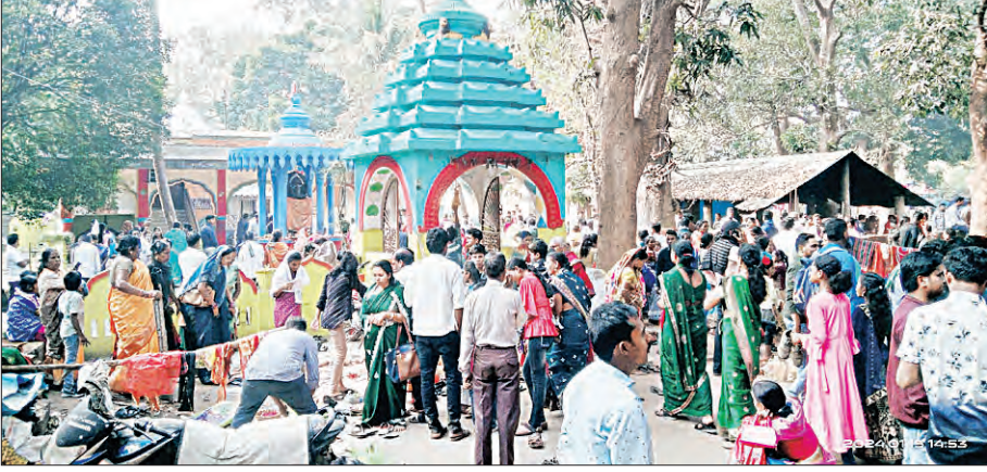
ଭକ୍ତମାନଙ୍କର ସୁରକ୍ଷା ପ୍ରତି ବିଶେଷ ନଜର ରଖିଛନ୍ତି । ଆଜି ମକରସଂକ୍ରାନ୍ତୀ ଯୋଗୁଁ ଉଭୟ ପାଠରେ ଦର୍ଶନ ପାଇଁ ଅସମ୍ଭବ ଭିଡ ପରିଲକ୍ଷିତ ହୋଇଛି । ଗୋବିନ୍ଦକେଶବର ମନ୍ଦିରରେ ସମ୍ପୂର୍ଣ୍ଣରେ ଯାତ୍ରାପଡ଼ିଆରେ ବିଭିନ୍ନ ମନୋହରୀ, ଆଖୁ ହରେକମାଳ, ବନ୍ୟଜାତ ଦ୍ରବ୍ୟ, ଟାଙ୍ଗୁ, ପିଲାଙ୍କ ଖେଳଣା, ଦୋଳି, କୃତ୍ରିମ ଯୋଡ଼ାରେ ପିଲାଙ୍କ ନୈକାବିହାର, ପାଷ୍ଟପୁଡ଼, ପିତଳ ଓ ଷ୍ଟିଲସାମଗ୍ରୀ, ଭାଗ୍ୟପରୀକ୍ଷା ଷ୍ଟାଲ ମାନଙ୍କରେ ଅସମ୍ଭବ ଭିଡ ଦେଖିବାକୁ ମିଳିଥିଲା ।

ଜେକାମାଲ ଜିଲ୍ଲା ଓଡ଼ାପଡ଼ା ବ୍ଲକ ଅନ୍ତର୍ଗତ ନାଧରାସ୍ଥିତ ବ୍ରାହ୍ମଣୀନଦୀକୂଳରେ ମା'ରାମଚଣ୍ଡୀଙ୍କ ପାଠରେ ଗତ୧୨ ତାରିଖରୁ ଆରମ୍ଭ ହୋଇଥିବା ବିଶ୍ୱଶକ୍ତି ଶ୍ରୀବିଷ୍ଣୁ ମହାଯଜ୍ଞ ଆଜି ଉପଯାପିତ ହୋଇଯାଇଛି । ସେହିପରି ଶ୍ରୀଗୋବିନ୍ଦକେଶବର ଶୈବପାଠରେ ଆଜିଠାରୁ ମକରଯାତ୍ରା ଆରମ୍ଭ ହୋଇଛି । ଏହା ଚାରିଦିନ ଧରି ଚାଲିବ । ଏଥିପାଇଁ ସହସ୍ରାଧିକ ଭକ୍ତଙ୍କ ଜନସମାଗମକୁ ଲକ୍ଷ୍ୟକରି ବେବୋଉର ବିଭାଗ ପୂର୍ବ ପ୍ରସ୍ତୁତି ଅନୁସାରେ ଜେକାମାଲ ପ୍ରଶାସନ, ମୋଟରଫୋର୍ସ ପୋଲିସ୍, ଅଗ୍ନିଶମ ବିଭାଗ, ମକରଯାତ୍ରା କମିଟି, ରାମଚଣ୍ଡୀ ମନ୍ଦିର କମିଟି, ନାଧରା ଗ୍ରାମକମିଟି, ନାଧରା ସରପଞ୍ଚ ଓ ସମସ୍ତ ସଭ୍ୟ ଏବଂ ନାଧରା କୁବର ସମସ୍ତ ସଦସ୍ୟମାନେ ସମଗ୍ର ସଜାଗ ରହି ଭକ୍ତମାନଙ୍କର ଠାକୁରଙ୍କ ଦର୍ଶନ, ଯାତ୍ରା ବୁଲିବା, ଗୀତ ପାଠ ଓ ଯାତାଯତକୁ ନଜର ରଖିଛନ୍ତି । ବିଶେଷ କରି ବ୍ରାହ୍ମଣୀନଦୀର ଆରପାରିରୁ ଯିବାଆସିବା କରୁଥିବା