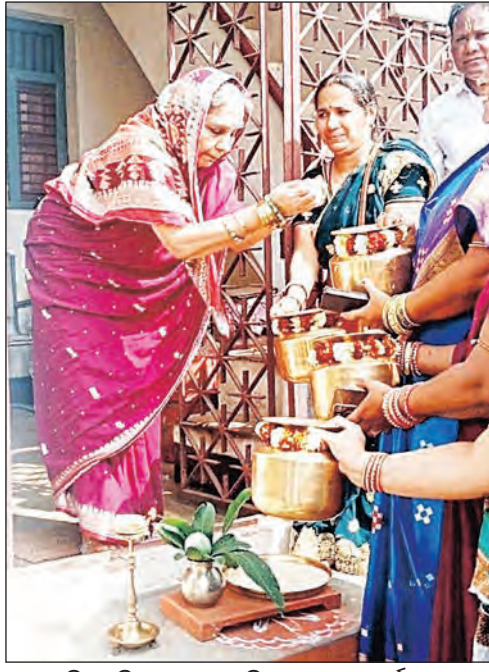
ଶ୍ରୀମନ୍ଦିର ପରିକ୍ରମା ପ୍ରକଳ୍ପ ଲାଗି ଜୟ ଜଗନ୍ନାଥ ଅର୍ପଣ ରଥକୁ ଜଣେ ଶ୍ରୀମାତୃ ଗୁଆ ଓ ଅକ୍ଷତ ପ୍ରଦାନ କରୁଛନ୍ତି