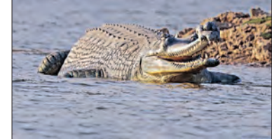
ସଂରକ୍ଷଣ ପାଇଁ ମାୟାଜୀବାକୁ କରାଯିବ ସଚେତନ

■ ଭୁବନେଶ୍ୱର, ୧୪/୧ (ସମ୍ବାଦ): ରାଜ୍ୟରେ ଘଡ଼ିଆଳ କୁମ୍ଭୀରଙ୍କ ସୁରକ୍ଷା ଓ ସଂରକ୍ଷଣ ସୁନିଶ୍ଚିତ କରିବେ 'କୁମ୍ଭୀର ବନ୍ଧୁ'। ବର୍ତ୍ତମାନ କୁମ୍ଭୀରଙ୍କ ସଂଖ୍ୟା ଓ ସଂରକ୍ଷଣ ଦୃଷ୍ଟିରେ ଭିତରକନିକା ବର୍ଗମାନ ଦେଶ ବିଦେଶରେ ପରିତ୍ୟକ୍ତ ପାଇଛି। କୁମ୍ଭୀରଙ୍କ ଅନ୍ୟ ଏକ ପ୍ରକାରି ମଗରଙ୍କ ସଂଖ୍ୟା ମଧ୍ୟ ଓଡ଼ିଶାରେ ବେଶ୍ ଭଲ ରହିଛି। ଏହି ଦୁଇ ପ୍ରକାରିକ ଭଳି ଘଡ଼ିଆଳଙ୍କ ସଂଖ୍ୟା କିପରି ବୃଦ୍ଧି ପାଇବ ତାକୁ ବନ ବିଭାଗ ଗୁରୁତ୍ୱ ଦେଉଛି। ଏଥିପାଇଁ 'ଗଜ ସାଥୀ' ଢାଆଁରେ 'କୁମ୍ଭୀର ବନ୍ଧୁ' ନାମରେ ଏକ ଯୋଜନା ପ୍ରସ୍ତୁତ କରିଛି ବନ ବିଭାଗ। ଘଡ଼ିଆଳଙ୍କ ସଂରକ୍ଷଣ ଓ ସଂଖ୍ୟା ବୃଦ୍ଧି ପାଇଁ ଏହି 'କୁମ୍ଭୀରବନ୍ଧୁ' ନାମରେ