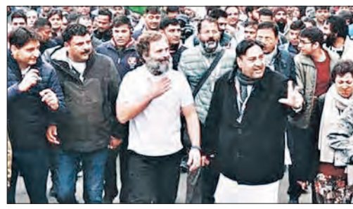
ରାହୁଲ, ୧୪/୧ (ଏକେନ୍ଦ୍ରି)

ପ୍ରାୟ ବର୍ଷକ ପରେ ଭାରତ ଯୋଡ଼ୋ ଯାତ୍ରାର ଦ୍ଵିତୀୟ ଫେରାଉଣ ଭାବେ କଂଗ୍ରେସ ନେତା ରାହୁଲ ଗାନ୍ଧୀ ରବିବାର ମଣିପୁରରୁ ଭାରତ ଯୋଡ଼ୋ ନ୍ୟାୟ ଯାତ୍ରା ଆରମ୍ଭ କରିଛନ୍ତି । ଦଳର ବହୁ ବରିଷ୍ଠ ନେତାଙ୍କ ସହ ରାହୁଲ ରବିବାର ସକାଳେ ଏକ ଘରୋଇ ବିମାନରେ ଇମ୍ଫାଲରେ ପହଞ୍ଚିବା ପରେ ଖୋଜକୋମ୍ ଠାରେ ୧୮ ଓ ୧୯ ଆଜ୍ଞାଲୋ-ମଣିପୁର ଯୁଦ୍ଧ ସହିଦମାନଙ୍କ ଉଦ୍‌ଘୋଷଣା ଦେଇଥିଲେ । ଏହାପରେ ସେ ଏଠାରେ ଆୟୋଜିତ ଏକ ରାଲିରେ ଯୋଗ ଦେଇ ଜନସଭାକୁ ସମ୍ବୋଧିତ କରିଥିଲେ । ଏହି ଅବସରରେ ଉତ୍ତରବର୍ଷ ମେ ' ମାସରୁ ମଣିପୁରରେ ଆରମ୍ଭ ହୋଇଥିବା ସାମ୍ବାଦିକ ହିଂସା ଏବଂ ଏଥିରେ ହଜାର ହଜାର ପାଠିତଙ୍କ ବେଦନାର କଥା କହିଥିଲେ । ବର୍ତ୍ତମାନ ସୁଦ୍ଧା ରାଜ୍ୟର ହଜାର ହଜାର ନିର୍ଦ୍ଦୋଷ ପ୍ରାପ୍ତ ଲୋକ ଦୁର୍ଘଟଣା ମଧ୍ୟକୁ ନେଇ ହୋଇଯାଇଥିଲା ବେଳେ ମୋଦୀ ସରକାରଙ୍କ ଏଥିପାଇଁ ଚିତ୍କେ ମାତ୍ର ଶୋଚନା ନାହିଁ ବୋଲି ରାହୁଲ କହିଥିଲେ । ପ୍ରଧାନମନ୍ତ୍ରୀ ମୋଦୀ