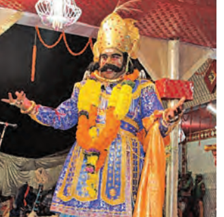
ସର୍ବବୃହତ୍ ମୁକ୍ତାକାଶ ରଙ୍ଗମଞ୍ଚରେ ୧୧ ଦିନ ଧରି ଚାଲିବ ଅଭିନୟ ବରଗଡ଼ ସହର ହେବ ମଥୁରାନଗର, ଅନୁପାଳି ପାଲଟିବ ଗୋପପୁର ଜାଗା ନଦୀ ସାହିବ ଯମୁନା

■ ବରଗଡ଼, ୧୪/୧ (ସମ୍ବାଦ): ସୋମବାରଠାରୁ ଆନୁଷ୍ଠାନିକ ଭାବେ ଆରମ୍ଭ ହେବ ବିଶ୍ୱର ସର୍ବବୃହତ୍ ମୁକ୍ତାକାଶ ରଙ୍ଗମଞ୍ଚ। ବରଗଡ଼ରେ ହୋଇଥିବା ପ୍ରଥମ ଥର ଏହି ବିଶ୍ୱପ୍ରସିଦ୍ଧ ଧନୁଯାତ୍ରା ମହୋତ୍ସବ ୧୧ ଦିନ ଧରି ଚାଲିବ। ଏହି ସମୟରେ ବରଗଡ଼ ସହର, ମଥୁରାନଗର ଏବଂ ଉପକଣ୍ଠରେ ଥିବା ଅନୁପାଳି ଗାଁ ଗୋପପୁର ପରିଗଣିତ ହୁଏ। ଏହା ମଝିରେ ପ୍ରବାହିତ ହେଉଥିବା ଜାଗା ନଦୀ, ଯମୁନା ନଳରେ ପରିଗଣିତ ହେବ। ବରଗଡ଼ ସହରର ଜନସାଧାରଣ ମଥୁରାନଗରର ପ୍ରଜା ଏବଂ ଅନୁପାଳିରେ ସମସ୍ତେ ଗୋପପୁରବାସୀ ଭାବେ ଏହି ବର୍ଷାଦି ଅଭିନୟ ପରମ୍ପରାରେ ସାମିଲ ହେବେ। ଚଳିତବର୍ଷ ୭୬ ବର୍ଷରେ ପଦାର୍ପଣ କରୁଛି ଏହି ମହୋତ୍ସବ। ଏଥିପାଇଁ ସହରସାରା ଉତ୍ସାହ ଆଲୋକମାଳାରେ