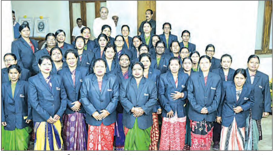
ରବିବାର ହୁବାଇ ଗଣ୍ଡ ପୂର୍ବରୁ ମିଶନ ଶକ୍ତି ମହିଳା ପ୍ରତିନିଧିମାନେ ନବୀନ ନିବାସରେ ମୁଖ୍ୟମନ୍ତ୍ରୀଙ୍କୁ ସାକ୍ଷାତ କରୁଛନ୍ତି