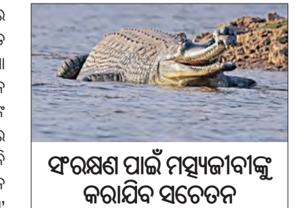
ସଂରକ୍ଷଣ ପାଇଁ ମାୟାଜୀବାଙ୍କୁ କରାଯିବ ସଚେତନ

■ ଭୁବନେଶ୍ୱର, ୧୪।୧ (ସମ୍ବାଦ): ରାଜ୍ୟରେ ଘଡ଼ିଆଳ କୁମ୍ଭୀରଙ୍କ ସୁରକ୍ଷା ଓ ସଂରକ୍ଷଣ ସୁନିଶ୍ଚିତ କରିବେ 'କୁମ୍ଭୀର ବନ୍ଧୁ'। ବଉଳ କୁମ୍ଭୀରଙ୍କ ସଂଖ୍ୟା ଓ ସଂରକ୍ଷଣ ଦୃଷ୍ଟିରେ ଭିତରକନିକା ବର୍ଗମାନ ବେଶ ବିଦେଶରେ ପରିଚିତ ପାଇଛି। କୁମ୍ଭୀରଙ୍କ ଅନ୍ୟ ଏକ ପ୍ରକାରି ମଗରଙ୍କ ସଂଖ୍ୟା ମଧ୍ୟ ଓଡ଼ିଶାରେ ବେଶ୍ ଭଲ ରହିଛି। ଏହି ଦୁଇ ପ୍ରକାରିକ ଭଳି ଘଡ଼ିଆଳଙ୍କ ସଂଖ୍ୟା କିପରି ବୃଦ୍ଧି ପାଇବ ତାକୁ ବନ ବିଭାଗ ଗୁରୁତ୍ୱ ଦେଉଛି। ଏଥିପାଇଁ 'ଗଜ ସାଥୀ' ଢାଆଁରେ 'କୁମ୍ଭୀର ବନ୍ଧୁ' ନାମରେ ଏକ ଯୋଜନା ପ୍ରସ୍ତୁତ କରିଛି ବନ ବିଭାଗ। ଘଡ଼ିଆଳଙ୍କ ସଂରକ୍ଷଣ ଓ ସଂଖ୍ୟା ବୃଦ୍ଧି ପାଇଁ ଏହି 'କୁମ୍ଭୀରବନ୍ଧୁ'ମାନେ