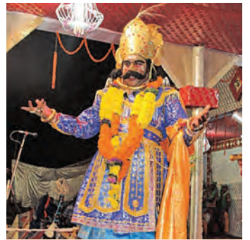
ସର୍ବବୃହତ୍ ମୁକ୍ତାକାଶ ରଙ୍ଗମଞ୍ଚରେ ୧୧ ଦିନ ଧରି ଚାଲିବ ଅଭିନୟ ବରଗଡ଼ ସହର ହେବ ମଥୁରାନଗରୀ, ଅନୁପାଳି ପାଲଟିବ ଗୋପପୁର ଜାଗା ନଦୀ ସାହିବ ଯମୁନା

■ ବରଗଡ଼, ୧୪।୧ (ସମ୍ବାଦ): ସୋମବାରଠାରୁ ଆନୁଷ୍ଠାନିକ ଭାବେ ଆରମ୍ଭ ହେବ ବିଶ୍ୱର ସର୍ବବୃହତ୍ ମୁକ୍ତାକାଶ ରଙ୍ଗମଞ୍ଚ। ବରଗଡ଼ରେ ହୋଇଥିବା ଏହି ବିଶ୍ୱପ୍ରସିଦ୍ଧ ଧନୁଯାତ୍ରା ମହୋତ୍ସବ ୧୧ ଦିନ ଧରି ଚାଲିବ। ଏହି ସମୟରେ ବରଗଡ଼ ସହର, ମଥୁରାନଗରୀ ଏବଂ ଉପକଣ୍ଠରେ ଥିବା ଅନୁପାଳି ଗାଁ ଗୋପପୁର ପରିଗଣିତ ହୁଏ। ଏହା ମଝିରେ ପ୍ରବାହିତ ହେଉଥିବା ଜାଗା ନଦୀ, ଯମୁନା ନଳରେ ପରିଗଣିତ ହେବ। ବରଗଡ଼ ସହରର ଜନସାଧାରଣ ମଥୁରାନଗରୀ ପ୍ରଜା ଏବଂ ଅନୁପାଳିରେ ସମସ୍ତେ ଗୋପପୁରବାସୀ ଭାବେ ଏହି ବର୍ଷାଦି ଅଭିନୟ ପରମ୍ପରାରେ ସାମିଲ ହେବେ। ଚଳିତବର୍ଷ ୭୬ ବର୍ଷରେ ପଦାର୍ପଣ କରୁଛି ଏହି ମହୋତ୍ସବ। ଏଥିପାଇଁ ସହରସାରା ଉତ୍ସାହ ଆଲୋକମାଳାରେ