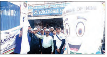
ଏକ କ୍ଷେତ୍ରସ୍ତରୀୟ ଆର୍ଥିକ ସାକ୍ଷରତା କାର୍ଯ୍ୟକ୍ରମ ଅନୁଷ୍ଠିତ କରାଯାଇଥିଲା, ଯେଉଁଥିରେ ଭାରତୀୟ ରିଜର୍ଭ ବ୍ୟାଙ୍କ, ଭୁବନେଶ୍ୱର କାର୍ଯ୍ୟାଳୟର ବିଭିନ୍ନ ଅଧିକାରୀଙ୍କ ଦ୍ୱାରା ଆର୍ଥିକ ସାକ୍ଷରତା, ଆକର୍ଷଣ ସୃଷ୍ଟିକରି, ଡିଜିଟାଲ ବ୍ୟାଙ୍କିଙ୍ଗ୍, ବିଭିନ୍ନ

ବେଙ୍ଗାଳ, ୧୪୧ (ସମ୍ପାଦକ): କନସାଧାରଣଙ୍କ ମଧ୍ୟରେ ସଚେତନତା ସୃଷ୍ଟି କରିବା ଉଦ୍ଦେଶ୍ୟରେ ବେଙ୍ଗାଳ ଲିମିଟେଡ୍ ମୁଖ୍ୟ କାର୍ଯ୍ୟାଳୟ ଠାରେ ଭାରତୀୟ ରିଜର୍ଭ ବ୍ୟାଙ୍କ, ଭୁବନେଶ୍ୱର କାର୍ଯ୍ୟାଳୟ ପକ୍ଷରୁ ଆର୍ଥିକ ସାକ୍ଷରତା ଓ ସଚେତନତା ଉପରେ ଏକ 'ଓକାଧାନ' ଆନ୍ତର୍ଜାତିକ କରାଯାଇଥିଲା। ଏହି 'ଓକାଧାନ' ବେଙ୍ଗାଳର ବାଣିଜ୍ୟିକ ଛକ ଠାରୁ ଆରମ୍ଭ ହୋଇ ଗଣେଶ ବଜାରରୁ ଗୋପବନ୍ଧୁ ଟାଉନ ଛକ ଠାରେ ଶେଷ ହୋଇଥିଲା। ଏଥିରେ ବିଭିନ୍ନ ଟାଉନ ଗୋଷ୍ଠୀ ଯଥା ଛାତ୍ର ଛାତ୍ରୀ, ସଙ୍ଘ ସହଯୋଗ ଗୋଷ୍ଠୀ, ଉପଯୋଗୀ, କୃଷକ, ବରିଷ୍ଠ ନାଗରିକ ଇତ୍ୟାଦି ରୁ ପ୍ରାୟ ୨୫୦ ଜଣ ଅଂଶଗ୍ରହଣ କରିଥିଲେ। 'ଓକାଧାନ' ପରେ