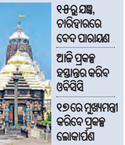
୧୫ରୁ ୧୭ତାରିଖ ପର୍ଯ୍ୟନ୍ତ ଆଜି ପ୍ରକଳ୍ପ ହସ୍ତାନ୍ତର କରିବ ଓଡ଼ିଶା ୧୭ତାରିଖ ମୁଖ୍ୟମନ୍ତ୍ରୀ କରିବେ ପ୍ରକଳ୍ପ ଲୋକାର୍ପଣ

ପୁରୀ, ୧୧/୧ (ସମ୍ପାଦକ): ଅସନ୍ନା ୧୭ତାରିଖ ପୌଷ ଶୁକ୍ଳ ସପ୍ତମୀ ତିଥି ପ୍ରତି ଲକ୍ଷ୍ମୀପୂଜା ପାଇଁ ହେବ ଅବିଭାଗ୍ୟାୟ ଦିନ। ଶ୍ରୀକ୍ଷେତ୍ର ଏବଂ ଶ୍ରୀମନ୍ଦିର ଇତିହାସରେ ଯୋଡ଼ି ହେବ ସ୍ୱର୍ଣ୍ଣମ ଅଧ୍ୟାୟ। ବିଶ୍ୱ ଦେଖିବ ବିଶ୍ୱନିନ୍ଦିତାଙ୍କ ବିଜେସ୍ତ୍ରାଲର ଭବ୍ୟ ରୂପ। ବିଶ୍ୱବାସୀଙ୍କ ନଜର ଖାଣି ଶ୍ରୀମନ୍ଦିର ଚତୁର୍ଥପାର୍ଶ୍ୱ। ଶୁକ୍ରବାରଠାରୁ ଏହି ଐତିହାସିକ ମୁହୂର୍ତ୍ତର ମୁକ୍ତହୁଆ ପଢ଼ିବ। ପ୍ରକଳ୍ପ ଲୋକାର୍ପଣ ପାଇଁ ହେବାକୁ ଥିବା ତ୍ରିବିନାମୁକ୍ତ (୧୫, ୧୬ ଓ ୧୭ ତାରିଖ) ଯଜ୍ଞ ପାଇଁ ଶ୍ରୀମନ୍ଦିରରେ ଶୁକ୍ରବାର ଆଚାର୍ଯ୍ୟବରଣ କରିବେ ଗଜପତି ମହାରାଜା