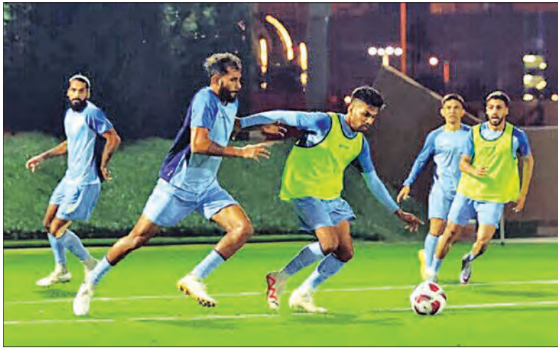
ପାଇନାଲରେ ପ୍ରବେଶ କରି ଶ୍ରେଷ୍ଠ ପ୍ରଦର୍ଶନ କରିଥିଲା । କିନ୍ତୁ ପାଇନାଲରେ ଇସ୍ତଫାପଲଠାରୁ ପରାସ୍ତ ହୋଇ ରନସଫିର୍ରେ ସମସ୍ତ ହୋଇଥିଲା । ୧୯୬୬ରୁ ଅର୍ଥାତ୍ ୬୮ ବର୍ଷ ହେବ ଖେଳାଯାଇ ଆସୁଥିବା ଏହି ବିଶ୍ୱମେଣ୍ଟରେ ଏସିଆ ୨୪ଟି ଦଳ ଅଂଶଗ୍ରହଣ କରିଥିଲା । ଫେବୃଆରୀ ୧୦ରେ ଶେଷ ହେବାକୁଥିବା ଏହି ବିଶ୍ୱମେଣ୍ଟର ମ୍ୟାଚ୍ଗୁଡ଼ିକ କଟାକର ୫ଟି ସହରର ୯ଟି ଭେଦ୍ୟରେ ଖେଳାଯିବ । କଟାକରେ ୨୦୨୨ ଫିଫା ବିଶ୍ୱକପ୍ ସଫଳତାର ସହ ଅନୁଷ୍ଠିତ ହୋଇଥିଲା ।

ନୂଆଦିଲ୍ଲୀ, ୧୧ ଫେବୃଆରୀ (ଏକେଡି) : ମଧ୍ୟପ୍ରାନ୍ତ ଦେଶ କଟାକରେ ଶୁକ୍ରବାରଠାରୁ ଏସିଆ ମହାଦେଶର ସର୍ବବୃହତ୍ ପୂର୍ବରୁ ଚଳୁଥିବା ଏସପିଏ ଏସିଆନ୍ କପ୍ ଆରମ୍ଭ ହେବ । ଶନିବାର ଭାରତ ୨୦୧୫ ଚାମ୍ପିଅନ ଅଷ୍ଟ୍ରେଲିଆ ବିପକ୍ଷରୁ ଅଭିଯାନ ଆରମ୍ଭ କରିବ । ଭାରତୀୟ ପୂର୍ବରୁ ଦଳ ପ୍ରଥମଥର ପାଇଁ କୁମାଗତି ଦ୍ୱିତୀୟଥର ପାଇଁ ଏହି ବିଶ୍ୱମେଣ୍ଟ ଖେଳିବାକୁ ଯୋଗ୍ୟତା ଅର୍ଜନ କରିଛି । ଭାରତ ଏଥର ଅଷ୍ଟ୍ରେଲିଆ, ଉଇକେଟିଆ ଓ ସିରିଆ ସହ ଗୁପ୍ତ ବିଂରେ ସାମିଲ ହୋଇଛି । ଭାରତ ୫ମଥର ପାଇଁ ଏସିଆନ୍ କପ୍ ଖେଳିବାକୁ ଯାଉଛି । ଏସିଆନ୍ ଶ୍ରେଣୀ ୨୪ ଦଳ ଭାରତ ପାଇଁ ଏହି ବିଶ୍ୱମେଣ୍ଟରେ ଚ୍ୟାଲେଞ୍ଜ ପୁଷ୍ଟି କରିବେ । ଶୁକ୍ରବାର ଉଦ୍‌ଘାଟନା ମ୍ୟାଚ୍ରେ ଆୟୋଜକ କଟାକ ଓ ଲେଦାନନ ପରସ୍ପରକୁ ଭେଟିବେ । ଗତ ୬୮ ବର୍ଷ ହେବ ଭାରତ ଏହି ବିଶ୍ୱମେଣ୍ଟ ଖେଳୁଥିଲା ମଧ୍ୟ କେବେ ହେଲେ ଚାମ୍ପିଅନ ହୋଇପାରିନାହିଁ । ତେବେ ୧୯୬୪ ଭାରତ