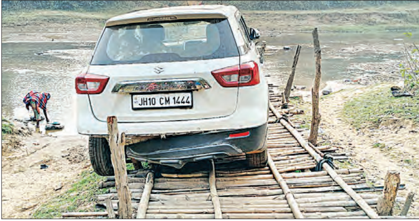
ଏହା ଜାଣିପାରି ସଜେ ସଜେ ମୟୂରଭଞ୍ଜ ଜିଲ୍ଲା ସୂଚନା ଦେଇଥିଲା। ସୂଚନା ପାଇ ଖୁଣ୍ଟା ଆଇଆଇଏସ ଖୁଣ୍ଟା ଓ ଉଦ୍‌କା ପୁଲିସକୁ ଉକ୍ତ ଗାଡ଼ି ସମ୍ପର୍କରେ ସୂଚନା ଖମାଖାନ୍ଦ ନେତୃତ୍ୱରେ ଗଠିତ ଟିମ୍ ଆନା

ଏଟିଏମ୍ ଲୁଚେ କରି ଫେରାର ହେବାକୁ ଲୁଚେରା ବିକମ୍ପିତ ରାତିରେ ଫେରିବା ବାଟରେ ପୁଲିସ ହାତୁଡ଼ରେ ପଡ଼ିଲେ। ଧରାପଡ଼ିଯିବା ଭୟରେ ଗାଡ଼ି ଛାଡ଼ି ଘଟଣାସ୍ଥଳରୁ ଫେରାର ହୋଇଯାଇଛନ୍ତି ଅନ୍ତଃରାଜ୍ୟ ଲୁଚେରା ଗ୍ୟାଙ୍ଗ। ଏ ଭଳି ଘଟଣା ଦେଖିବାକୁ ମିଳିଛି ଖୁଣ୍ଟା ଥାନା ଅଧୀନ ତମ୍ପାଗଡ଼ି ଗ୍ରାମରେ। ପୁଲିସ ସ୍ୱତନ୍ତ୍ର ପ୍ରକାଶ ଯେ, ରୁଧିବାର ବିକମ୍ପିତ ରାତିରେ ବାଲେଶ୍ୱର ଜିଲ୍ଲାର ସୋର ଓ ଖଇରାଉର ୨ଟି ଏଟିଏମ୍ ଲୁଚେ କରିଥିଲେ। ଏମାନଙ୍କ ସମ୍ପର୍କରେ ବାଲେଶ୍ୱର ପୁଲିସ ସୂଚନା ପାଇଥିଲା। ଲୁଚେରାକୁ ଧରିବା ପାଇଁ ପାଇଁ ବାଲେଶ୍ୱର ଜିଲ୍ଲାର ବିଭିନ୍ନ ଥାନାକୁ ସୂଚନା ଦିଆଯାଇଥିଲା; ହେଲେ ଗାଡ଼ିକୁ ଧରିପାରି ନ ଥିଲେ। ପୁଲିସ ଭୟରେ ଲୁଚେରା ଟିମ୍ ଗାଡ଼ିଟି ମୟୂରଭଞ୍ଜ ଜିଲ୍ଲାରେ ପ୍ରବେଶ କରାଇଥିଲେ। ବାଲେଶ୍ୱର ପୁଲିସ