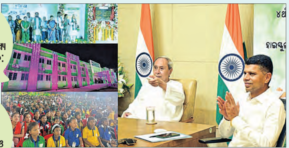
ପ୍ରଥମ ଦିନରେ ୩୮୯ ସ୍କୁଲ ଲୋକାର୍ପଣ ପୂର୍ବରୁ ସରିଛି ୬୮୮୩ ସ୍କୁଲ ଲୋକାର୍ପଣ ଚଳିତ ପର୍ଯ୍ୟାୟରେ ୧୭୯୪ ସ୍କୁଲ ଲୋକାର୍ପଣ

ରୂପାନ୍ତରଣର ଶ୍ରେଣୀ ସ୍ଥାନୀୟ ଜନପ୍ରତିନିଧି, ପରିଚାଳନା କମିଟି ଓ ଜନସାଧାରଣଙ୍କର '୫-ଟି' ଅଧ୍ୟକ୍ଷ