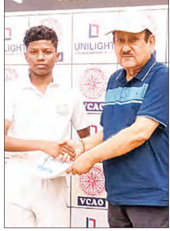
ଭୁବନେଶ୍ୱର, ୧୧ ଫେବୃଆରୀ

ଭୁବନେଶ୍ୱରରେ ଆୟତ୍ତ ସେମିରେ ଭାରତୀୟ ଟ୍ରଷ୍ଟ୍ ଦର୍ଶାଏ। ମ୍ୟାଚର ଆରମ୍ଭ ହେବ। ଶନିବାର ଭାରତ ୨୦୧୫ ଚାମ୍ପିୟନ ଅଷ୍ଟ୍ରେଲିଆ ବିପକ୍ଷରୁ ଅଭିଯାନ ଆରମ୍ଭ କରିବ। ଭାରତୀୟ ଟ୍ରଷ୍ଟ୍ ଦର୍ଶାଏ।