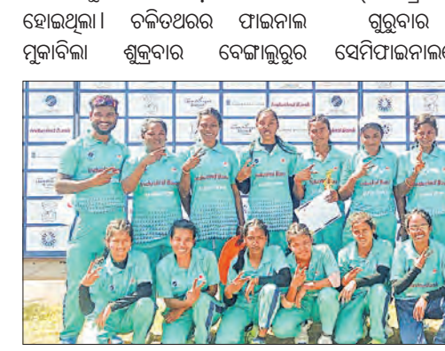
କର୍ଣ୍ଣାଟକକୁ ହରାଇ ଓଡ଼ିଶା ଚାମ୍ପିଅନ ହୋଇଥିଲା । ଚଳିତଥରର ପାଇନାଲ ମୁକାବିଲା ଶୁକ୍ରବାର ବେଙ୍ଗାଲୁରୁର ସେମିଫାଇନାଲରେ ପ୍ରଥମେ ବ୍ୟାଟିଂ

ଓଡ଼ିଶା ଦଳ ଜାତୀୟ ଦୃଷ୍ଟିହୀନ ମହିଳା କ୍ରିକେଟ୍ ପାଇନାଲରେ ପ୍ରବେଶ କରିଛି । କେନ୍ଦ୍ରାପଡ଼ାରେ ଚାଲିଥିବା ଏହି ଟୁର୍ଣ୍ଣାମେଣ୍ଟର ପ୍ରଥମ ସେମିଫାଇନାଲରେ ଓଡ଼ିଶା ୧୯ ରନ୍‌ରେ ଅକ୍ତିଆର ହୋଇ ପରାସ୍ତ ହୋଇଛି । ସେହିପରି ଦ୍ୱିତୀୟ ସେମିଫାଇନାଲରେ ଦିଲ୍ଲୀକୁ ହରାଇ କର୍ଣ୍ଣାଟକ ପାଇନାଲରେ ପ୍ରବେଶ କରିଛି । ଏହା ପାକରେ କ୍ରମାଗତ ଚତୁର୍ଥବର୍ଷ ଲାଗି ଓଡ଼ିଶା ଓ କର୍ଣ୍ଣାଟକ ମଧ୍ୟରେ ପାଇନାଲ ମୁକାବିଲା ହେବ । ଗତଥର