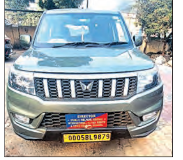
କାଉନସିଲର ନିର୍ଦ୍ଦେଶ କରୁଥିବା ଭୁବନେଶ୍ୱର

ଡାଇରେକ୍ଟର ବୋଲି ଜଣା ହୋଇଥିଲା। ଗାଡ଼ିରେ ବସିଥିବା ଦୁଇ ବ୍ୟକ୍ତି ଜଣଙ୍କୁ ଦେଖି ପୁଲିସ୍ ସହର ସହର ହୋଇଥିଲା। ତେଣୁ ସେମାନଙ୍କ ଗାଡ଼ି କାରଖାନାରେ ପ୍ରମାଣପତ୍ର ଦେବାକୁ ପୁଲିସ୍ କହିଥିଲା। ବ୍ରାଉଜର ଓ ଡାଇରେକ୍ଟର ବୋଲି କହିଥିବା ବ୍ୟକ୍ତି ଜଣଙ୍କ ସଠିକ କାଗଜପତ୍ର ଓ ସତ୍ୟାପନକର ଉତ୍ତର ଦେଇପାରି ନଥିଲେ। ଶେଷରେ ପୁଲିସ୍ ଗାଡ଼ିକୁ ଜବତ କରି ଥାନାକୁ ଆଣି ଉତ୍ତରକୁ ଜେଲ କରିଥିଲା। ଜେଲା ବେଳେ ନିଜକୁ ହୁଏମାନ ରାଇଟ୍‌ସ୍