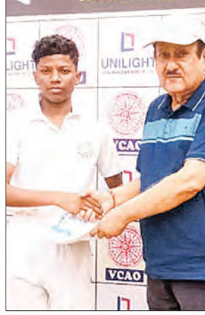
ଭୁବନେଶ୍ୱର, ୧୧ (ସମିସ)