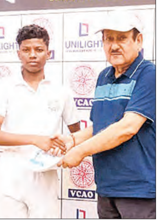
ଭୁବନେଶ୍ୱର, ୧୧ (ସମିସ)