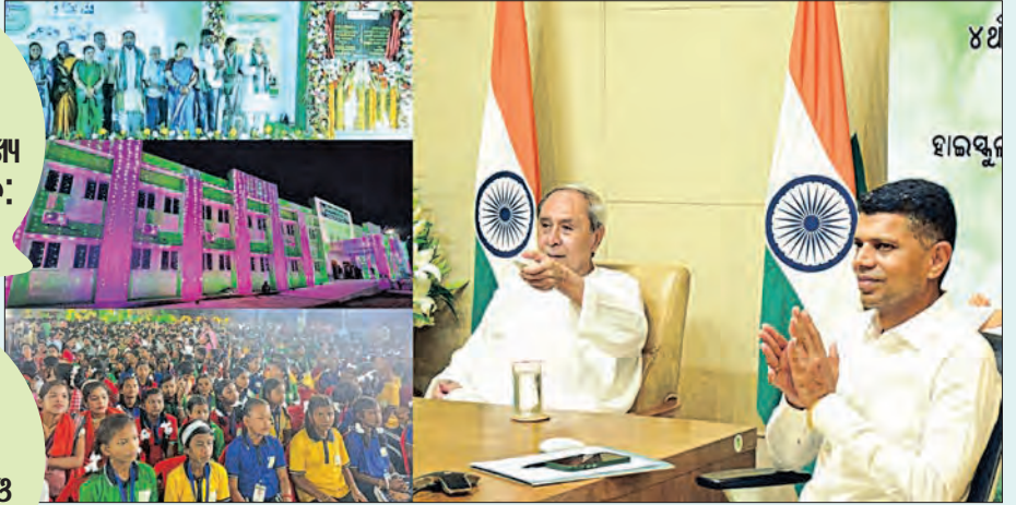
ପ୍ରଥମ ଦିନରେ ୩୮୯ ସ୍କୁଲ ଲୋକାର୍ପଣ ପୂର୍ବରୁ ସରିଛି ୬୮୮୩ ସ୍କୁଲ ଲୋକାର୍ପଣ ଚଳିତ ପର୍ଯ୍ୟାୟରେ ୧୭୯୪ ସ୍କୁଲ ଲୋକାର୍ପଣ

ରୂପାନ୍ତରଣର ଶ୍ରେଣୀ ସ୍ଥାନୀୟ ଜନପ୍ରତିନିଧି, ପରିଚାଳନା କମିଟି ଓ ଜନସାଧାରଣଙ୍କର '୫-ଟି' ଅଧ୍ୟକ୍ଷ